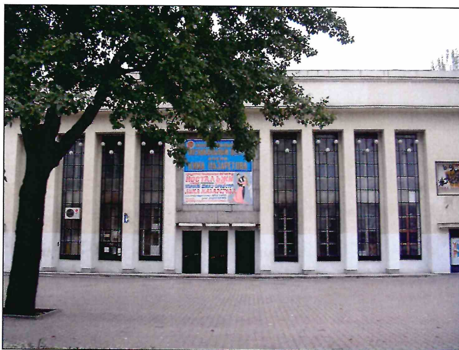
4. «Здание театра ГОМЭЦ, с 1959 г. – кинотеатр «Россия», 1935 г., арх. Л.Ф. Эберг, Л.Л. Эберг. Реконструкция 1959 г., арх. Л.Л. Эберг, инж. А.Е. Журавлев». Восточный фасад. Фото 2005 г.