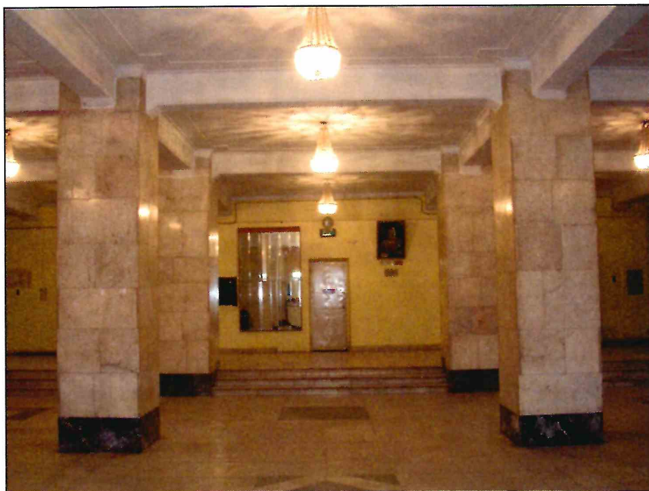
9. «Здание театра ГОМЭЦ, с 1959 г. – кинотеатр «Россия», 1935 г., арх. Л.Ф. Эберг, Л.Л. Эберг. Реконструкция 1959 г., арх. Л.Л. Эберг, инж. А.Е. Журавлев». Фрагмент помещения № 8-8а первого этажа. Фото 2005г.