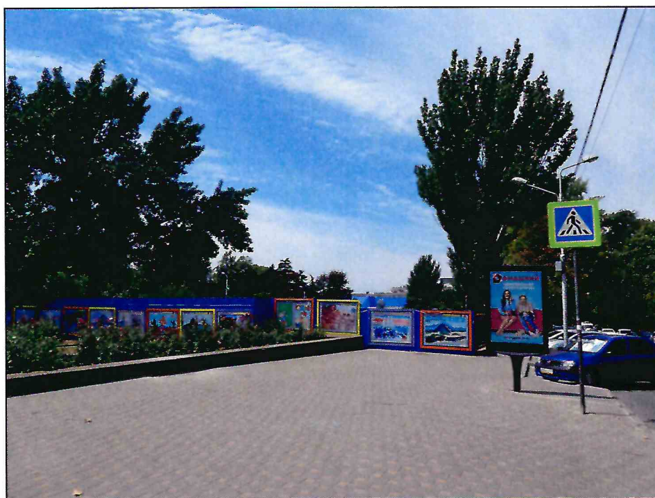
10. «Здание театра ГОМЭЦ, с 1959 г. – кинотеатр «Россия», 1935 г., арх. Л.Ф. Эберг, Л.Л. Эберг. Реконструкция 1959 г., арх. Л.Л. Эберг, инж. А.Е. Журавлев». Вид на место расположения объекта культурного наследия с северо-востока.