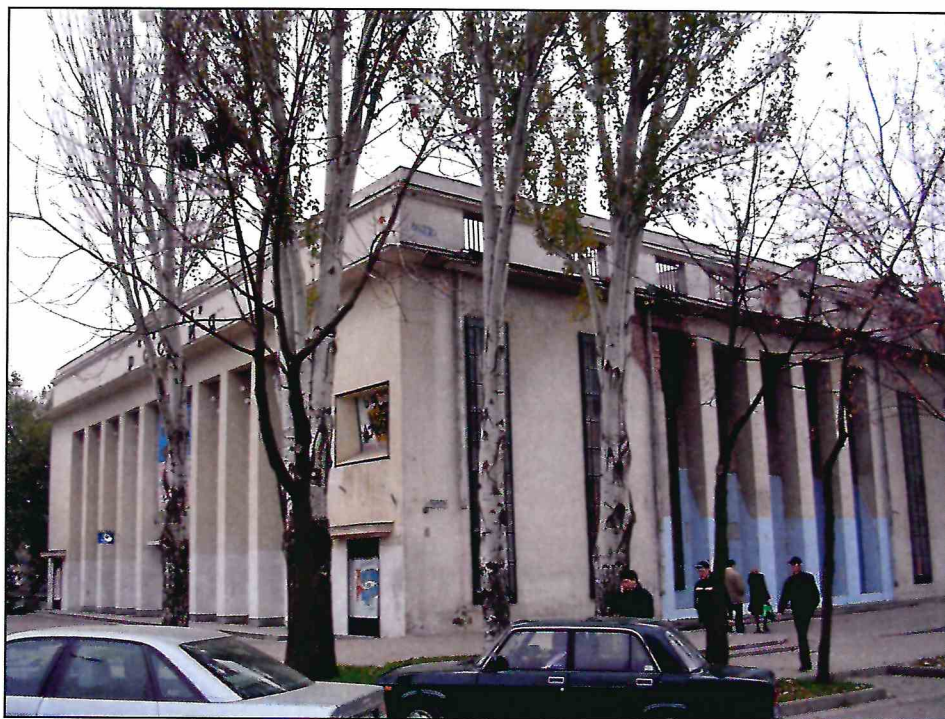
3. «Здание театра ГОМЭЦ, с 1959 г. – кинотеатр «Россия», 1935 г., арх. Л.Ф. Эберг, Л.Л. Эберг. Реконструкция 1959 г., арх. Л.Л. Эберг, инж. А.Е. Журавлев». Общий вид здания с северо-востока. Фото 2005 г.