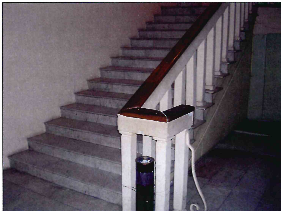
8. «Здание театра ГОМЭЦ, с 1959 г. – кинотеатр «Россия», 1935 г., арх. Л.Ф. Эберг, Л.Л. Эберг. Реконструкция 1959 г., арх. Л.Л. Эберг, инж. А.Е. Журавлев». Внутренняя междуэтажная лестница. Фото 2005 г.