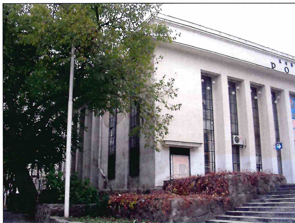
6. «Здание театра ГОМЭЦ, с 1959 г. – кинотеатр «Россия», 1935 г., арх. Л.Ф. Эберг, Л.Л. Эберг. Реконструкция 1959 г., арх. Л.Л. Эберг, инж. А.Е. Журавлев». Общий вид здания с юго-востока. Фото 2005 г.