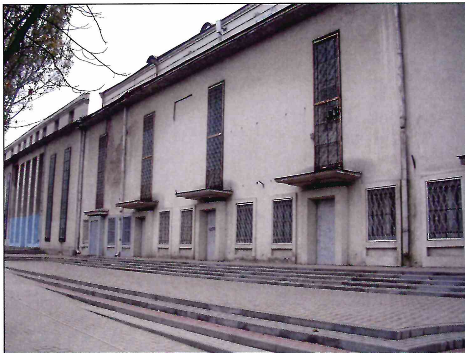
5. «Здание театра ГОМЭЦ, с 1959 г. – кинотеатр «Россия», 1935 г., арх. Л.Ф. Эберг, Л.Л. Эберг. Реконструкция 1959 г., арх. Л.Л. Эберг, инж. А.Е. Журавлев». Общий вид здания с северо-запада. Северный фасад. Фото 2005 г.