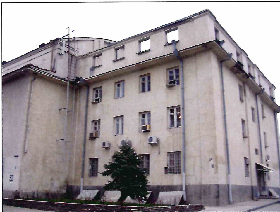
7. «Здание театра ГОМЭЦ, с 1959 г. – кинотеатр «Россия», 1935 г., арх. Л.Ф. Эберг, Л.Л. Эберг. Реконструкция 1959 г., арх. Л.Л. Эберг, инж. А.Е. Журавлев». Вид здания с северо-запада. Фото 2005 г.