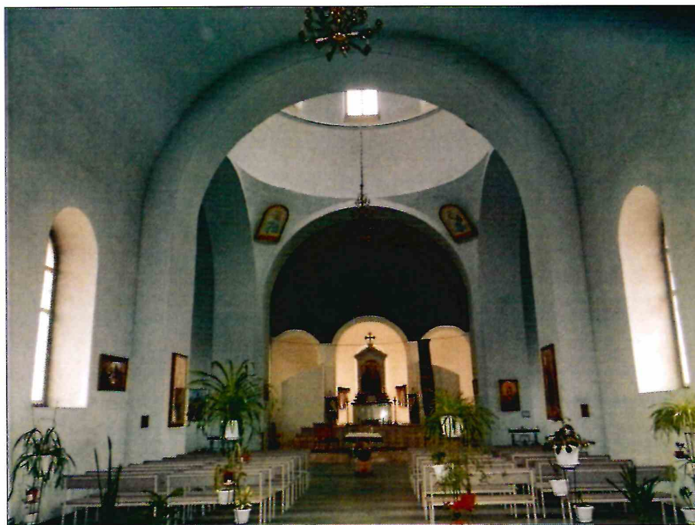
8. Фрагмент интерьера Объекта.