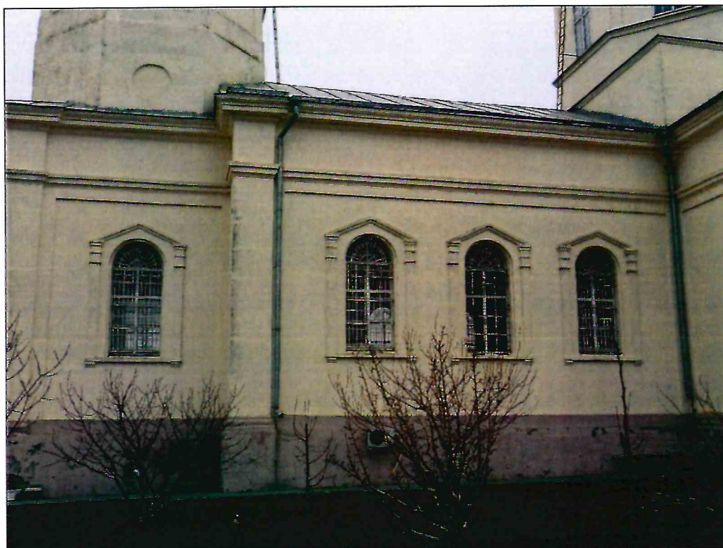
7. Фрагмент юго-восточного фасада Объекта.