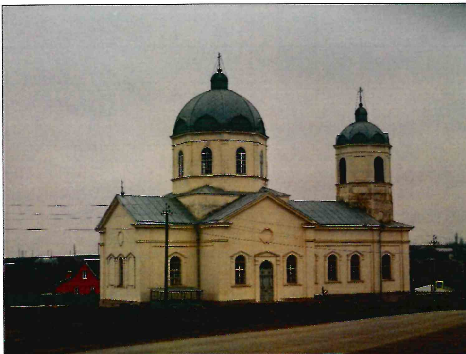
2. Вид Объекта с северо-северо-запада.