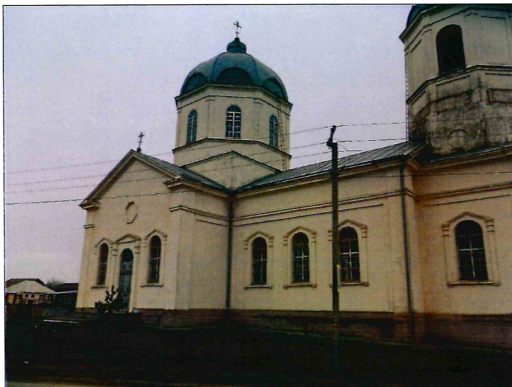
6. Фрагмент северо-западного фасада. Вид Объекта с запада.