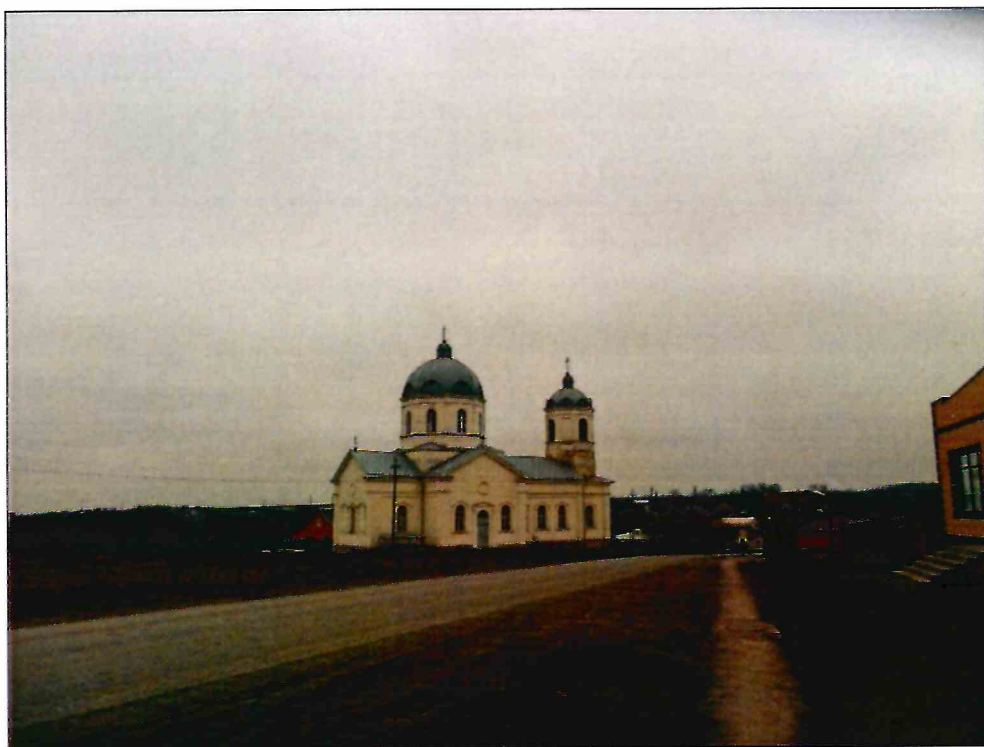
1. Общий вид Объекта в застройке ул. Ленина.