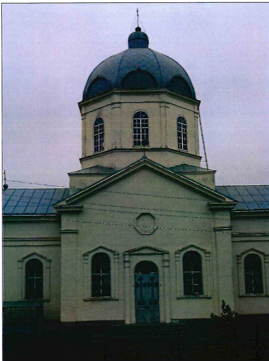
4. Фрагмент северо-западного фасада Объекта. Северный придел.