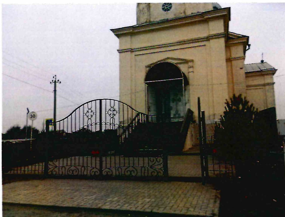
5. Главный западный вход в Объект. Вид с юго-запада.