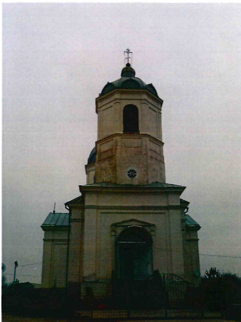
3. Вид Объекта с юго-запада.