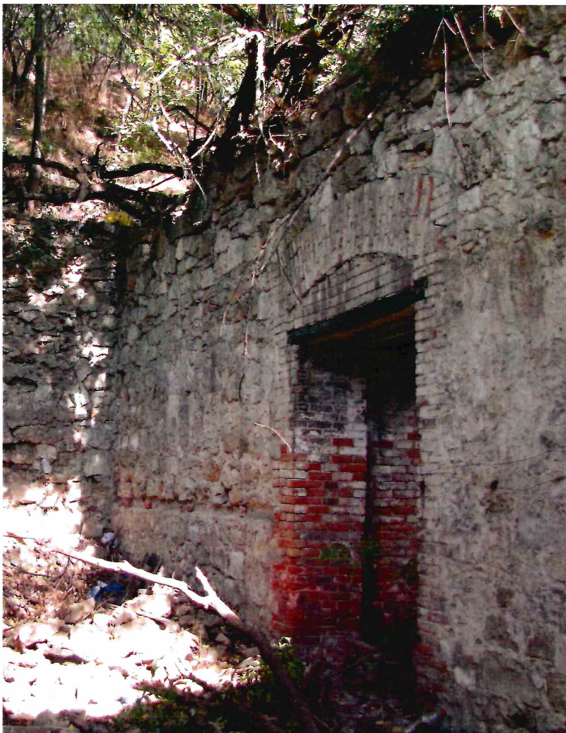
7. Помещение № 3 Объекта.