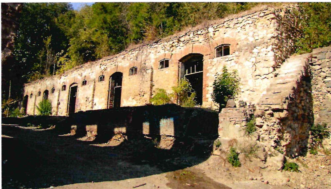
1. Объект культурного наследия «Склад портовый каменный, конец XVIII в. — XIX в.» (далее – Объект). Вид Объекта с юго-востока.