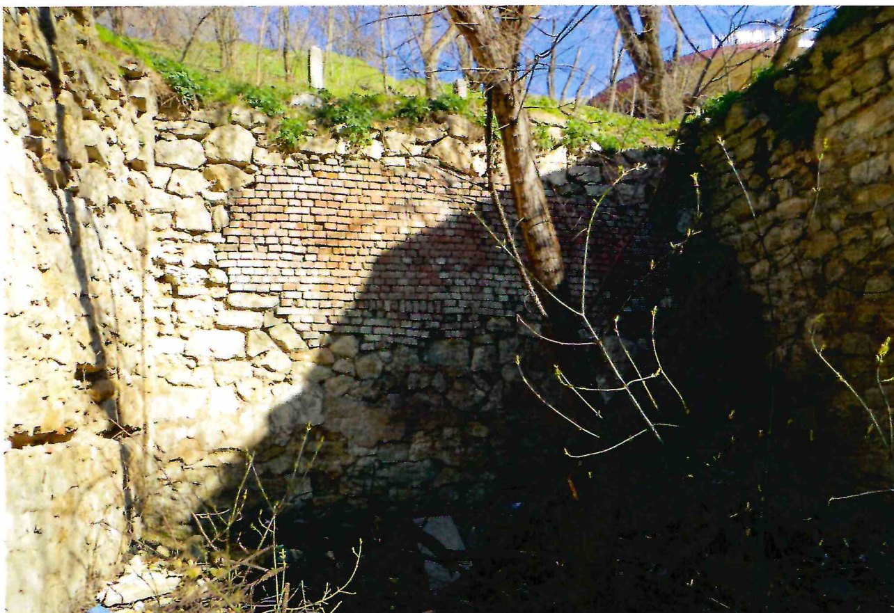
5. Помещение № 1 Объекта.