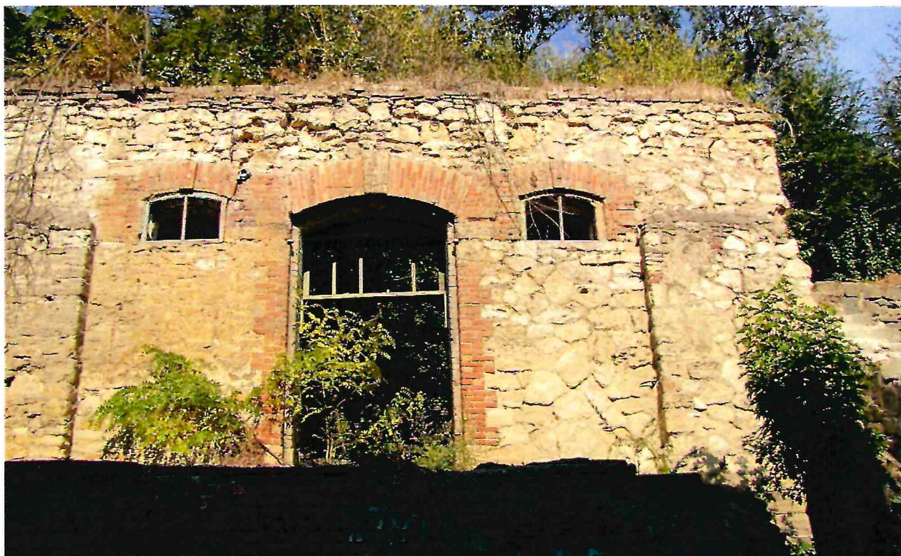
3. Фрагмент южного фасада Объекта.