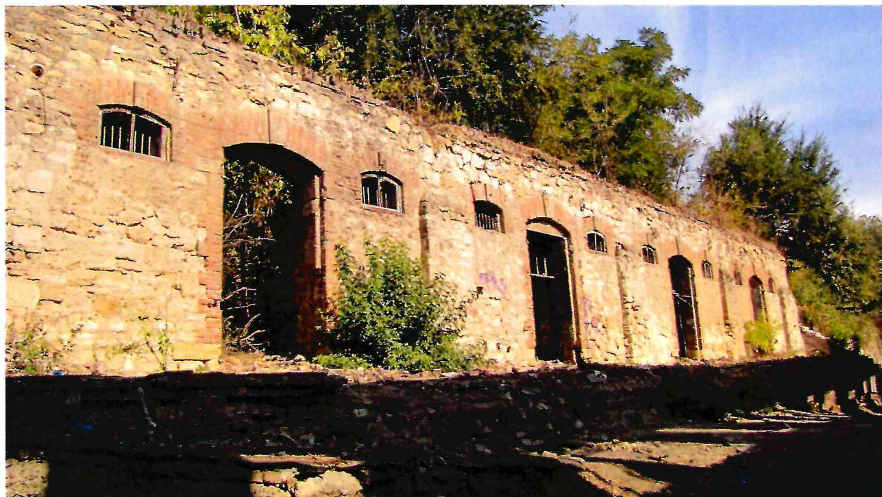
2. Вид Объекта с юго-запада.