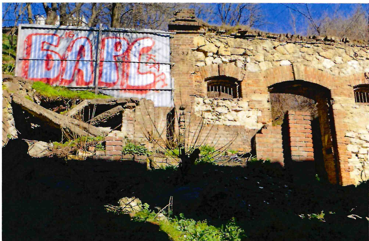
4. Фрагмент южного фасада Объекта.