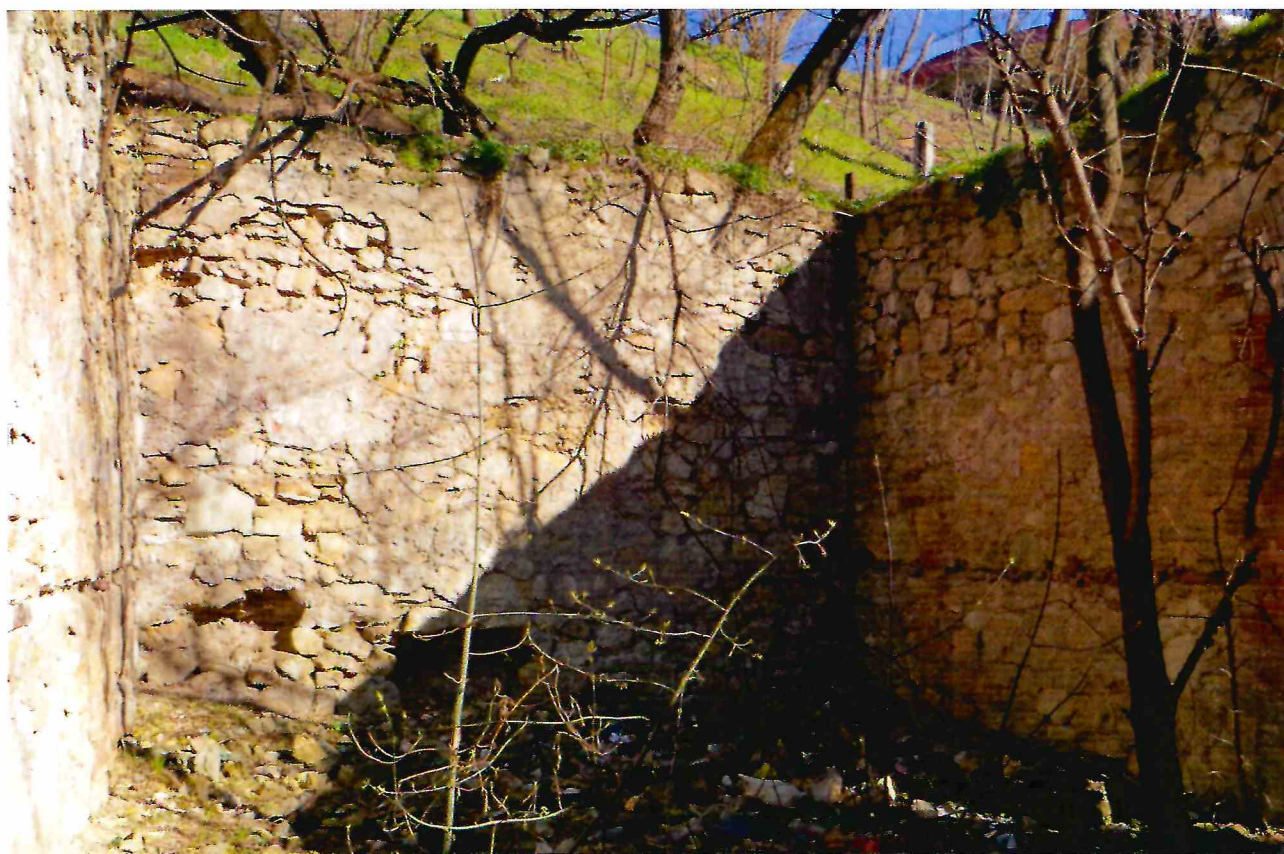
6. Помещение № 2 Объекта.