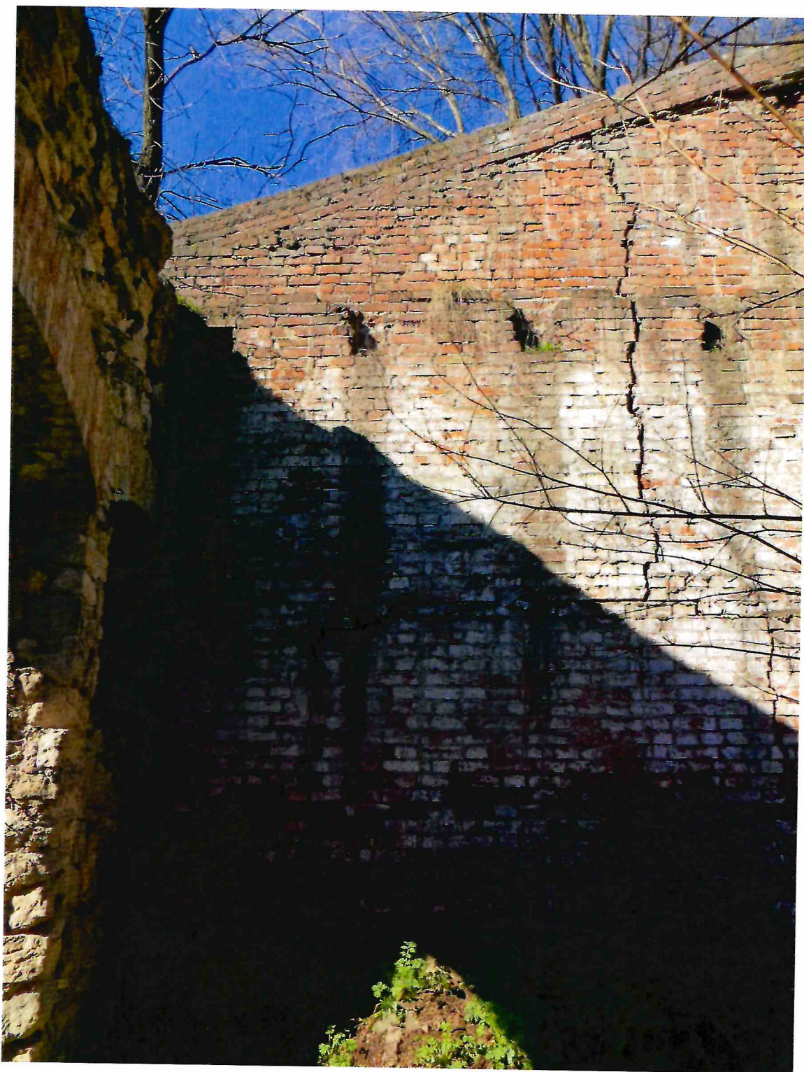
8. Помещение № 5 Объекта.