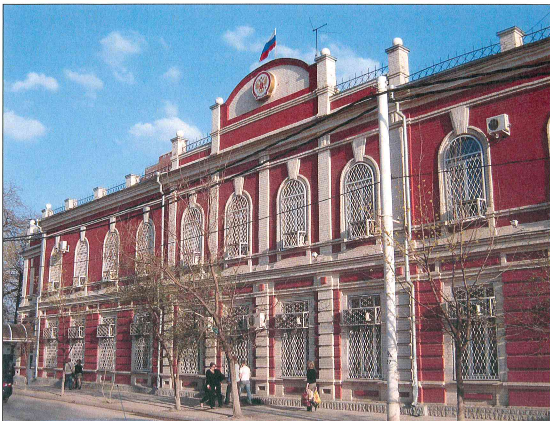
1. «Здание Нахичеванской мужской гимназии, 1912 г., арх. Н.Н. Дурбах». Общий вид главного северного фасада.