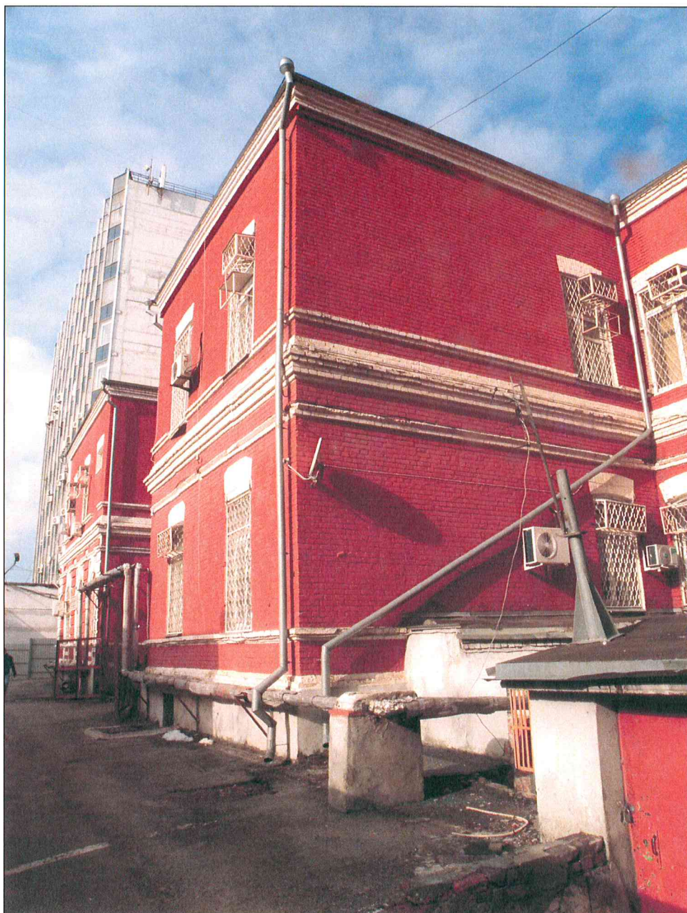
3. «Здание Нахичеванской мужской гимназии, 1912 г., арх. Н.Н. Дурбах». Ризалиты дворовых фасадов.