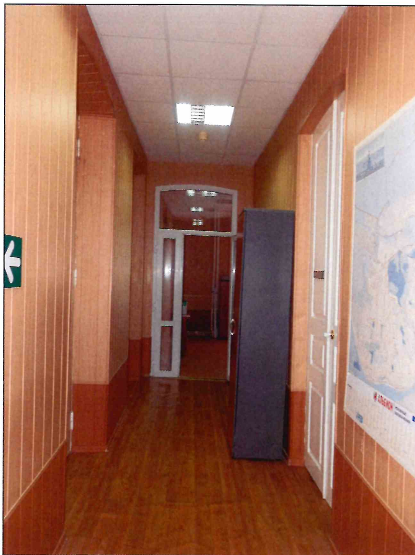
12. «Доходный дом В.А. Павлова, кон. XIX - нач. XX вв.». Помещение коридора второго этажа. Западная часть.