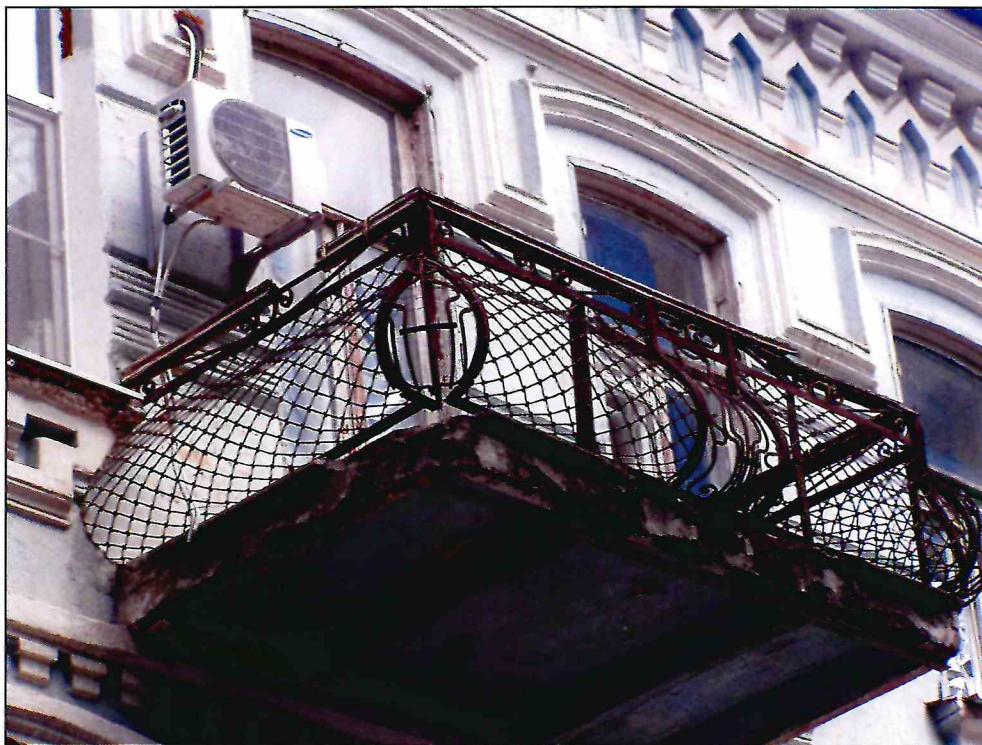
5. «Доходный дом В.А. Павлова, кон. XIX - нач. XX вв.». Фрагмент главного южного фасада в уровне второго этажа. Ограждение балкона.