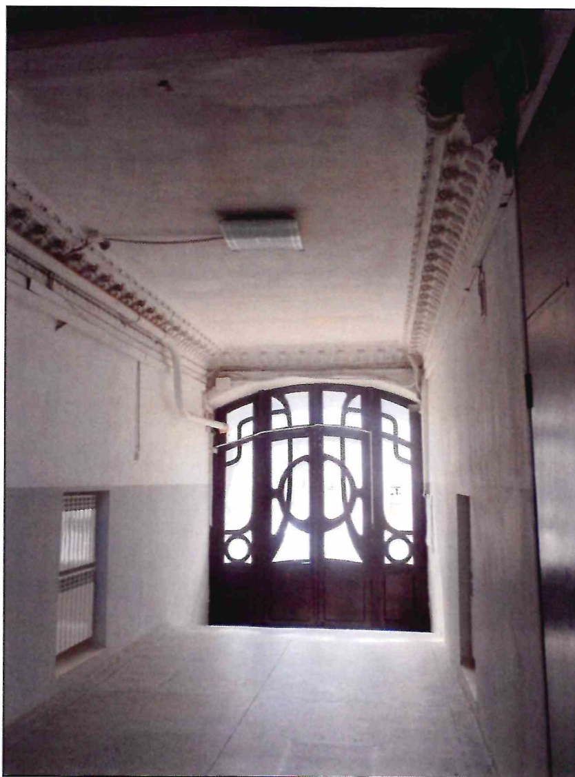
10. «Доходный дом В.А. Павлова, кон. XIX - нач. XX вв.». Вестибюль парадного входа.