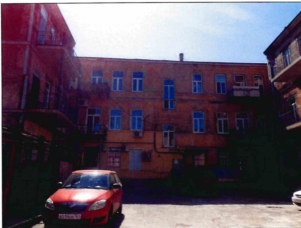
8. «Доходный дом В.А. Павлова, кон. XIX - нач. XX вв.». Общий вид с севера. Дворовые фасады.