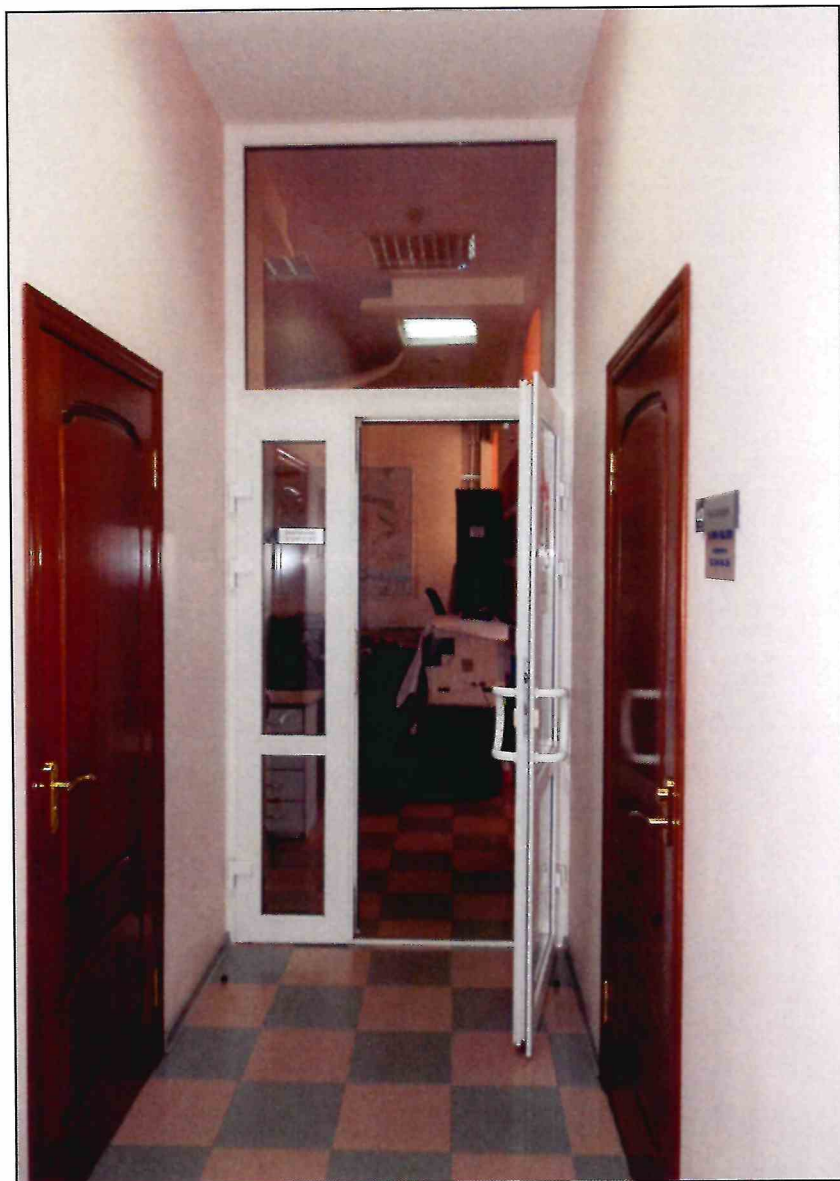
13. «Доходный дом В.А. Павлова, кон. XIX - нач. XX вв.». Коридор в восточной части второго этажа.