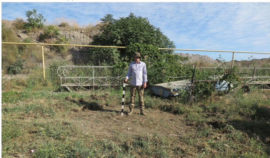
Рис. 10. Шурф 1. До работ. Вид с Ю.