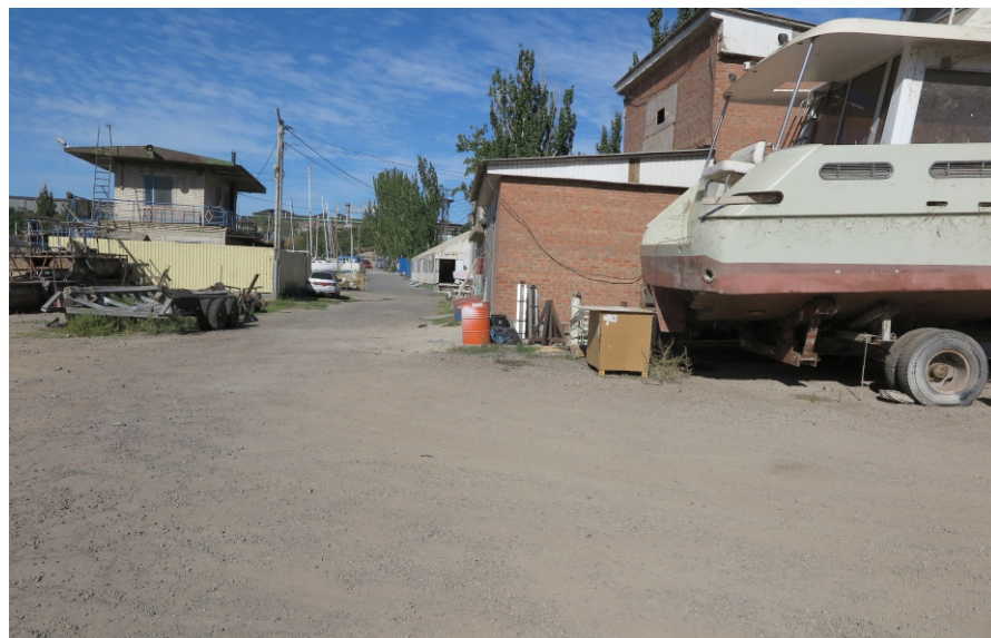
Рис. 6. ТС 2. Вид с ВЮВ.