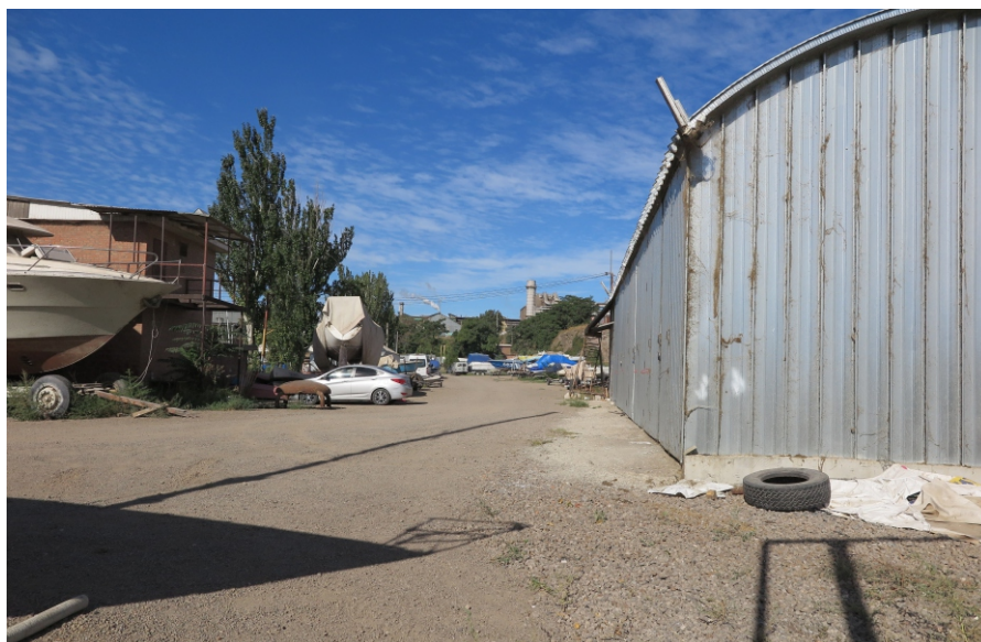
Рис. 5. ТС 1. Вид с ВЮВ.

ГИКЭ земельного участка по адресу: Ростовская обл., г. Таганрог, ул. Социалистическая, 150-д .