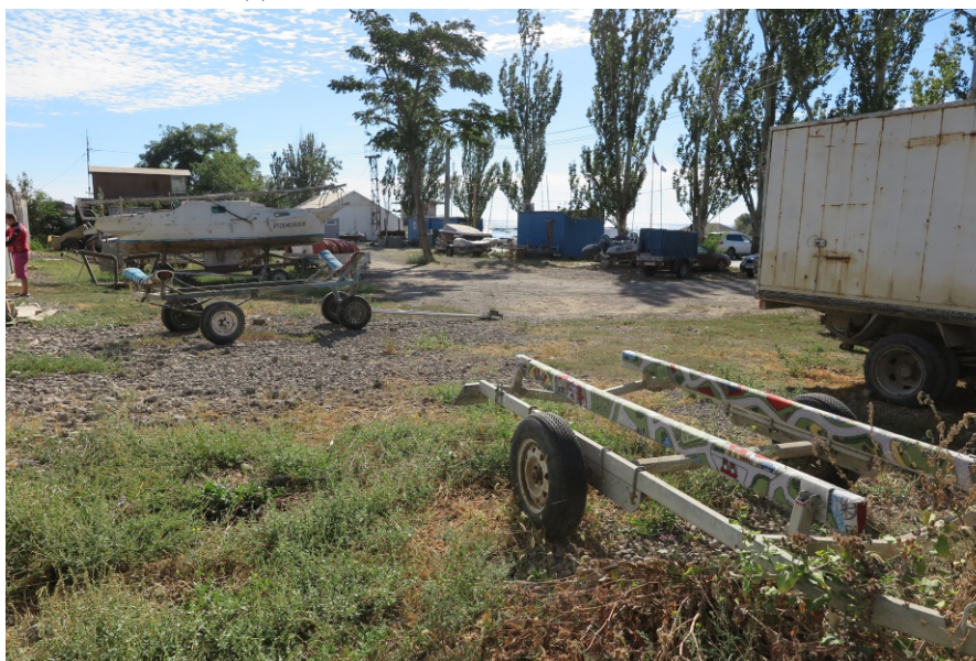
Рис. 9. ТС 5. Вид с СЗ.