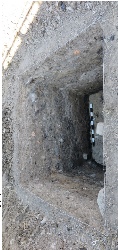
Рис. 12. Шурф 1. Вид с Ю.