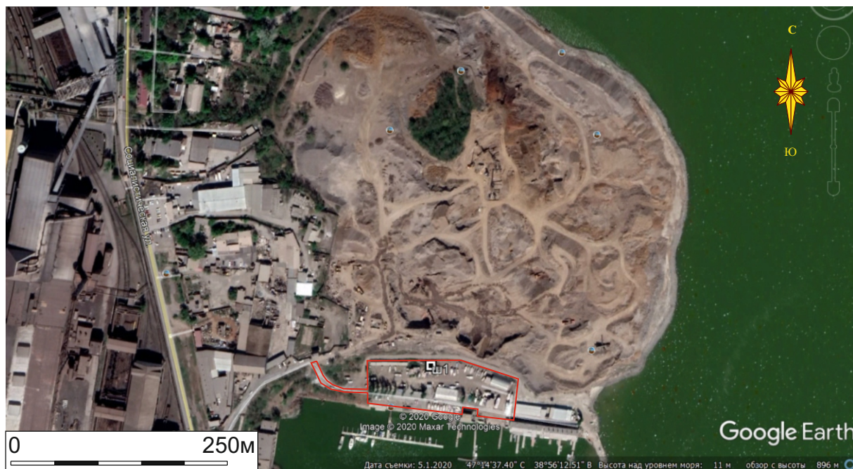
Рис. 3. Расположение обследуемого земельного участка и шурфа на космоснимке г. Таганрога (Дата съемки 01.05.2020).

ГИКЭ земельного участка по адресу: Ростовская обл., г. Таганрог, ул. Социалистическая, 150-д .