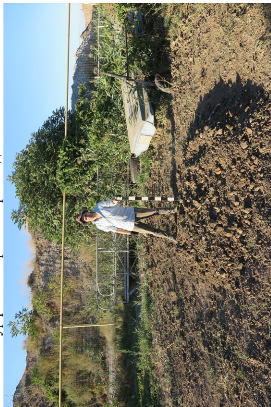
Рис. 14. Шурф 1. После засыпки. Вид с Ю.