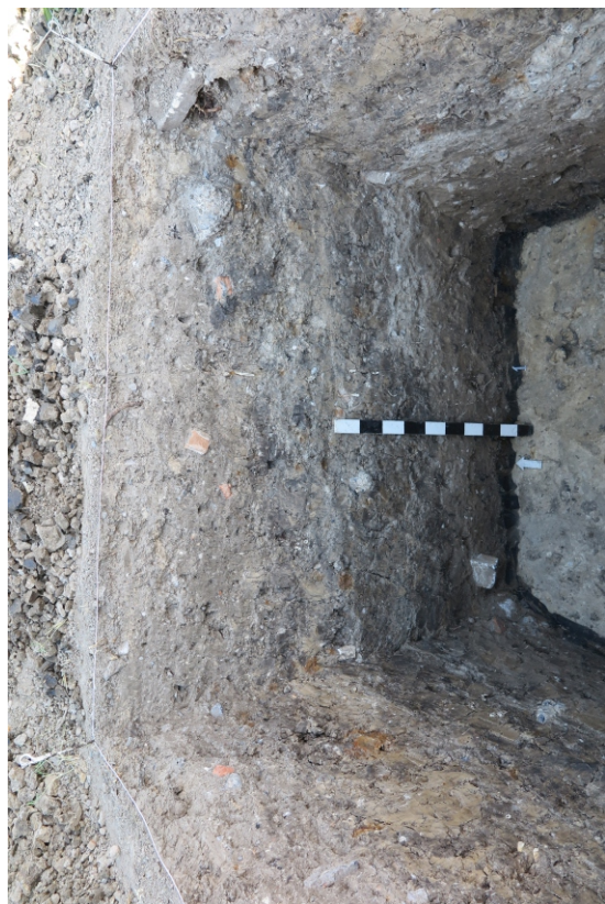
Рис. 13. Шурф 1. Северный борт. Вид с Ю.

ГИКЭ земельного участка по адресу: Ростовская обл., г. Таганрог, ул. Социалистическая, 150-д .