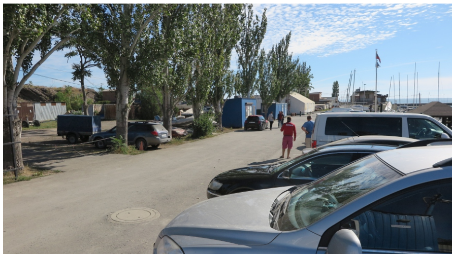
Рис. 7. ТС 3. Вид с ЗЮЗ.