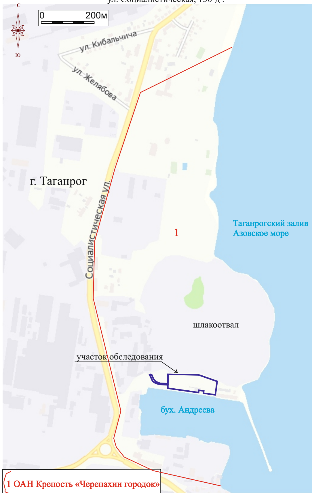
Рис.2. План расположения обследованного участка и зона охраны ОАН Крепость «Черепихин городок» на карте г. Таганрога.

ГИКЭ земельного участка по адресу: Ростовская обл., г. Таганрог, ул. Социалистическая, 150-д .