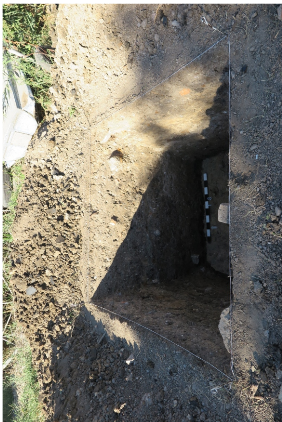
Рис. 11. Шурф 1 на местности. Вид с Ю.