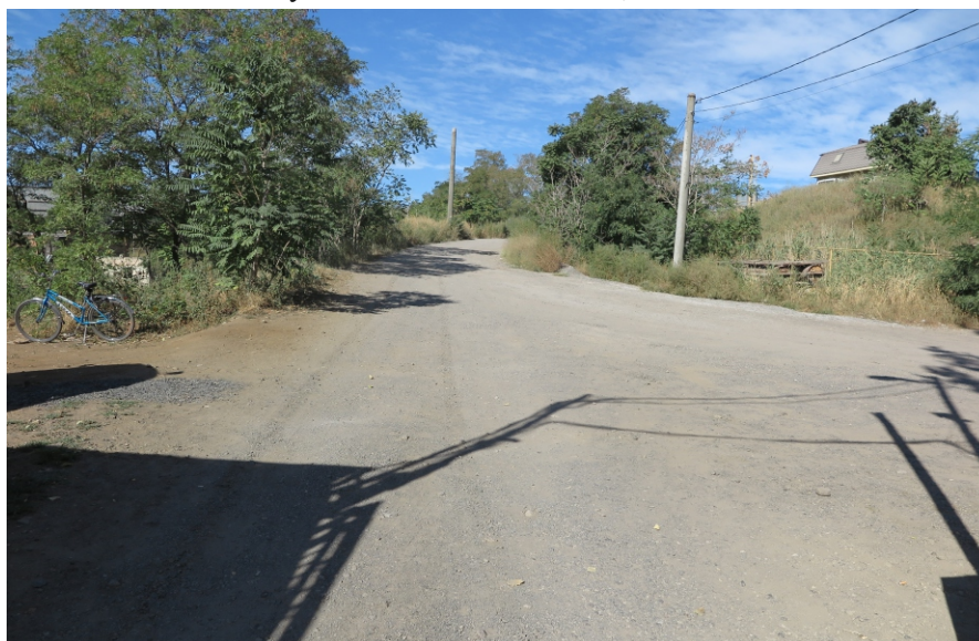
Рис. 8. ТС 4. Вид с ВЮВ.

ГИКЭ земельного участка по адресу: Ростовская обл., г. Таганрог, ул. Социалистическая, 150-д .