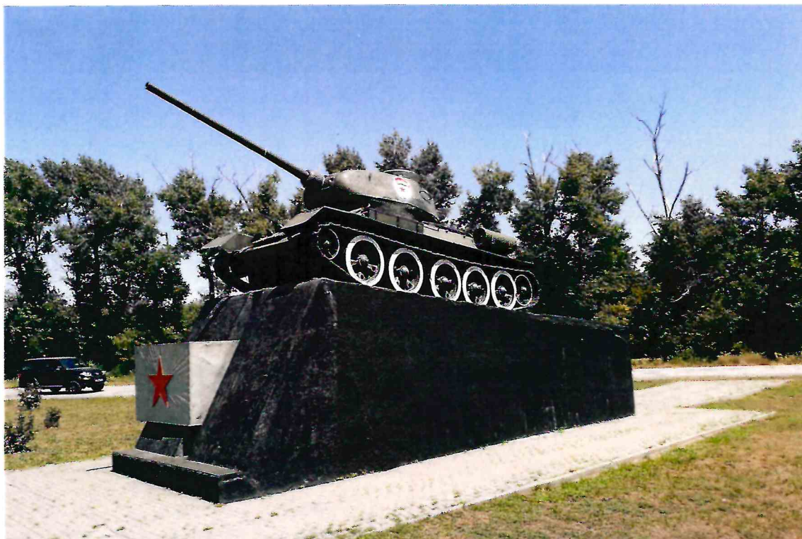
1. Общий вид Объекта с юго-запада.