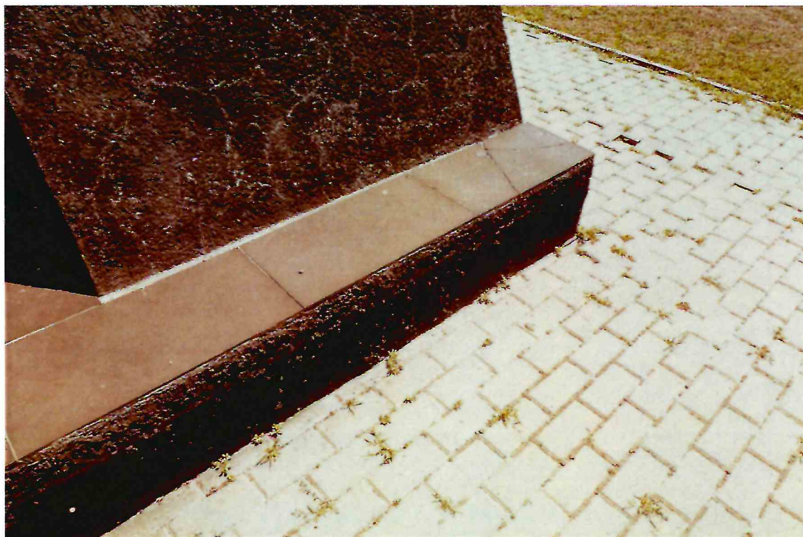
6. Фрагмент облицовки постамента.