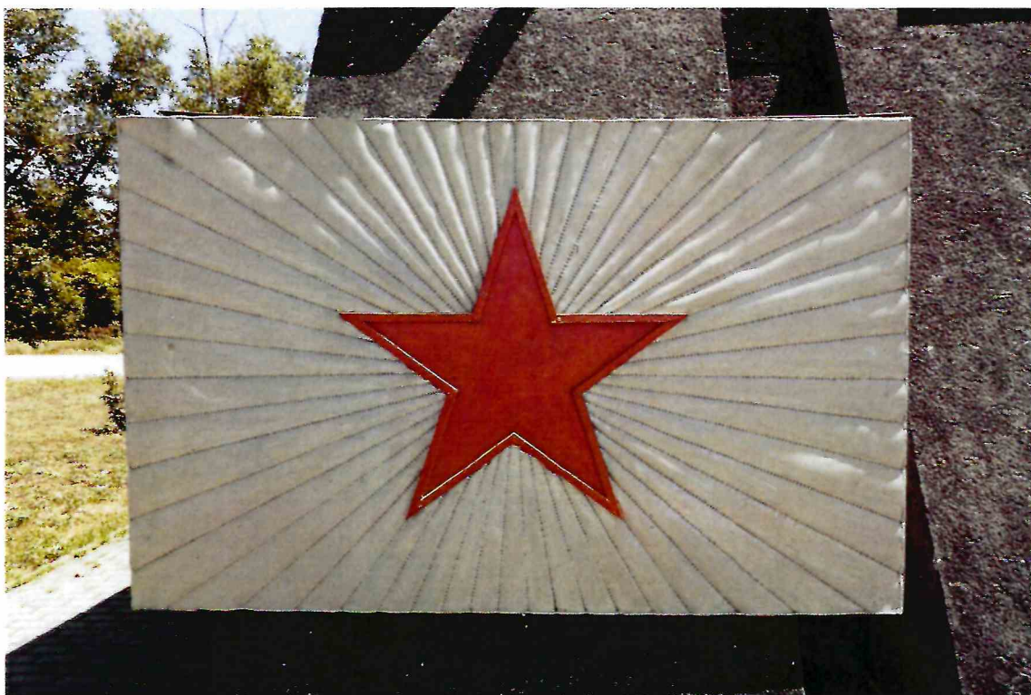
5. Барельеф на западном фасаде Обьекта.