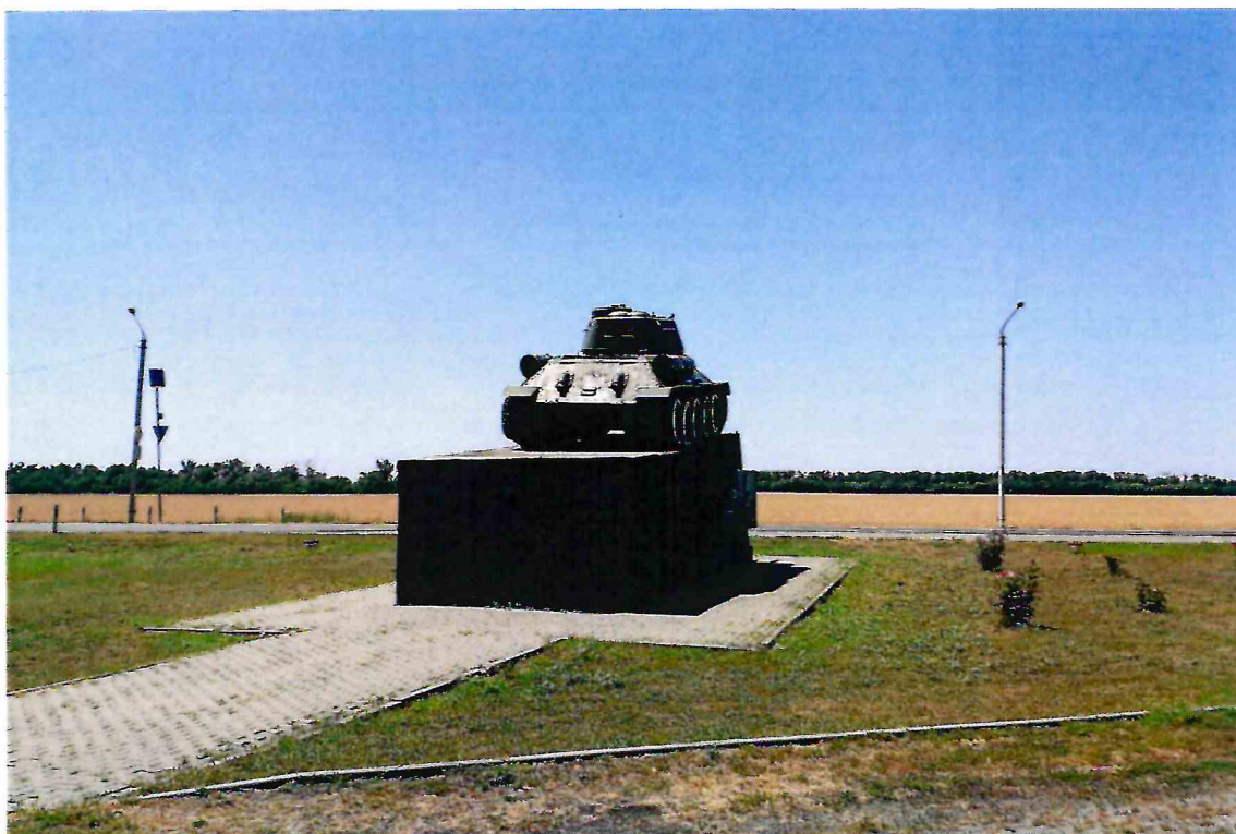
3. Общий вид Объекта с северо-востока.