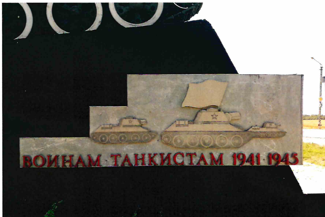
4. Барельеф на северном фасаде Объекта.