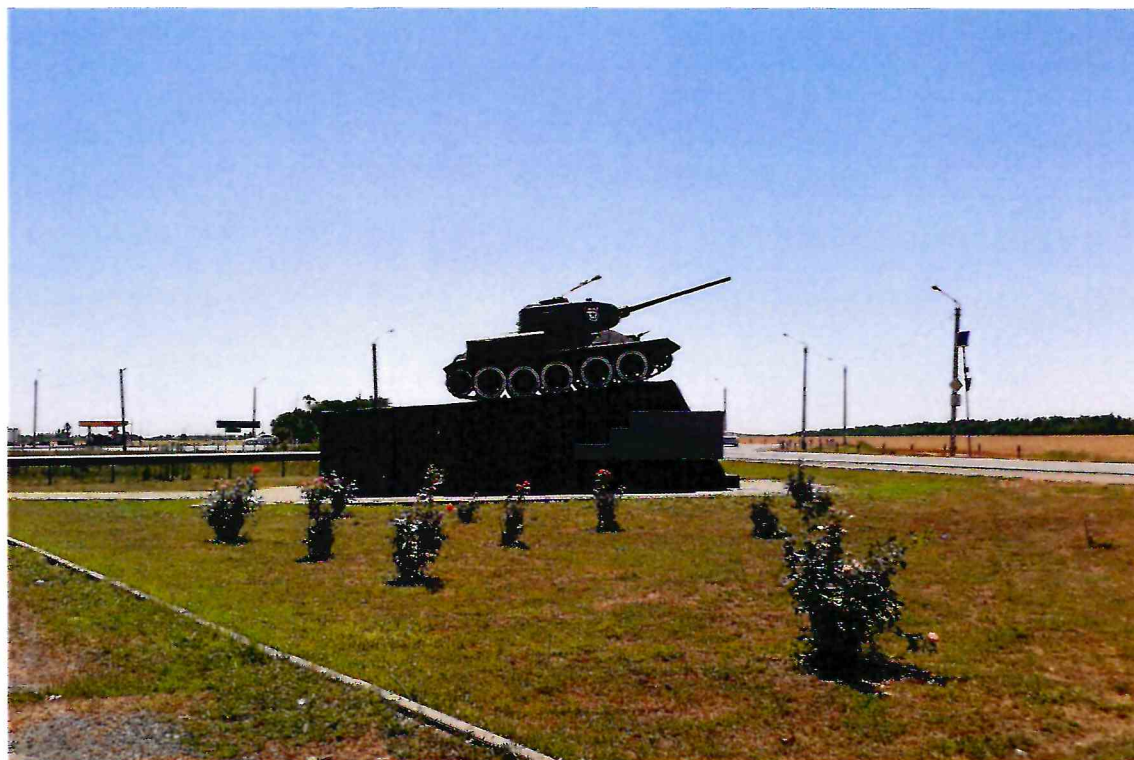
2. Общий вид Объекта с севера.