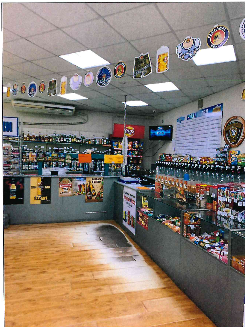
8. Фрагмент внутреннего помещения.