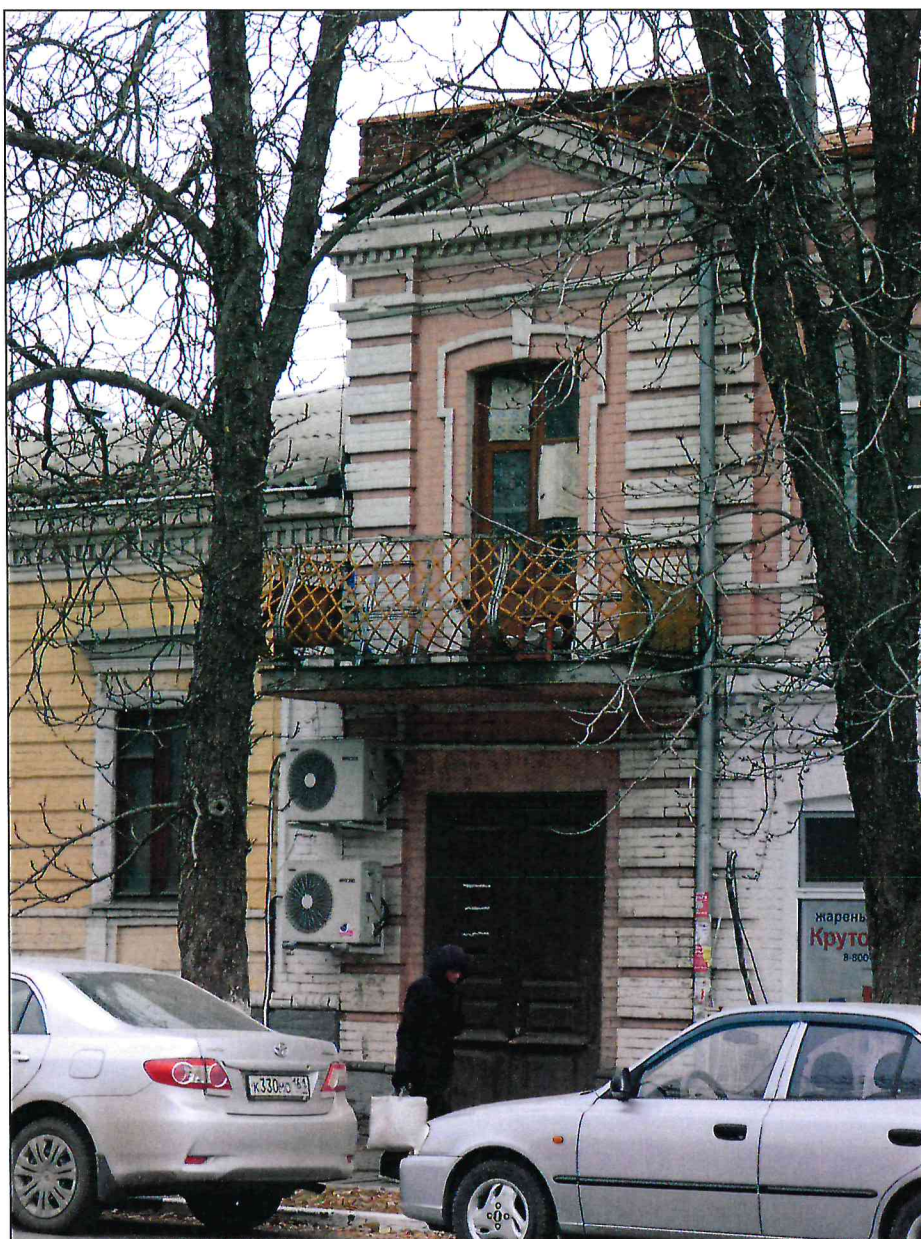
4. Фрагмент западного парадного фасада. Крайняя северная раскреповка. Ажурное ограждение балкона.