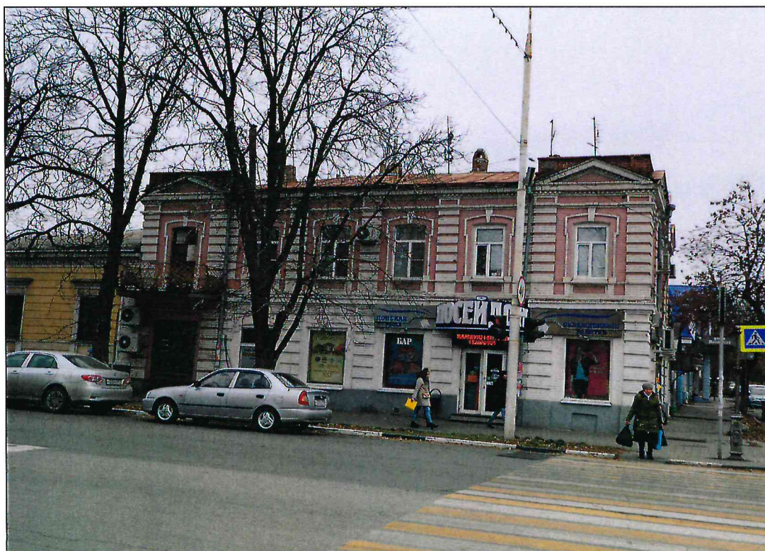
2. Западный парадный фасад Объекта.