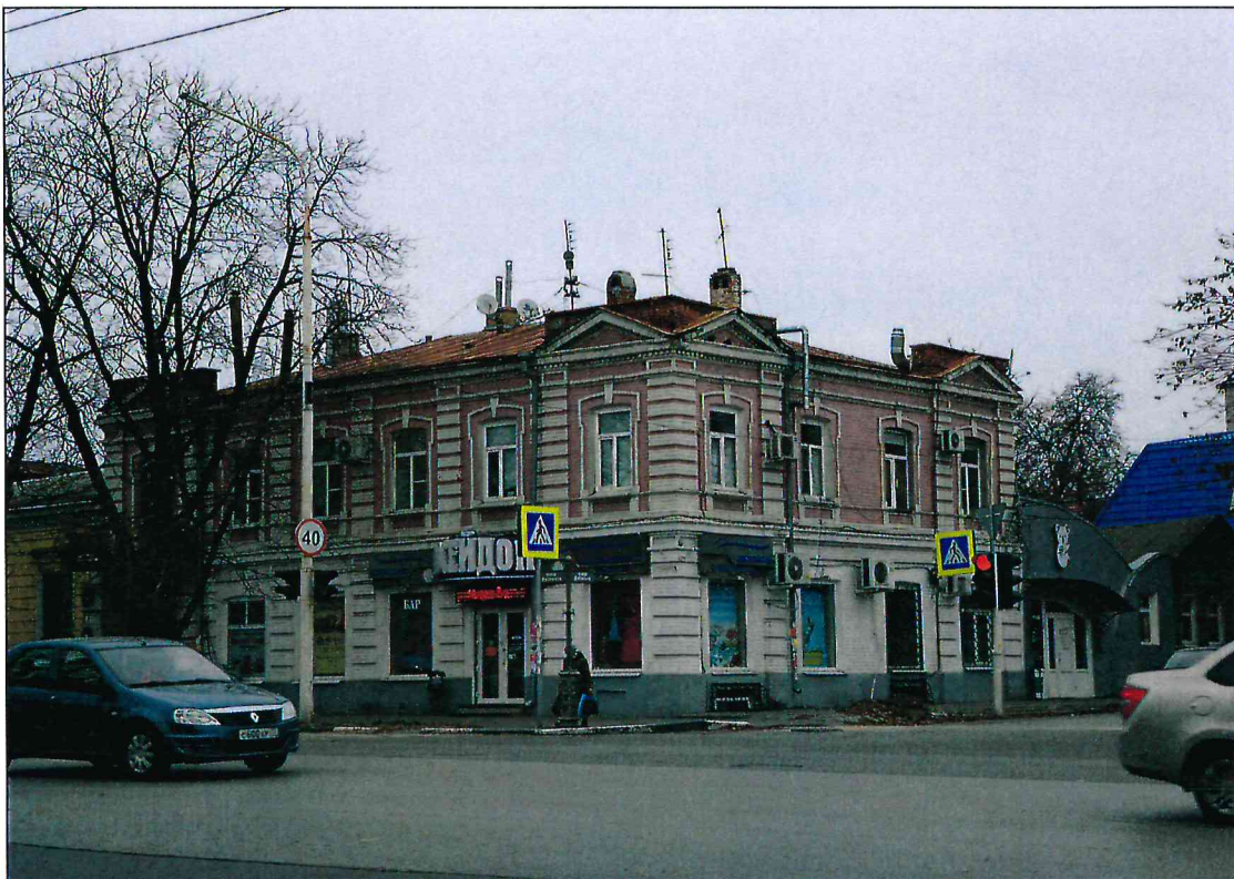
1. Вид Объекта с юго-запада.