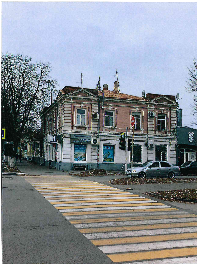
3. Южный парадный фасад Объекта.