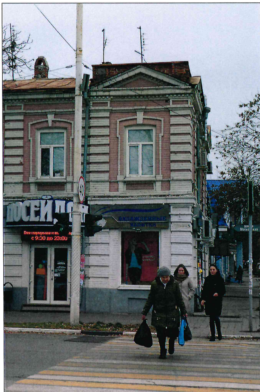
5. Фрагмент крайней южной раскреповки западного парадного фасада.