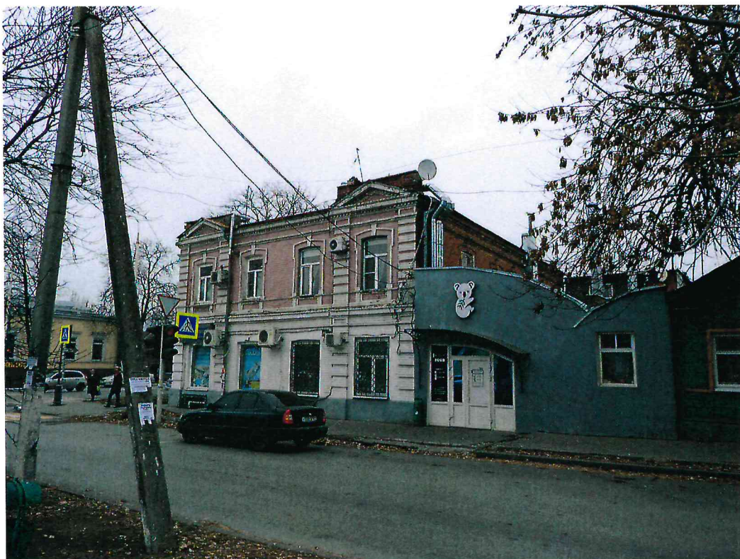
6. Фрагмент главного юго-восточного фасада. Западная раскреповка.