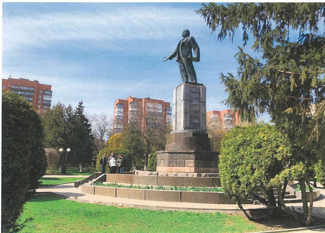
5. «Памятник В.И. Ленину». Вид памятника с юга.