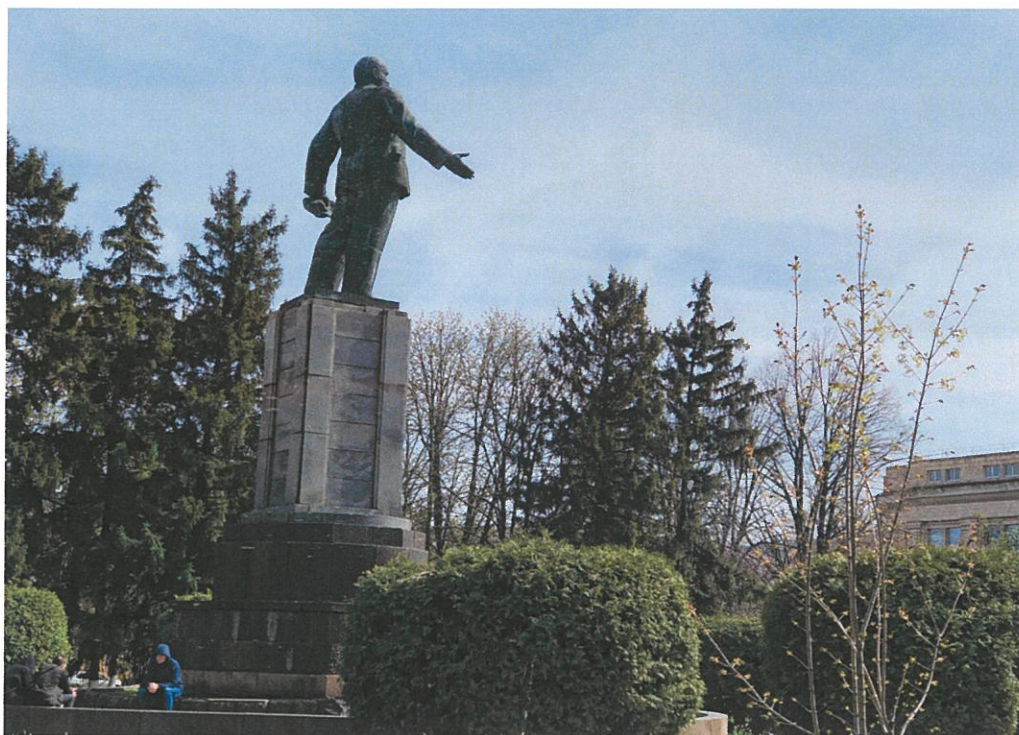
7. «Памятник В.И. Ленину». Вид памятника с северо-запада.