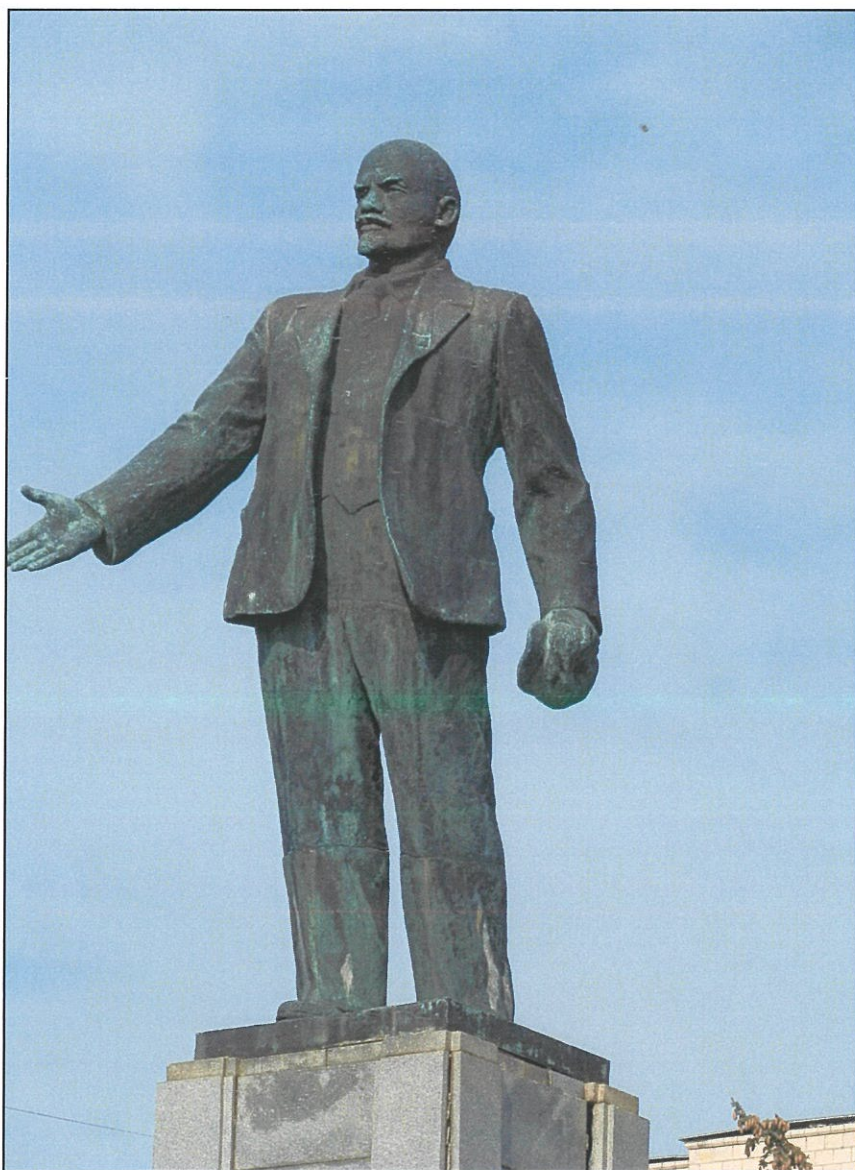
9. «Памятник В.И. Ленину». Фрагмент памятника. Вид с юга.