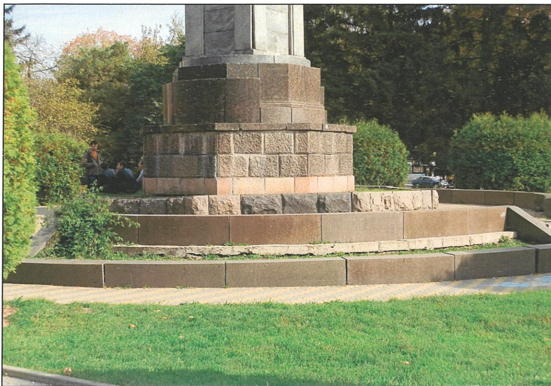
11. «Памятник В.И. Ленину». Фрагмент памятника. Основание.