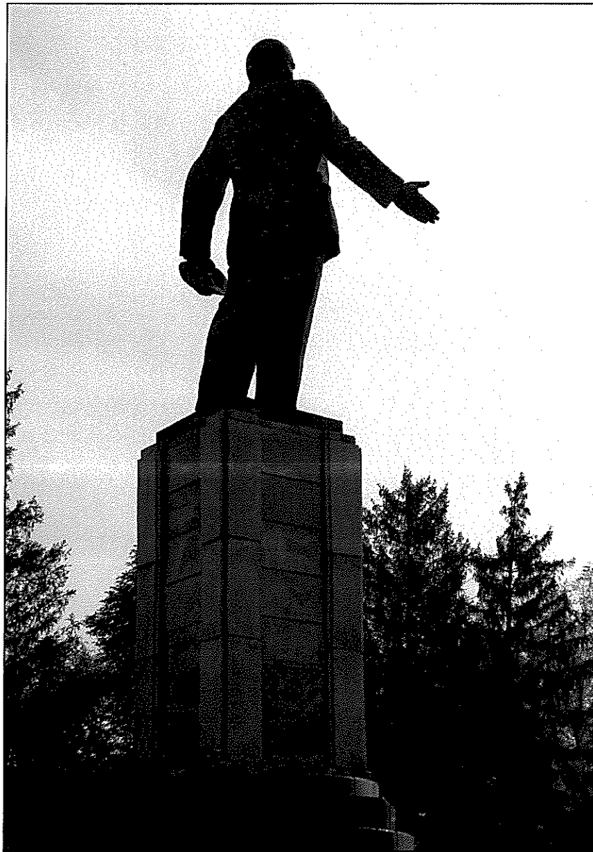
10. «Памятник В.И. Ленину». Фрагмент памятника. Вид с север-запада.