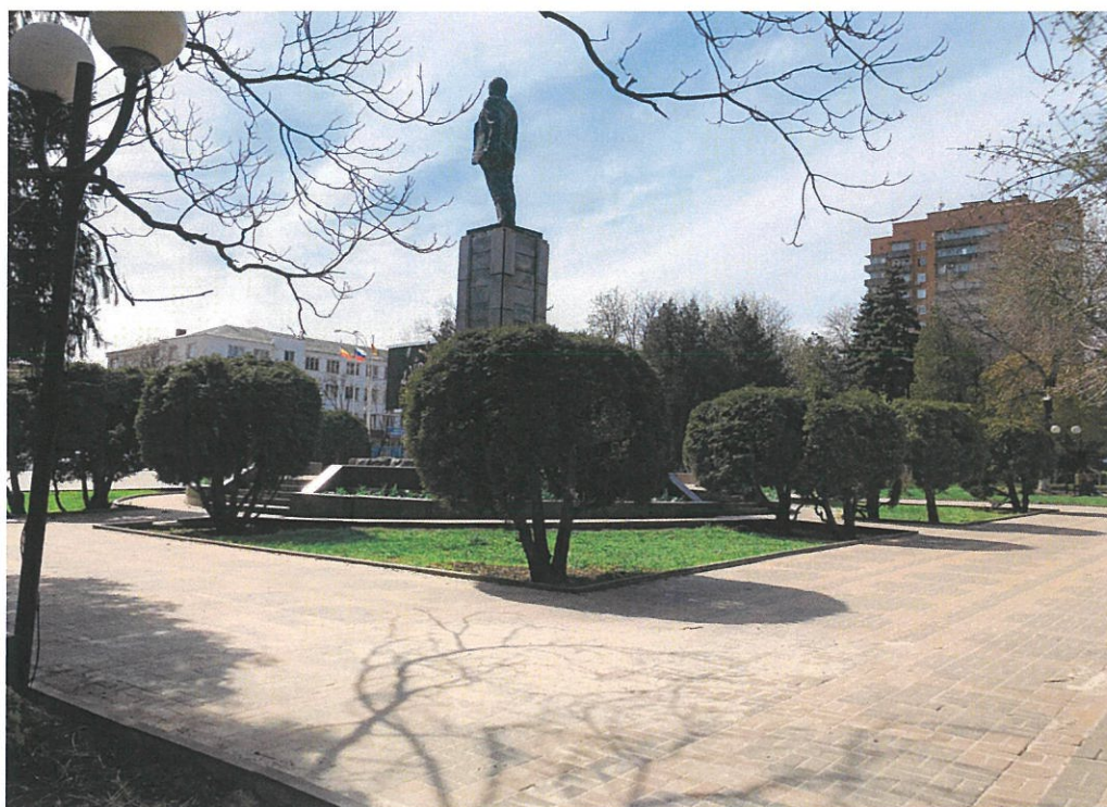
8. «Памятник В.И. Ленину». Вид памятника с востока.