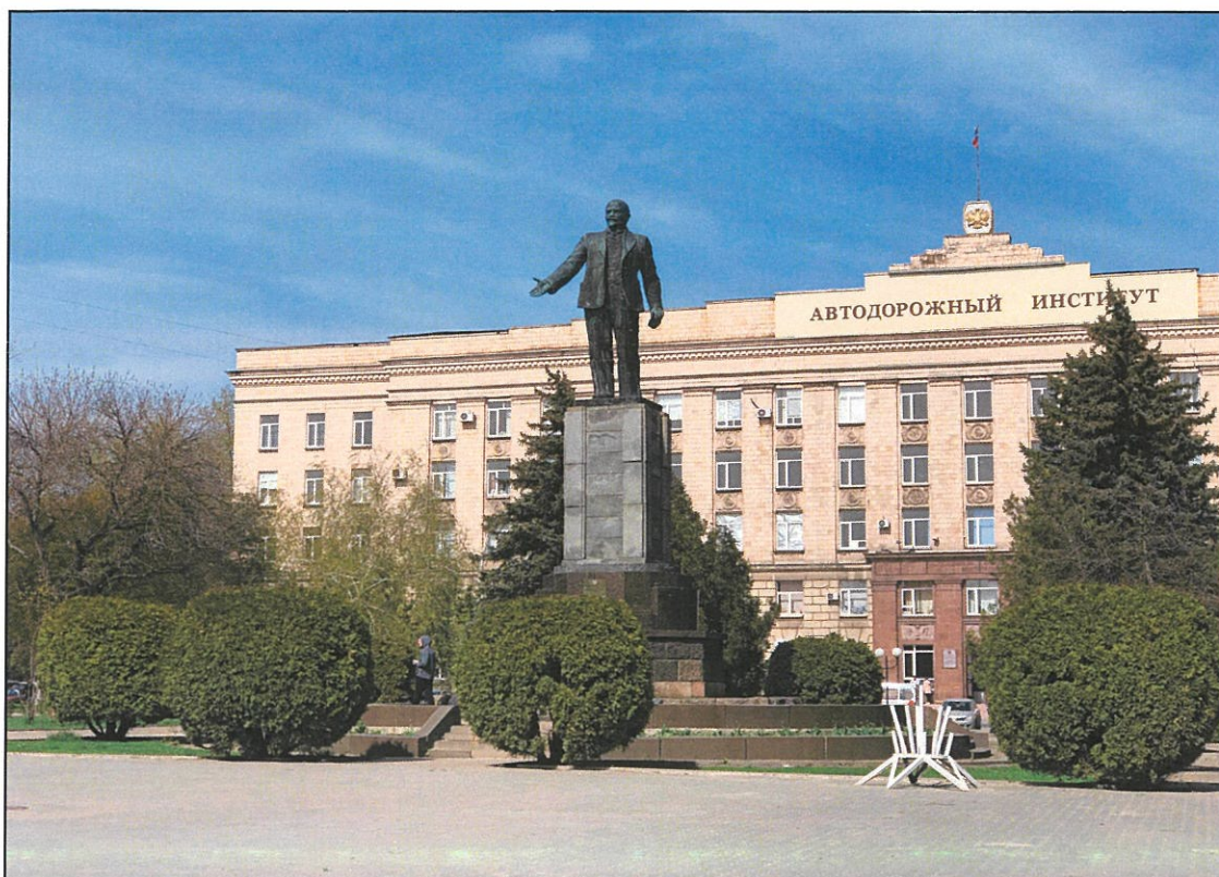
3. «Памятник В.И. Ленину». Общий вид памятника с юго-запада