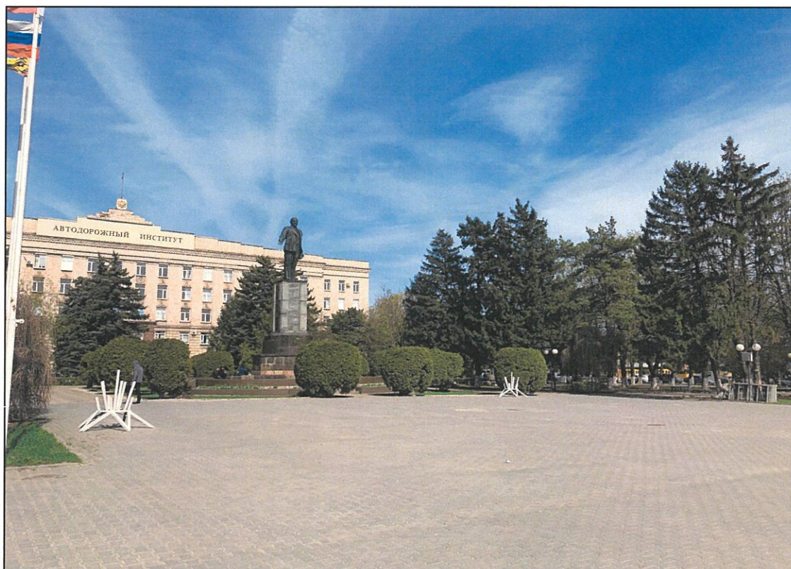
4. «Памятник В.И. Ленину». Общий вид памятника с юго-запада.