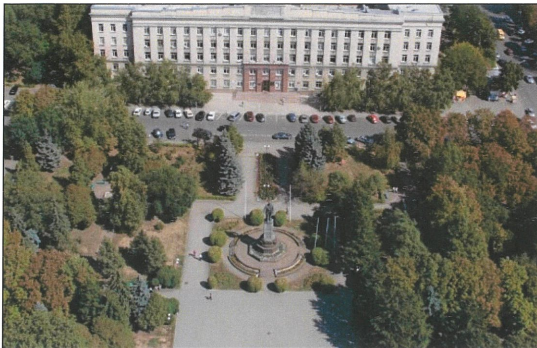
1. Вид памятника В.И. Ленину с юго-запада.