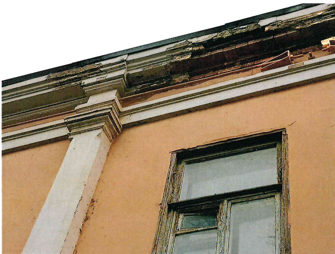
6. Фрагмент главного юго-западного фасада Объекта. Карниз.