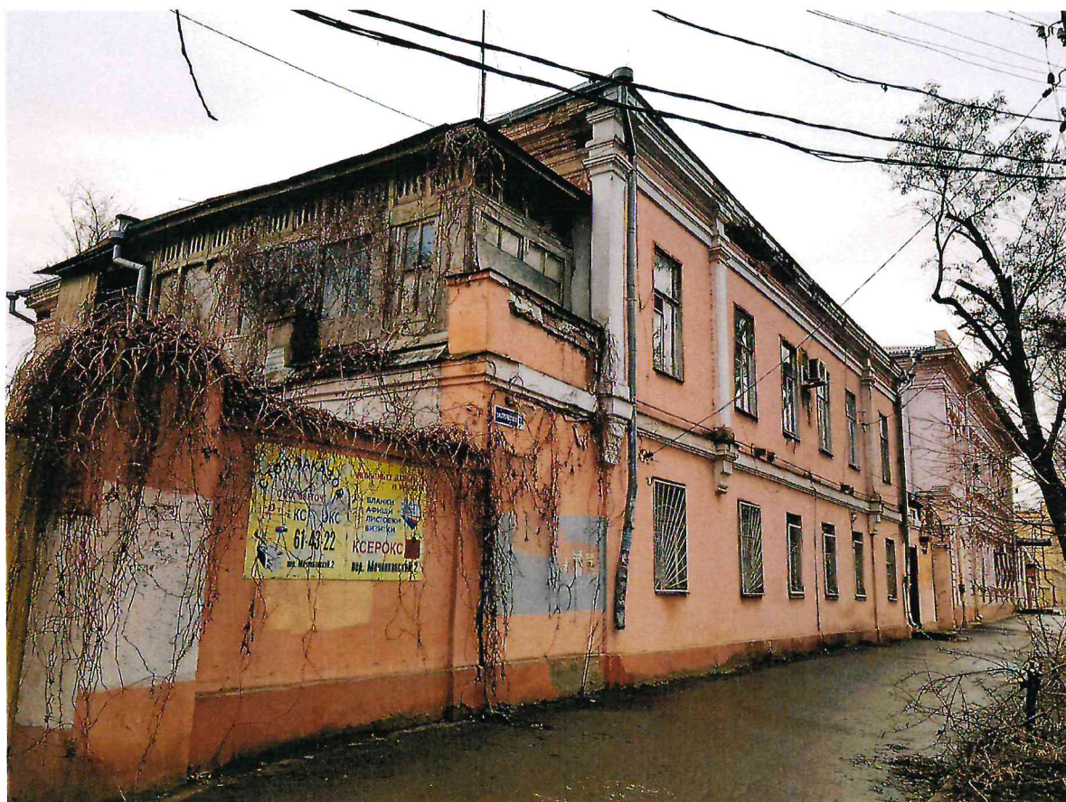
2. Общий вид Объекта с юго-запада.