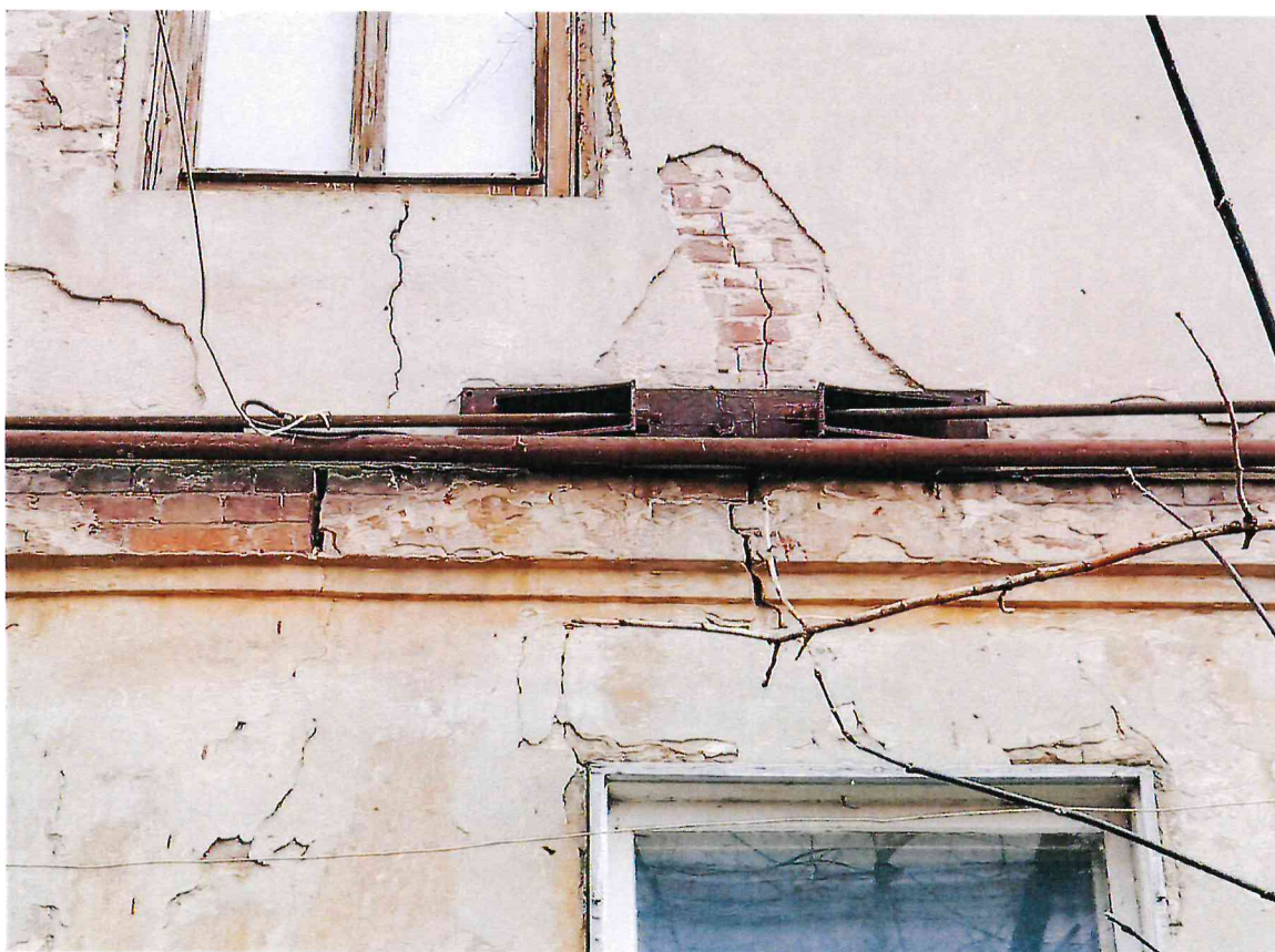
7. Фрагмент юго-восточного фасада Объекта. Стальные тяжи.