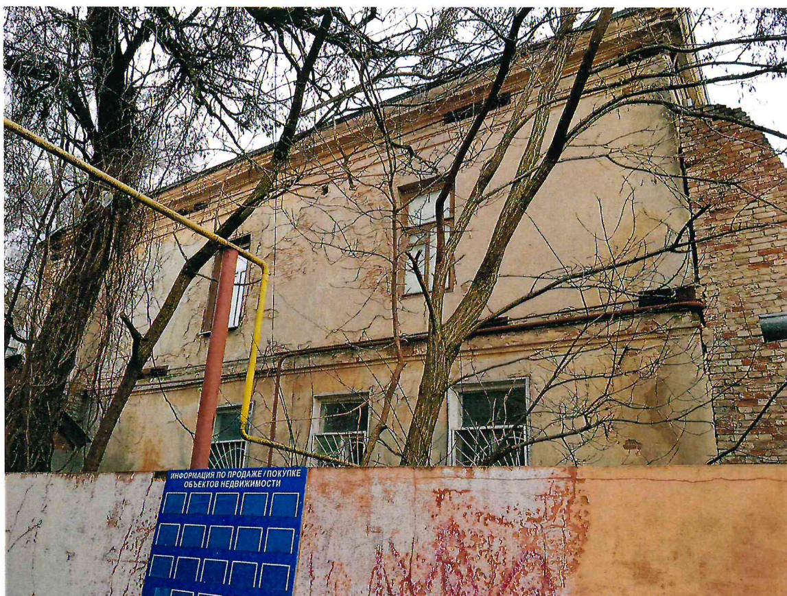
3. Юго-восточный фасад Объекта.