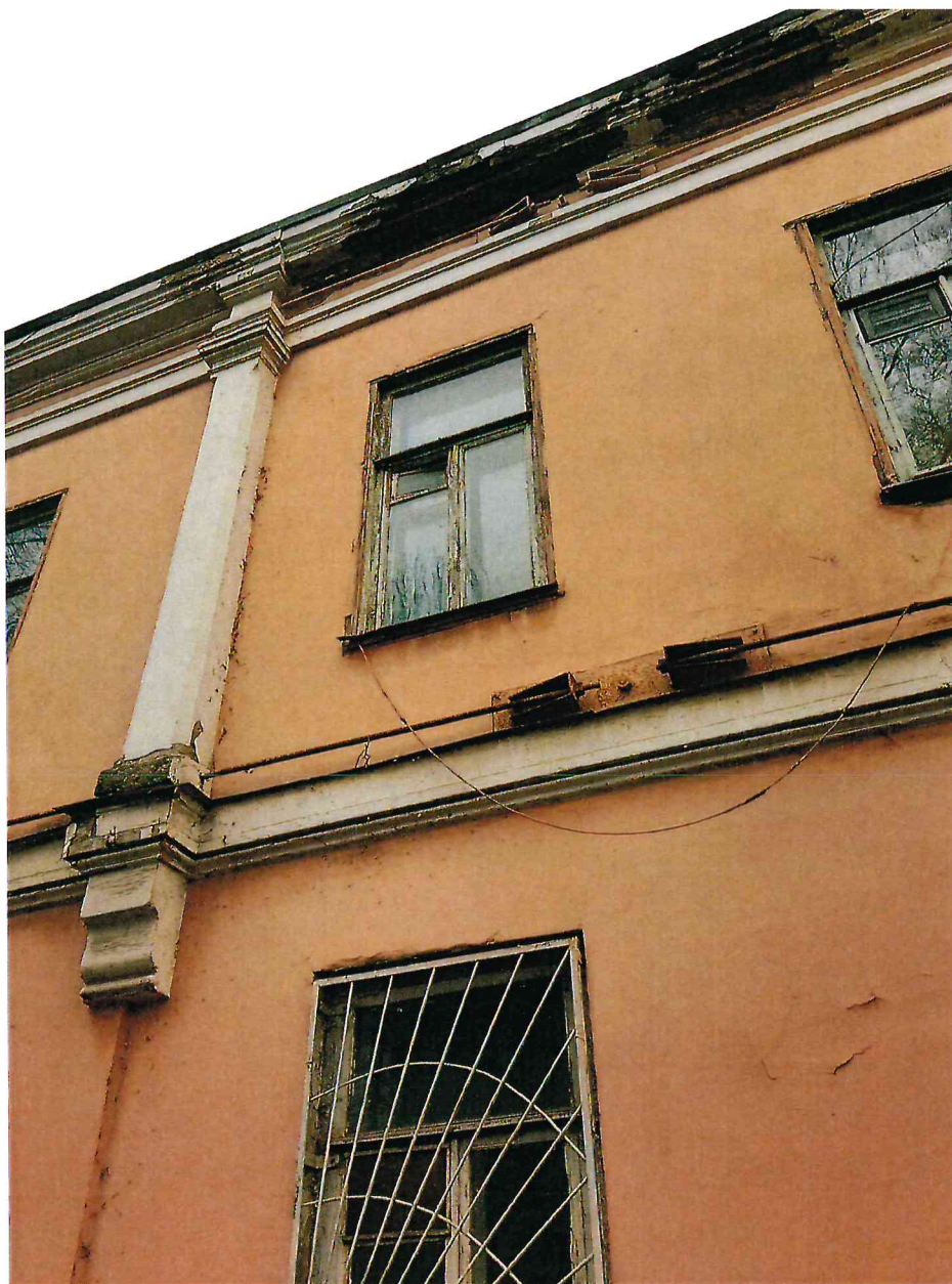
5. Фрагмент юго-западного фасада Объекта.