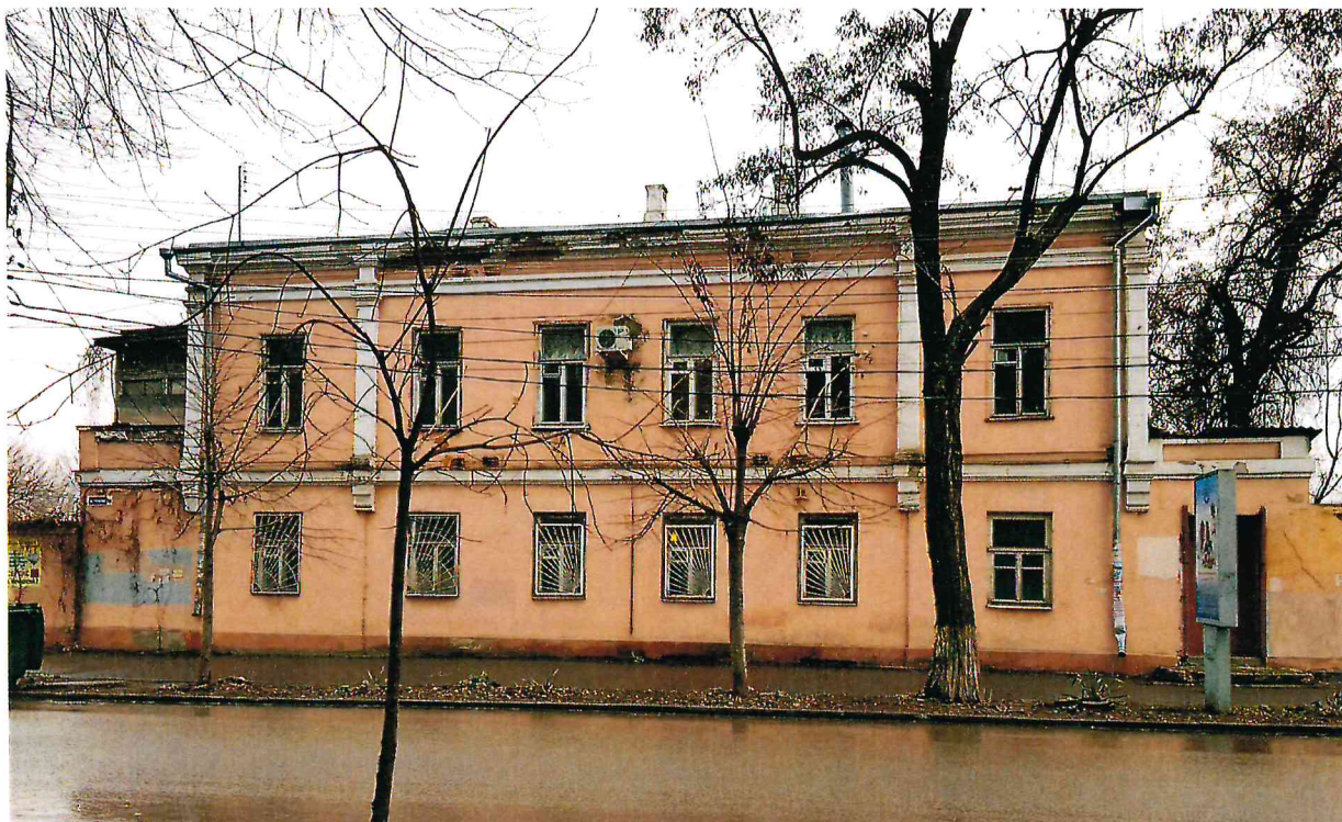
1. Общий вид юго-западного фасада Объекта.