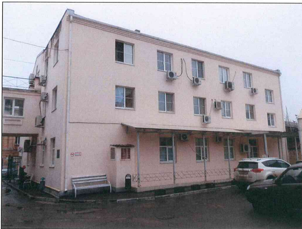
7. «Жилой дом С.А. Пинагель, нач. XX в.». Вид здания с северо-запада. Дворовые фасады.