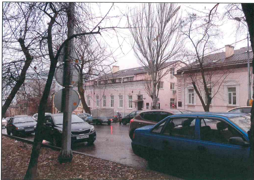
1. «Жилой дом С.А. Пинагель, нач. XX в.». Общий вид здания с северо-восточной стороны.