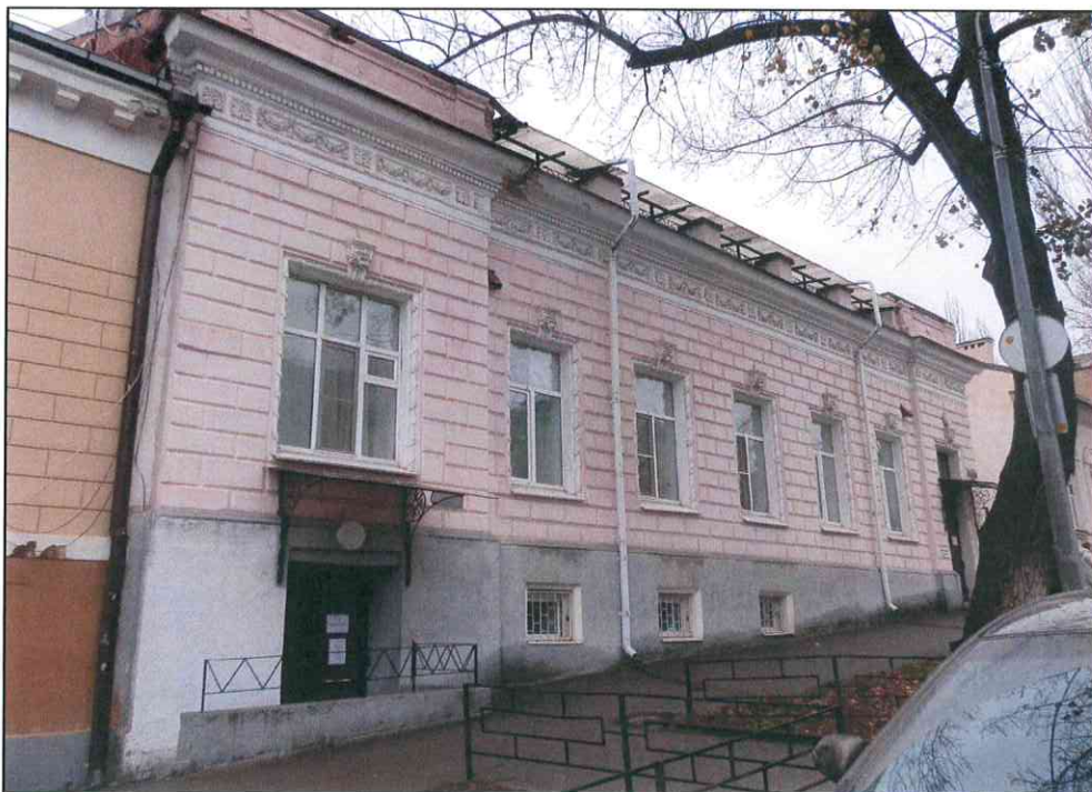
3. «Жилой дом С.А. Пинагель, нач. XX в.». Вид здания с юго-восточной стороны.