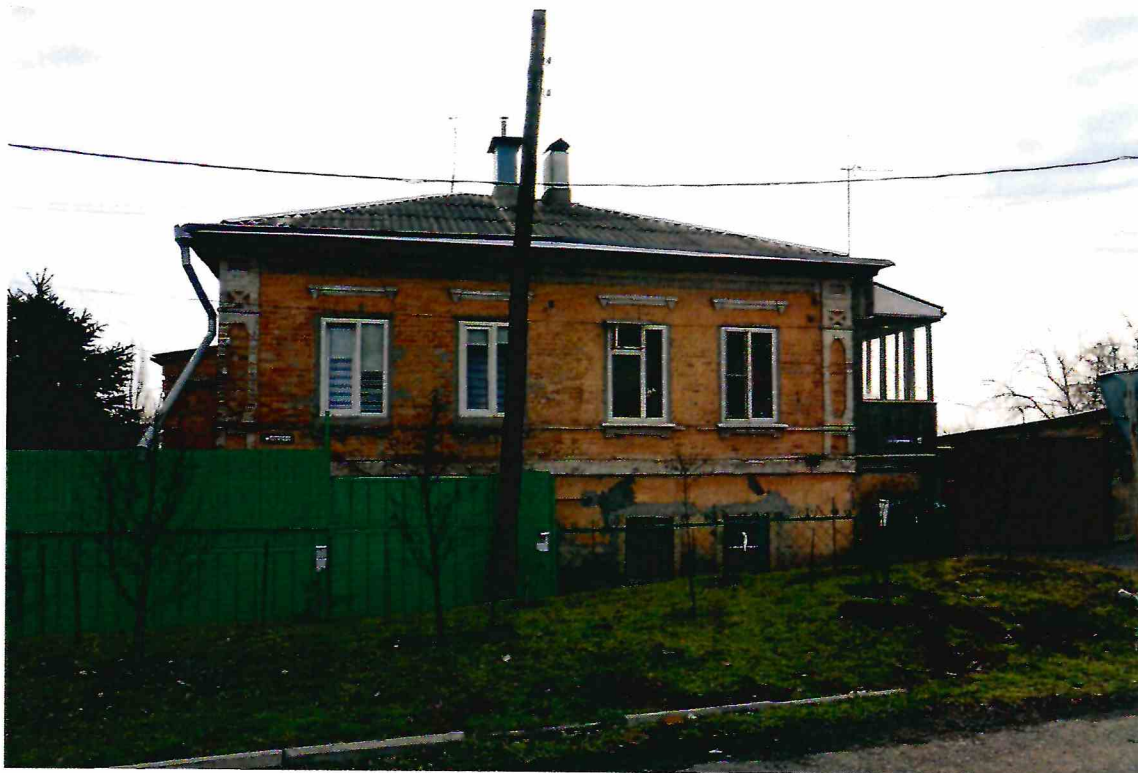
5. Главный северный фасад Объекта. Вид с северо-северо-востока.