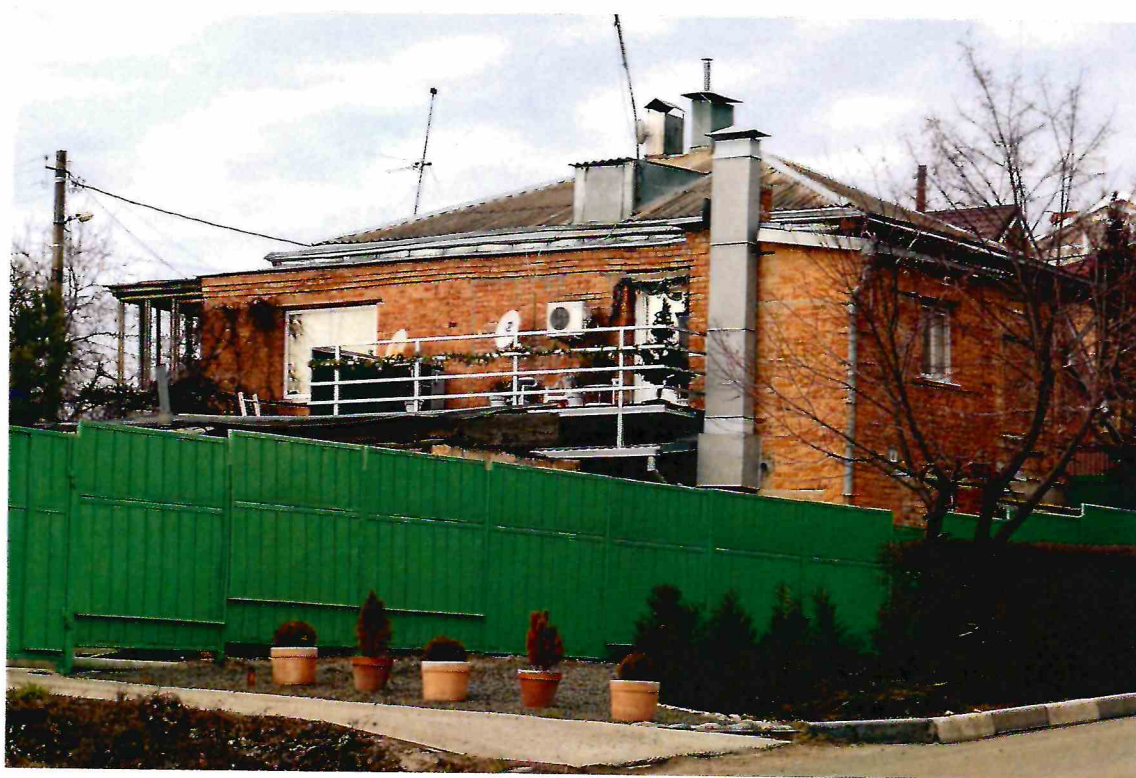
4. Южный фасад пристройки к Объекту. Вид с юго-юго-востока.