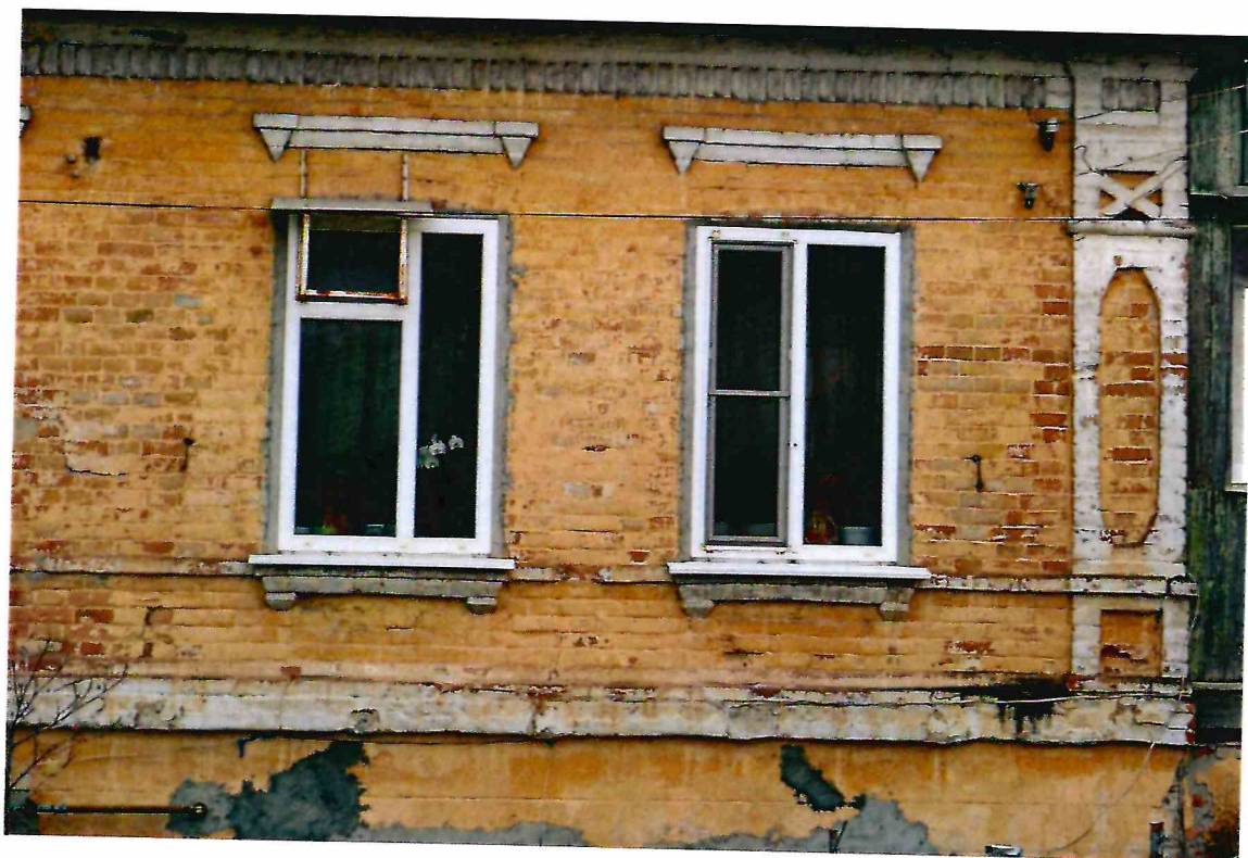
9. Фрагмент северного фасада Объекта.