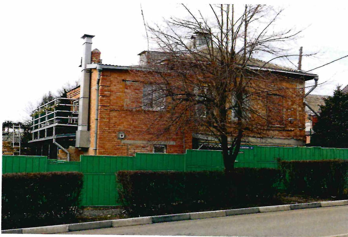
3. Главный восточный фасад Объекта. Вид с востока-юго-востока.