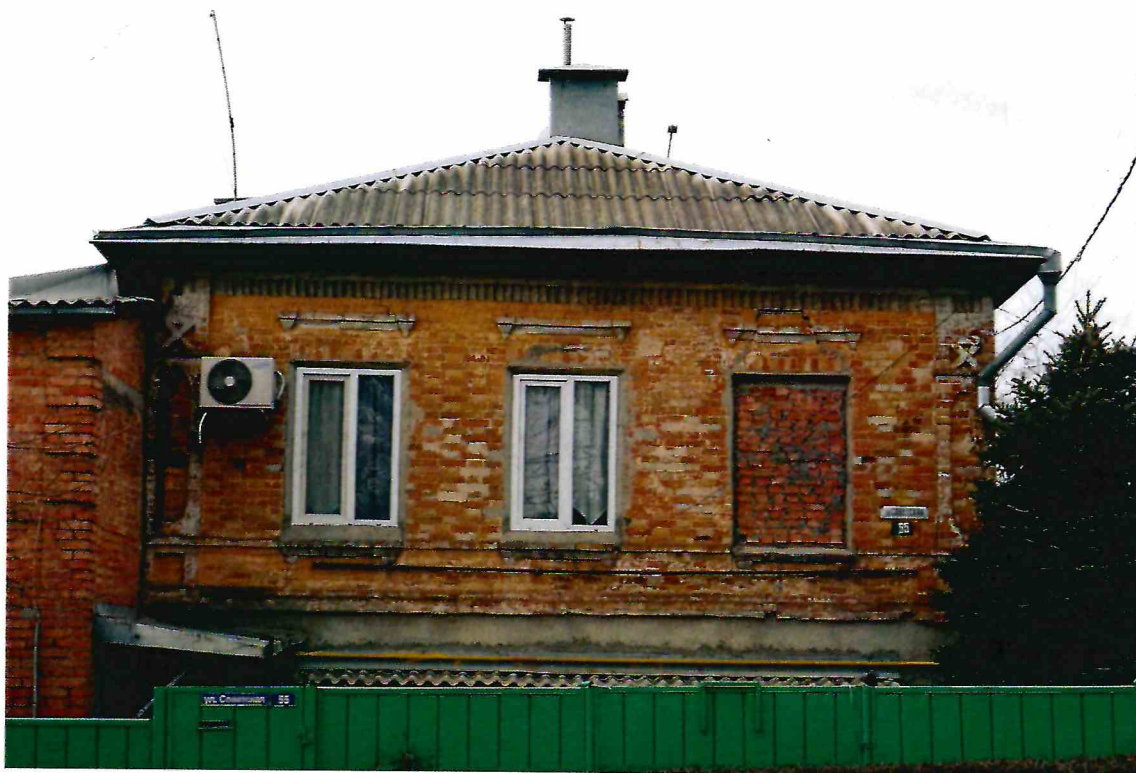
7. Первый этаж восточного фасада Объекта.