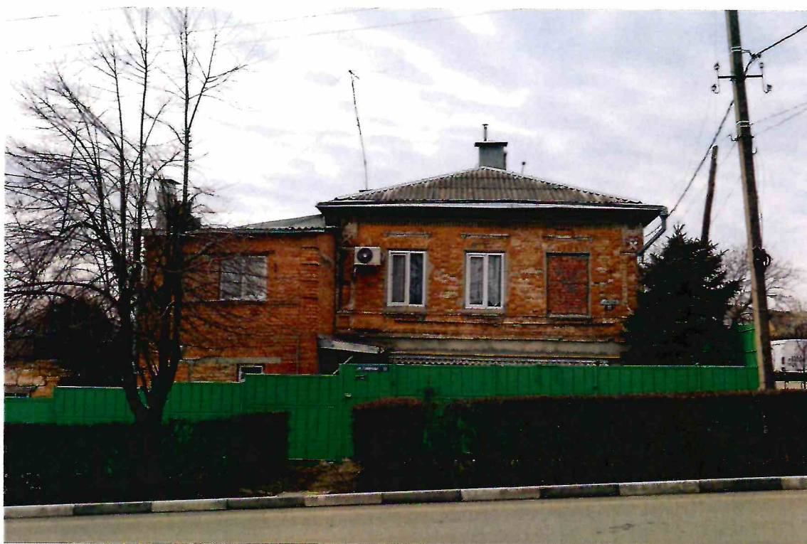
2. Главный восточный фасад Объекта. Вид с северо-востока.