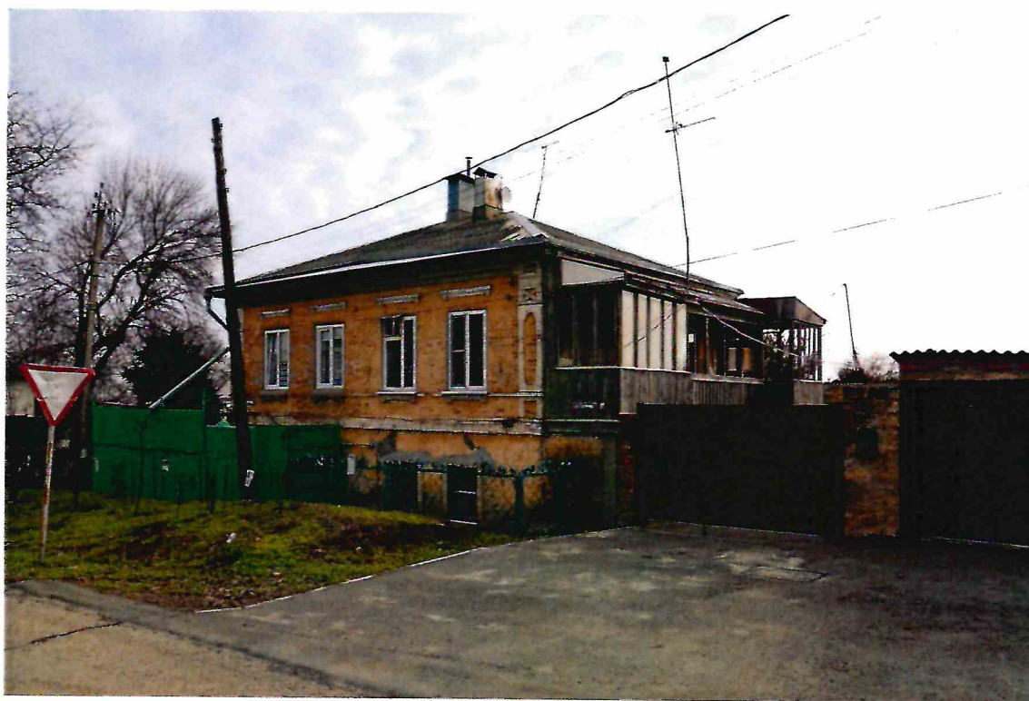
6. Главный северный фасад Объекта. Вид с северо-запада.