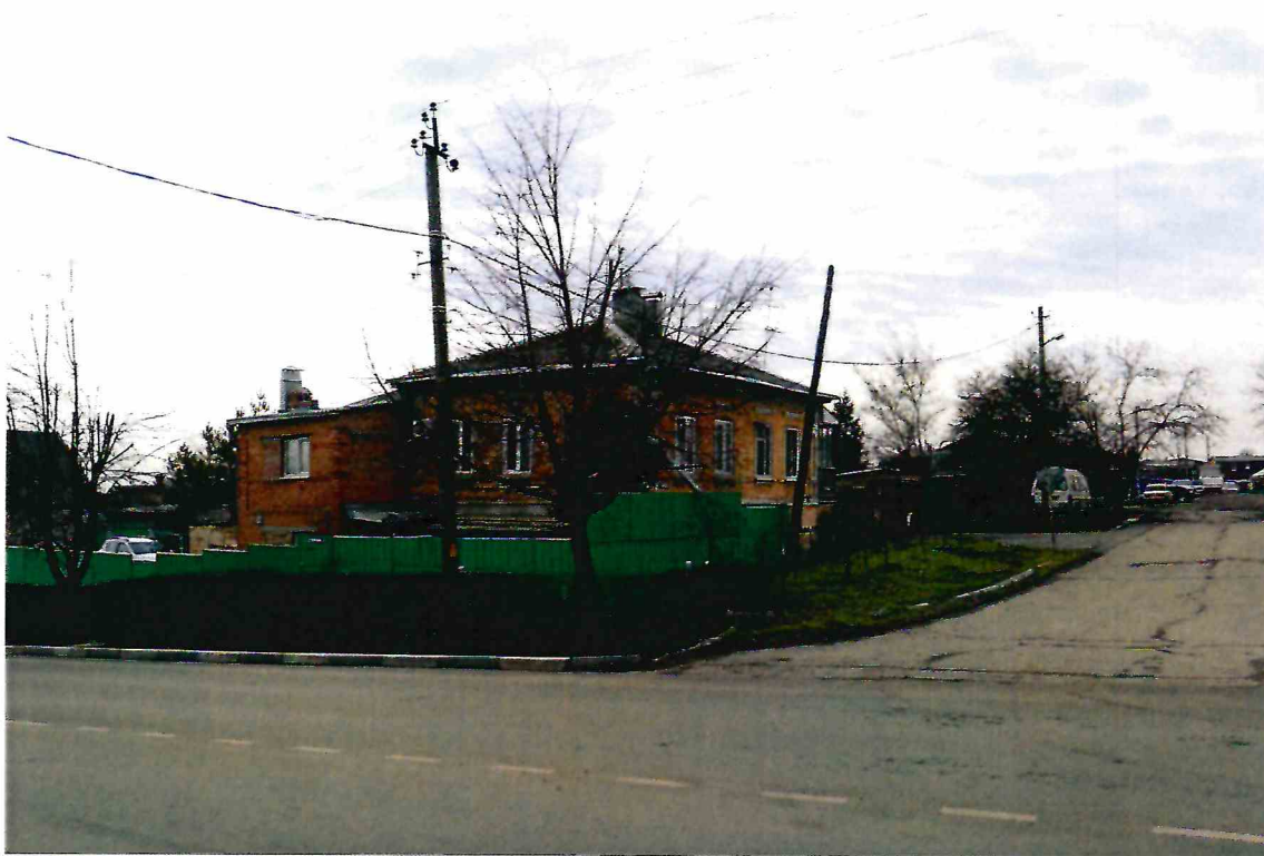
1. Вид Объекта в застройке квартала.