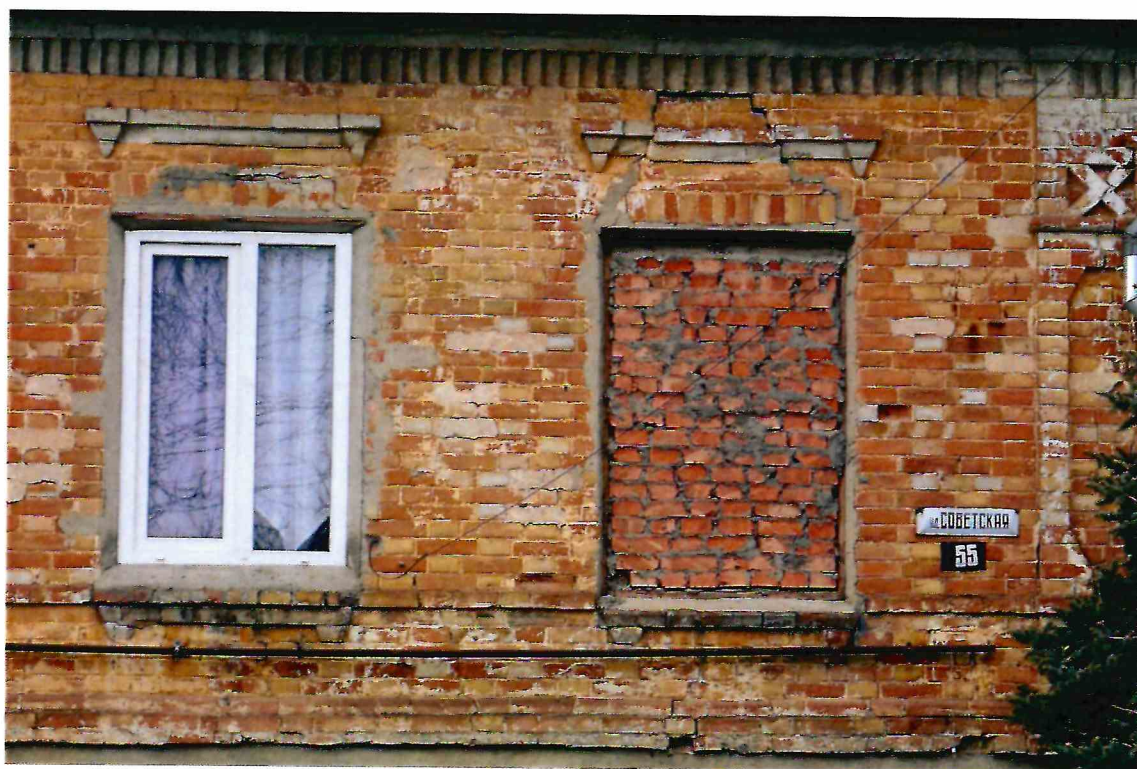
8. Фрагмент восточного фасада Объекта. Деструкция кирпичной кладки.