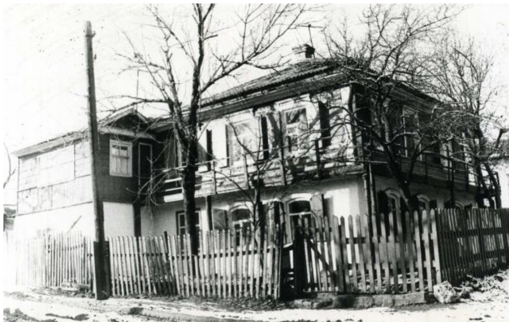
Вид на объект культурного наследия с юго-востока. Фото 1990 г.

Домовладение, на территории которого расположен объект культурного наследия, в 1940-х годах имело адрес: ул. Максима Горького, 16, в 1950-х годах – ул. Кривошлыкова, 19. К 1960 году домовладение получило адрес: ул. Кривошлыкова, 33/39, ул. Максима Горького. Нынешний адрес был присвоен домовладению во второй половине 1970-х годов.