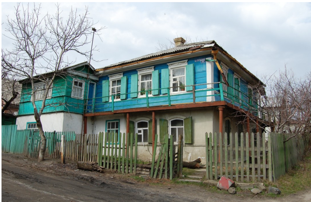
Вид на объект культурного наследия с юго-востока. Фото 2015 г.

В настоящее время домовладение по-прежнему находится в частной собственности. Сведений об адресе и собственниках домовладения до 1950-х годов в исторических источниках не обнаружено.