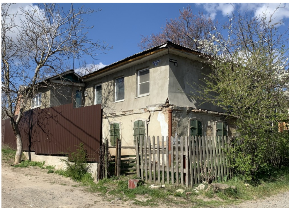
Вид на объект культурного наследия с юго-востока. Фото 2020 г.

Стены подклета выполнены из блоков пиленого камня-ракушечника, оштукатурены. «Верхи» выполнены из деревянного бруса прямоугольного сечения. Внутренняя и наружная плоскость стен обшита сосновой доской-шалевкой. Северный фасад и северная часть восточного остались шалеванными и окрашены масляной краской. Стены южного фасада, западный и часть восточного фасада оштукатурены.