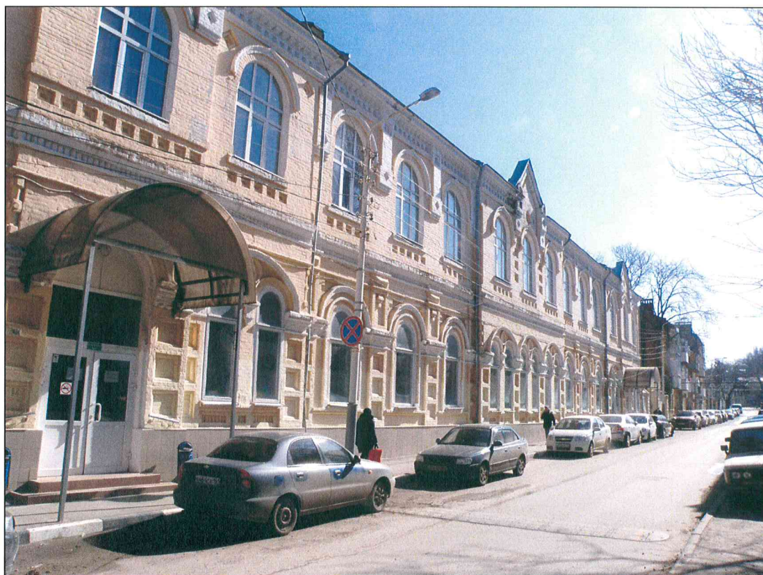
2. «Здание начальных училищ, построенное на средства М.П. и Е.Л. Шаховых, 1897 г., арх. Н.А. Дорошенко». Вид здания с северо-запада.