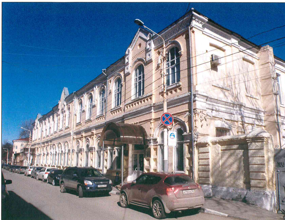
1. «Здание начальных училищ, построенное на средства М.П. и Е.Л. Шаховых, 1897 г., арх. Н.А. Дорошенко». Вид здания с южной стороны.