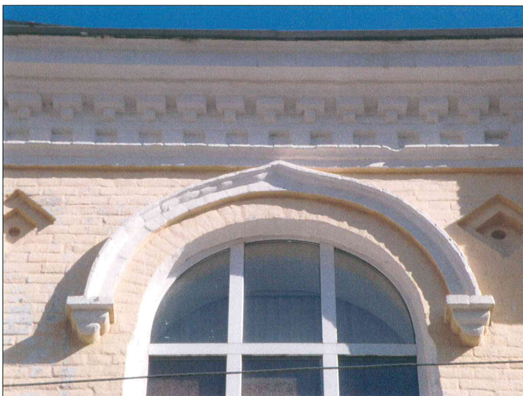
6. «Здание начальных училищ, построенное на средства М.П. и Е.Л. Шаховых, 1897 г., арх. Н.А. Дорошенко». Килевидный сандрик в оформлении арочного окна 2-го этажа.