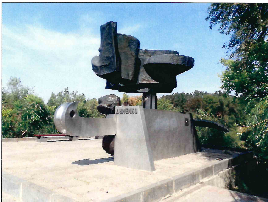
3. «Памятник Б.М. Думенко». Вид с юго-восточной стороны.