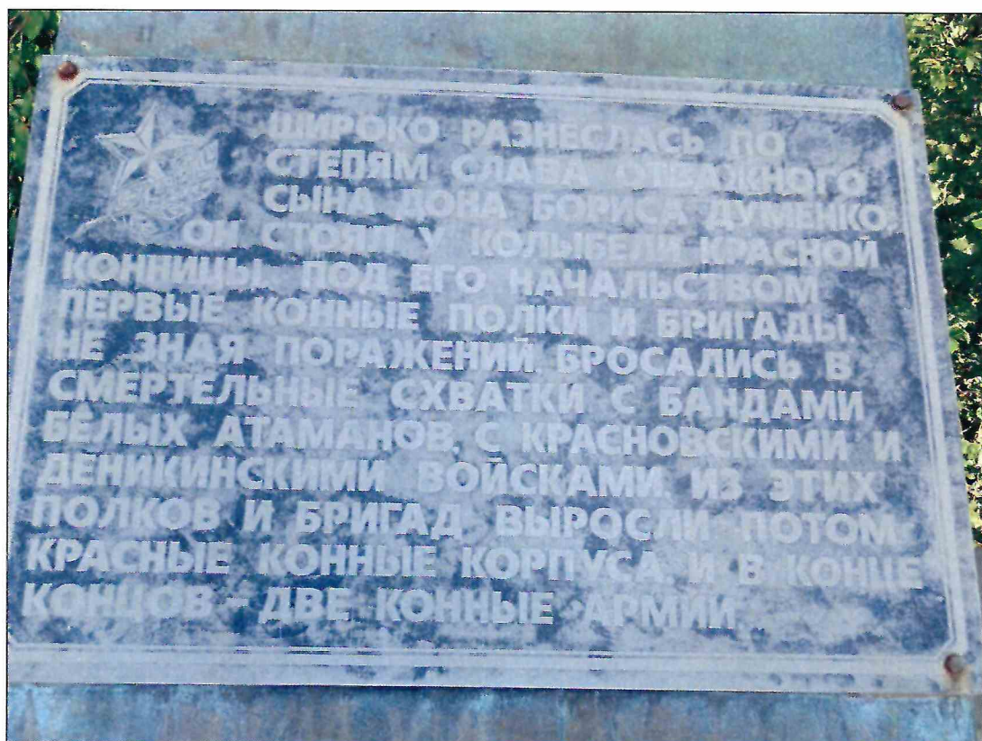
4. «Памятник Б.М. Думенко». Мемориальная плита, установленная на пилоне, расположенном в восточной части смотровой площадки.