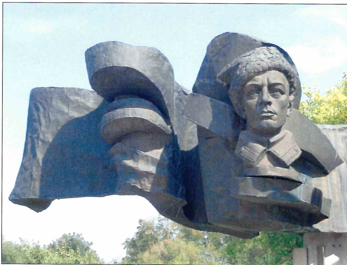
7. «Памятник Б.М. Думенко». Фрагмент скульптурной композиции. Вид с запада.