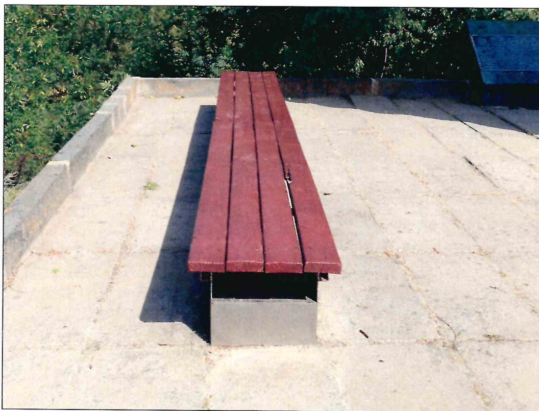
2. «Памятник Б.М. Думенко». Благоустройство смотровой площадки.