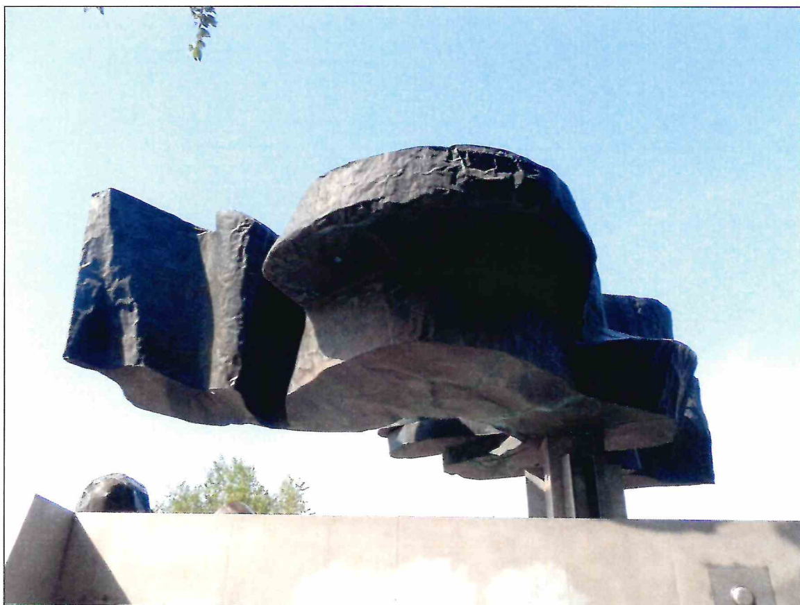
8. «Памятник Б.М. Думенко». Фрагмент скульптурной композиции. Вид с востока.