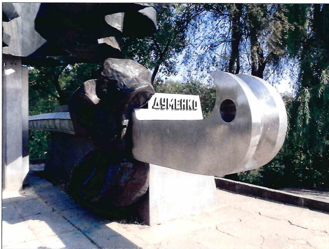
9. «Памятник Б.М. Думенко». Фрагмент скульптурной композиции. Вид с запада.