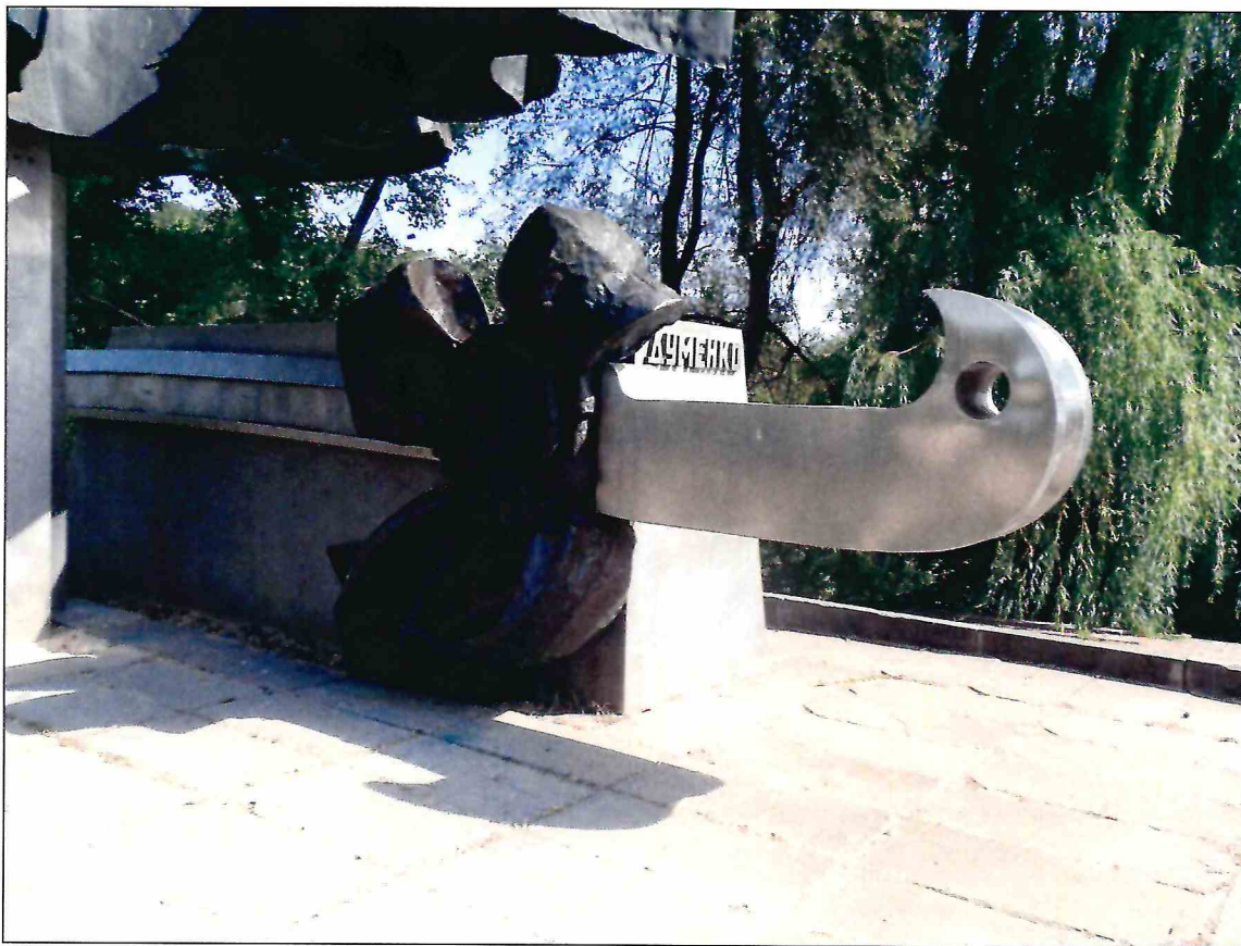
6. «Памятник Б.М. Думенко». Фрагмент скульптурной композиции.