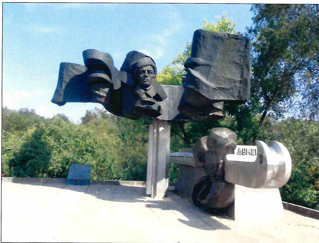
1. «Памятник Б.М. Думенко». Вид с западной стороны.