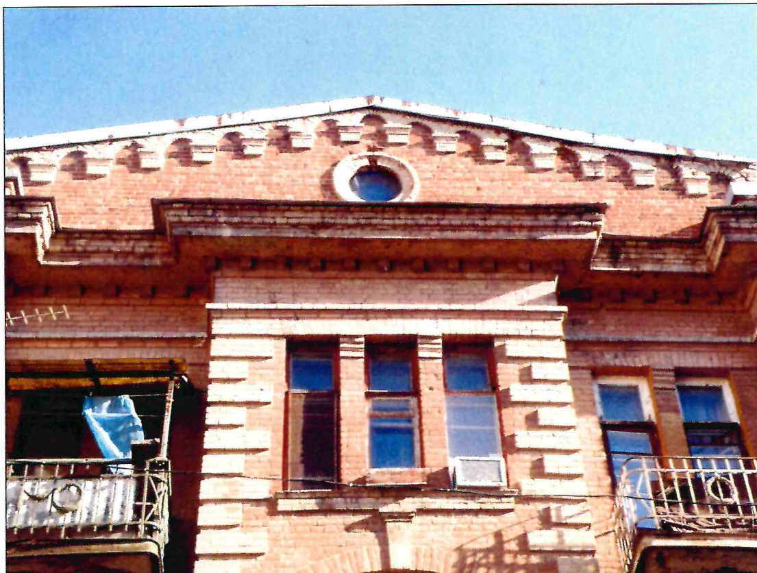
5. «Доходный дом М.Ф. Кофус». Фронтон северного фасада.