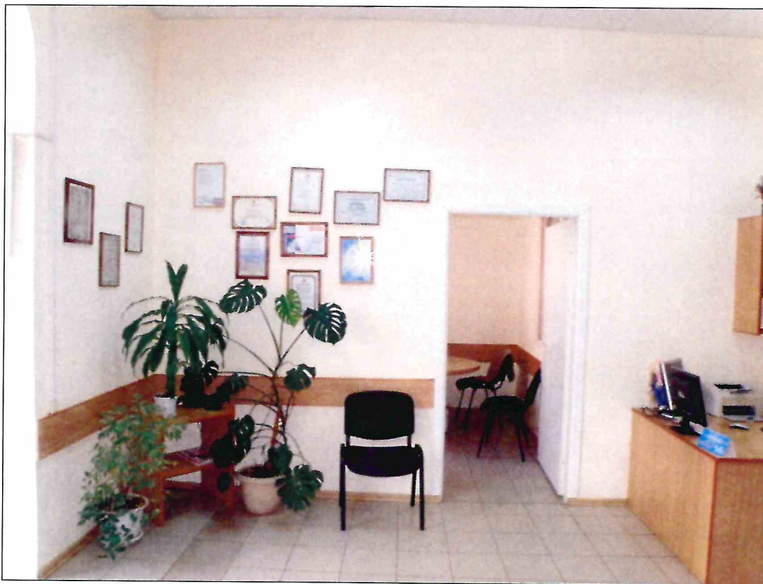
21. «Доходный дом М.Ф. Кофус». Помещение 1-го этажа.