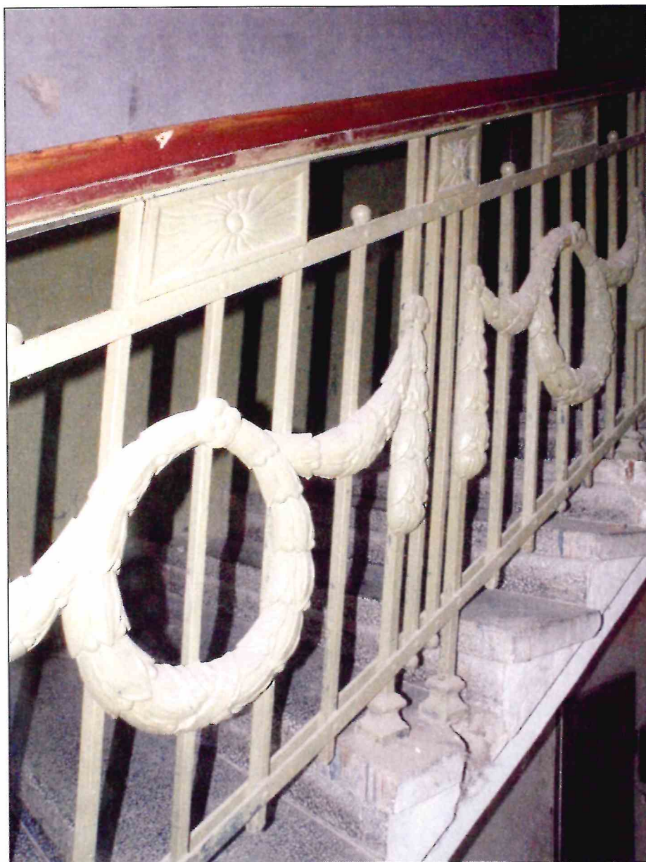
18. «Доходный дом М.Ф. Кофус». Ограждение парадной лестницы.