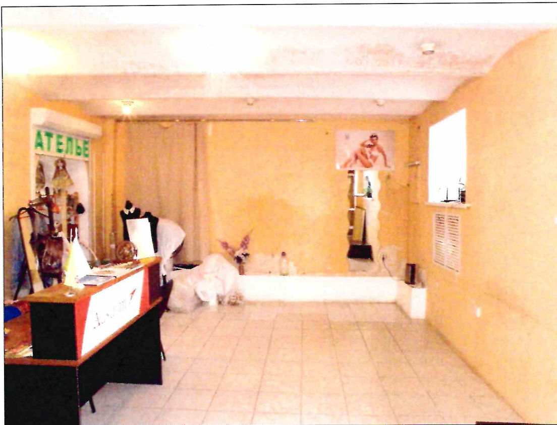
19. «Доходный дом М.Ф. Кофус». Помещение подвала.