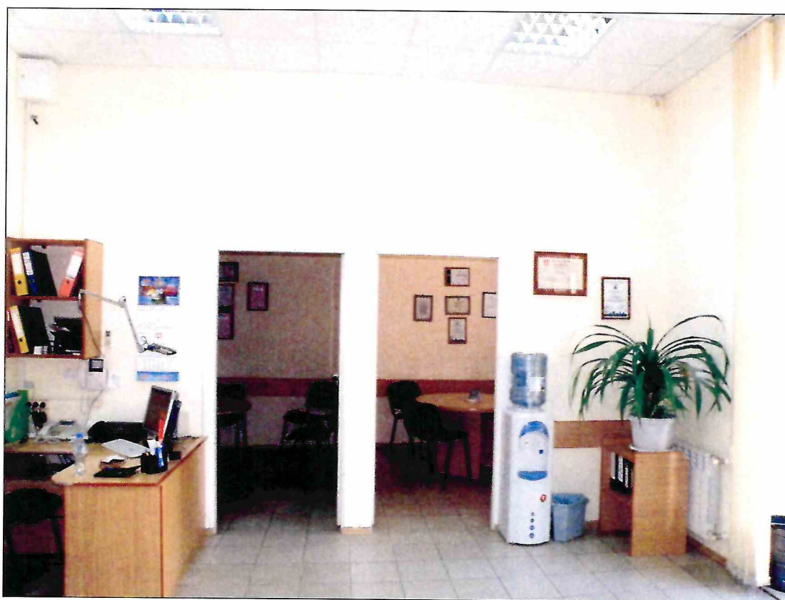
22. «Доходный дом М.Ф. Кофус». Помещение 1-го этажа.