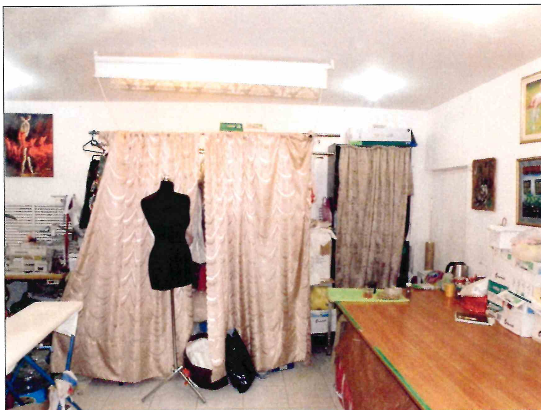
20. «Доходный дом М.Ф. Кофус». Помещение подвала.