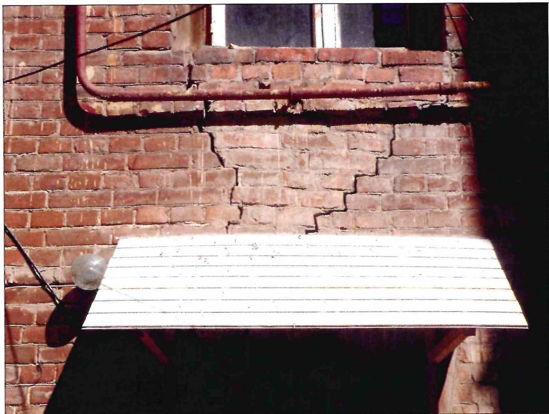
14. «Доходный дом М.Ф. Кофус». Глубокие трещины в стене южного фасада.