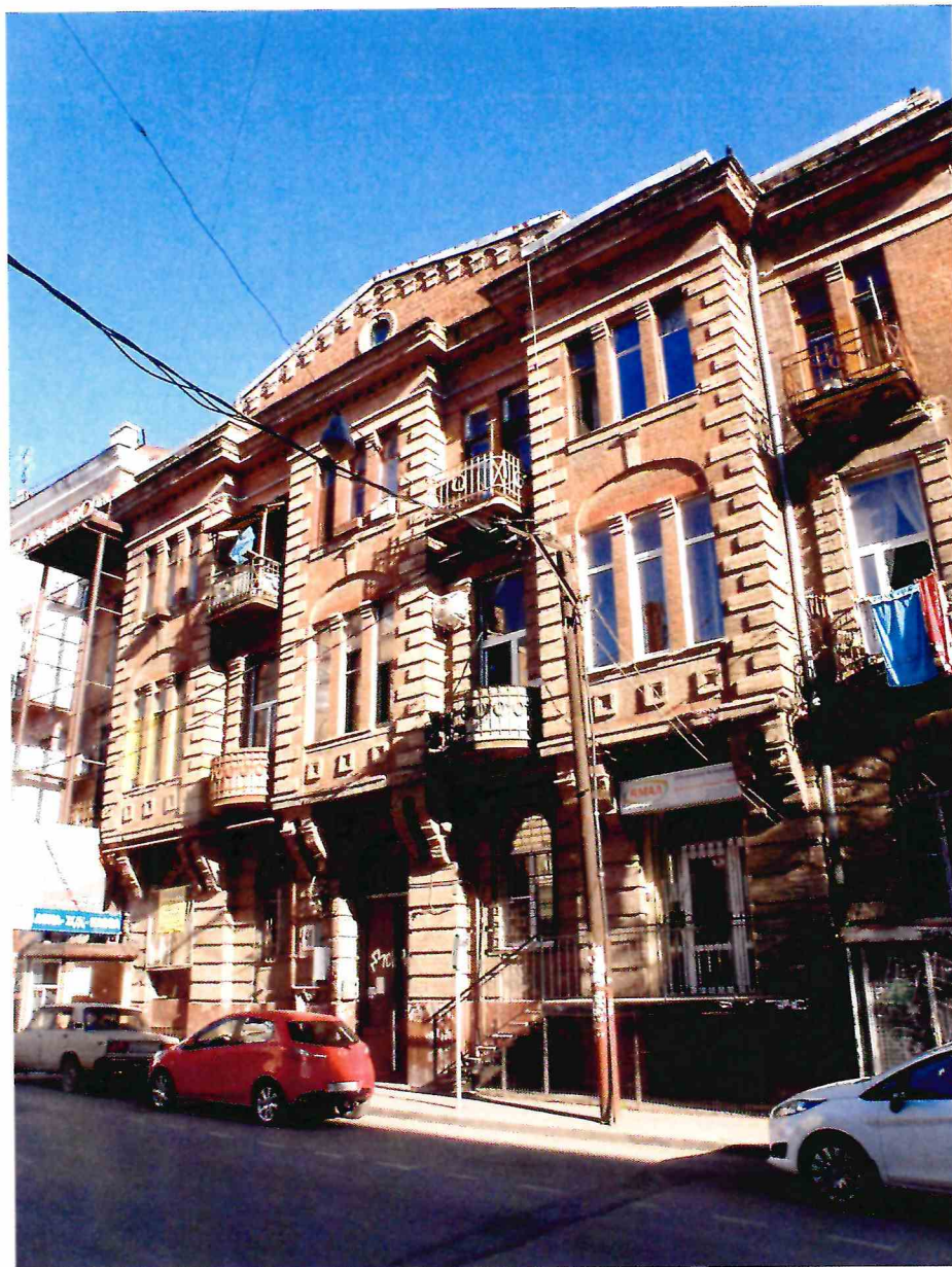
2. «Доходный дом М.Ф. Кофус». Вид здания с северо-запада.