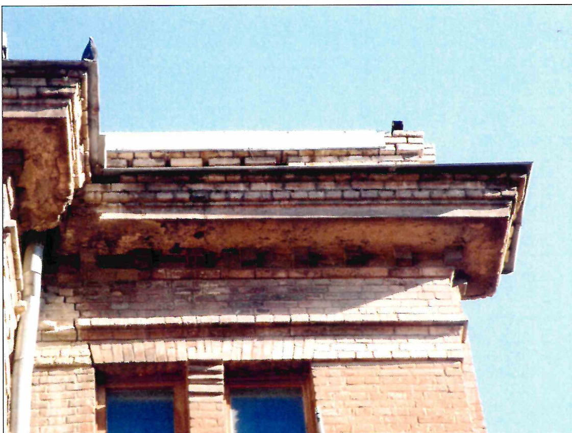
6. «Доходный дом М.Ф. Кофус». Венчающий карниз здания.