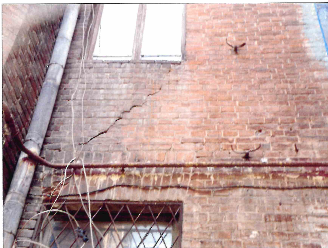
15. «Доходный дом М.Ф. Кофус». Глубокая диагональная трещина в стене южного фасада.