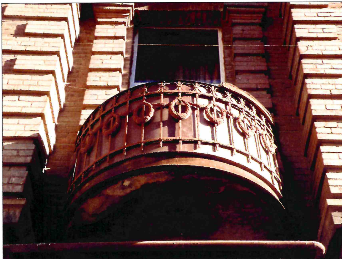
9. «Доходный дом М.Ф. Кофус». Фрагмент главного северного фасада. Дугообразный балкон 2-го этажа.