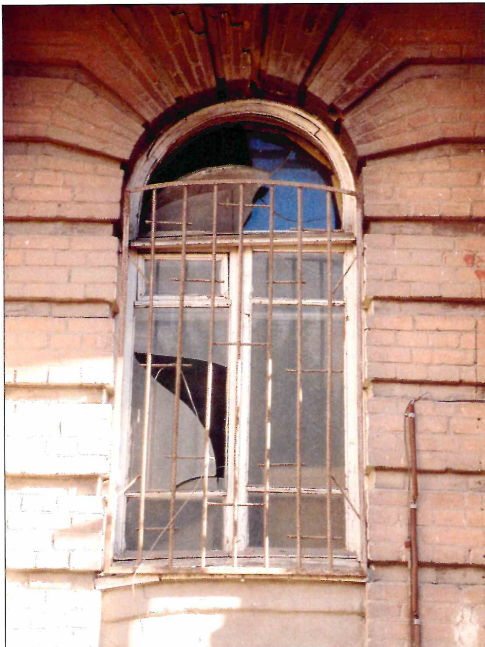
8. «Доходный дом М.Ф. Кофус». Фрагмент главного северного фасада. Арочное окно 1-го этажа.