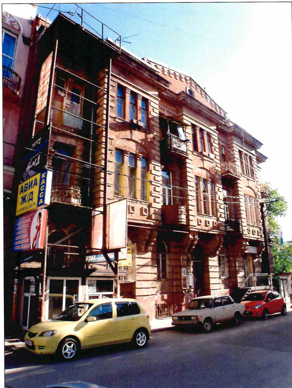
1. «Доходный дом М.Ф. Кофус». Вид здания с северо-востока.