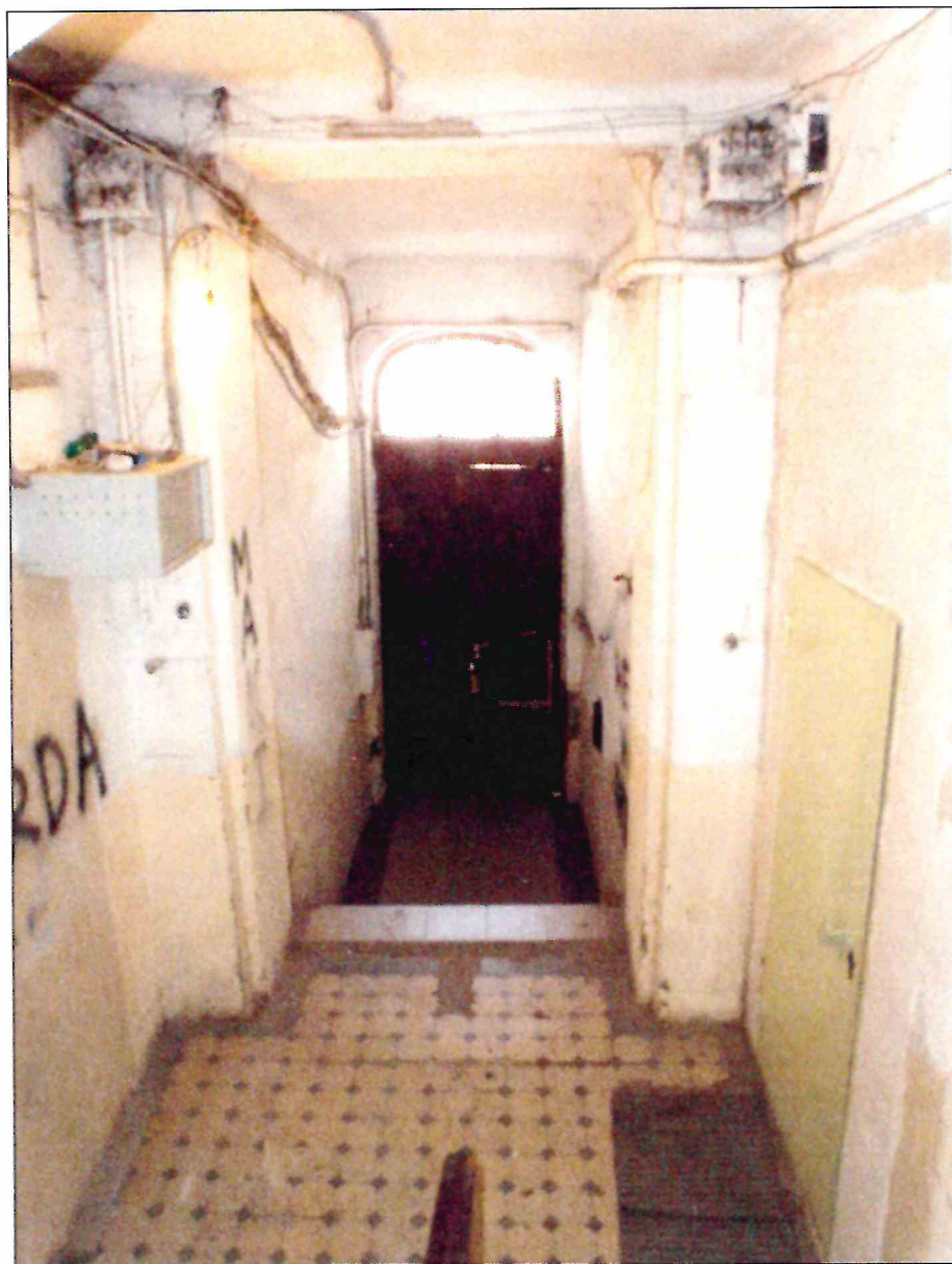
16. «Доходный дом М.Ф. Кофус». Вестибюль парадного входа.