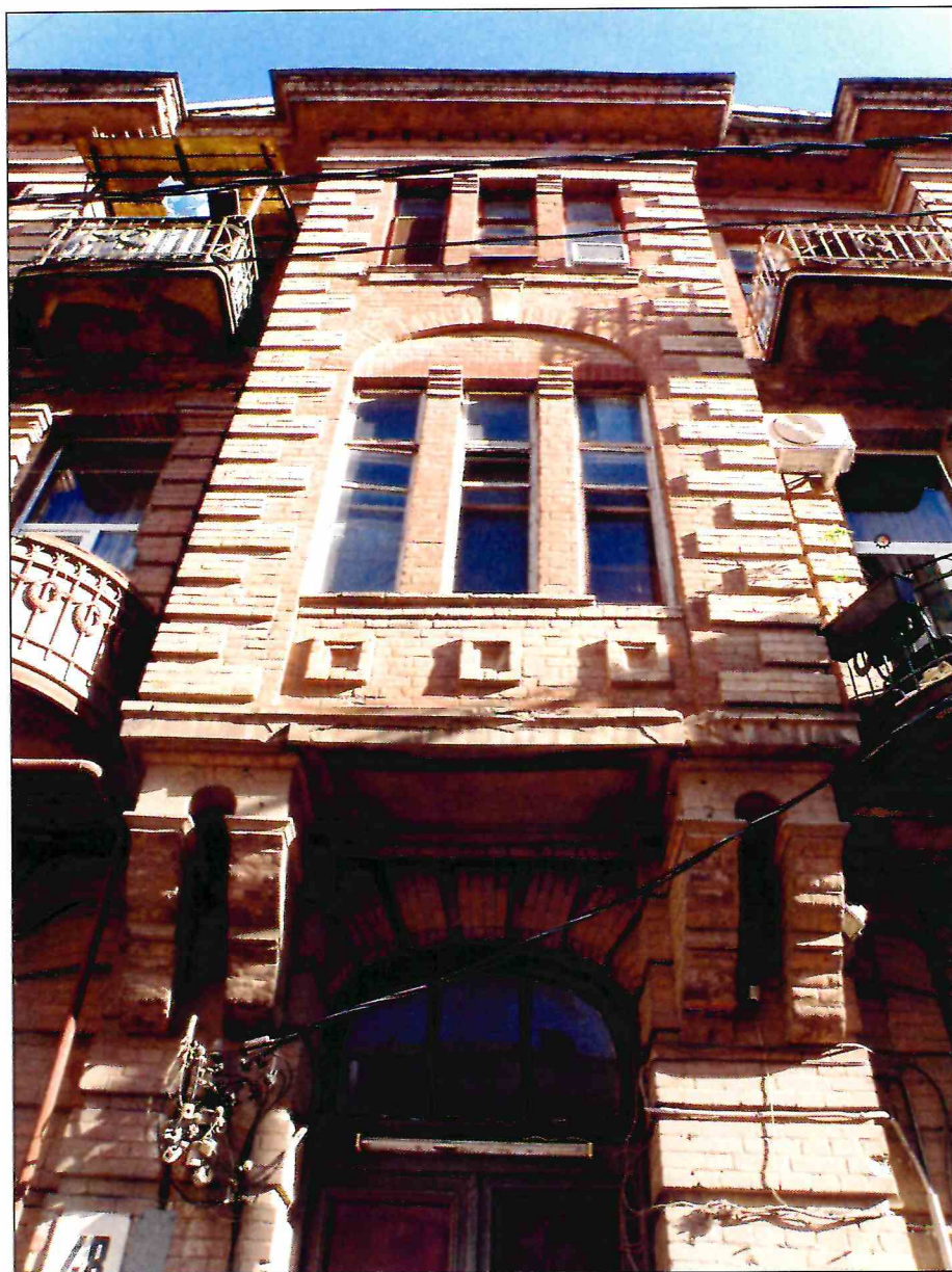
4. «Доходный дом М.Ф. Кофус». Эркер главного фасада.