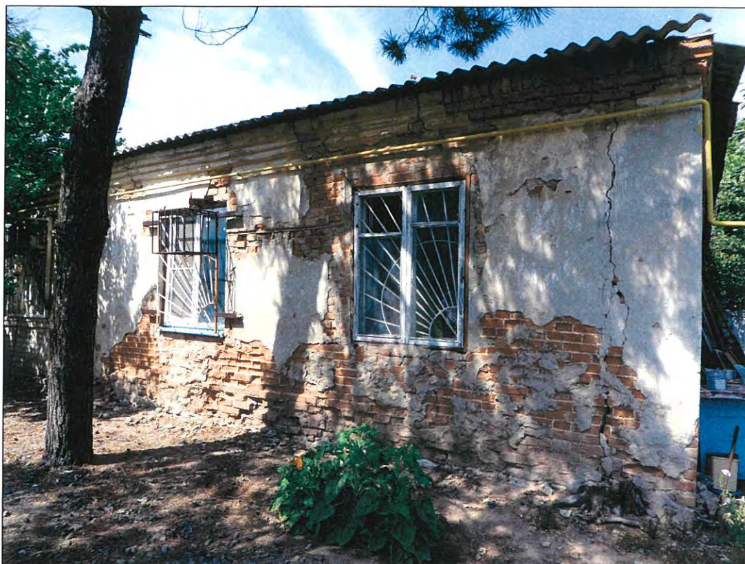
5. «Казачий курень». Южный фасад здания.