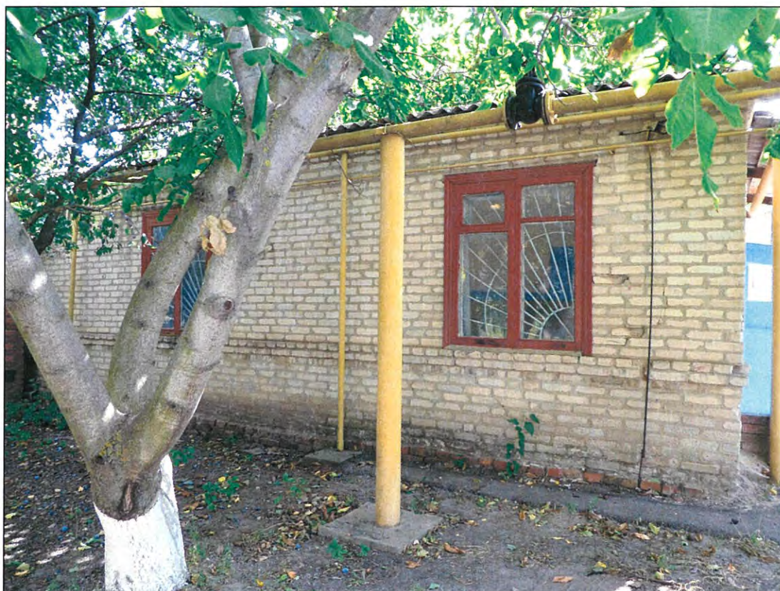
2. «Казачий курень». Северный фасад здания.