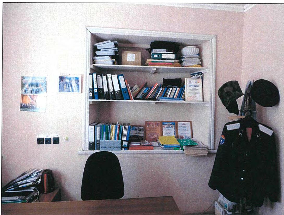
11. «Казачий курень». Помещение 1-го этажа.