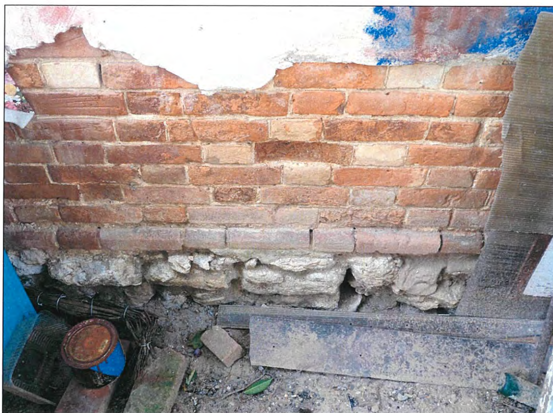
6. «Казачий курень». Фрагмент кладки стены восточного фасада.