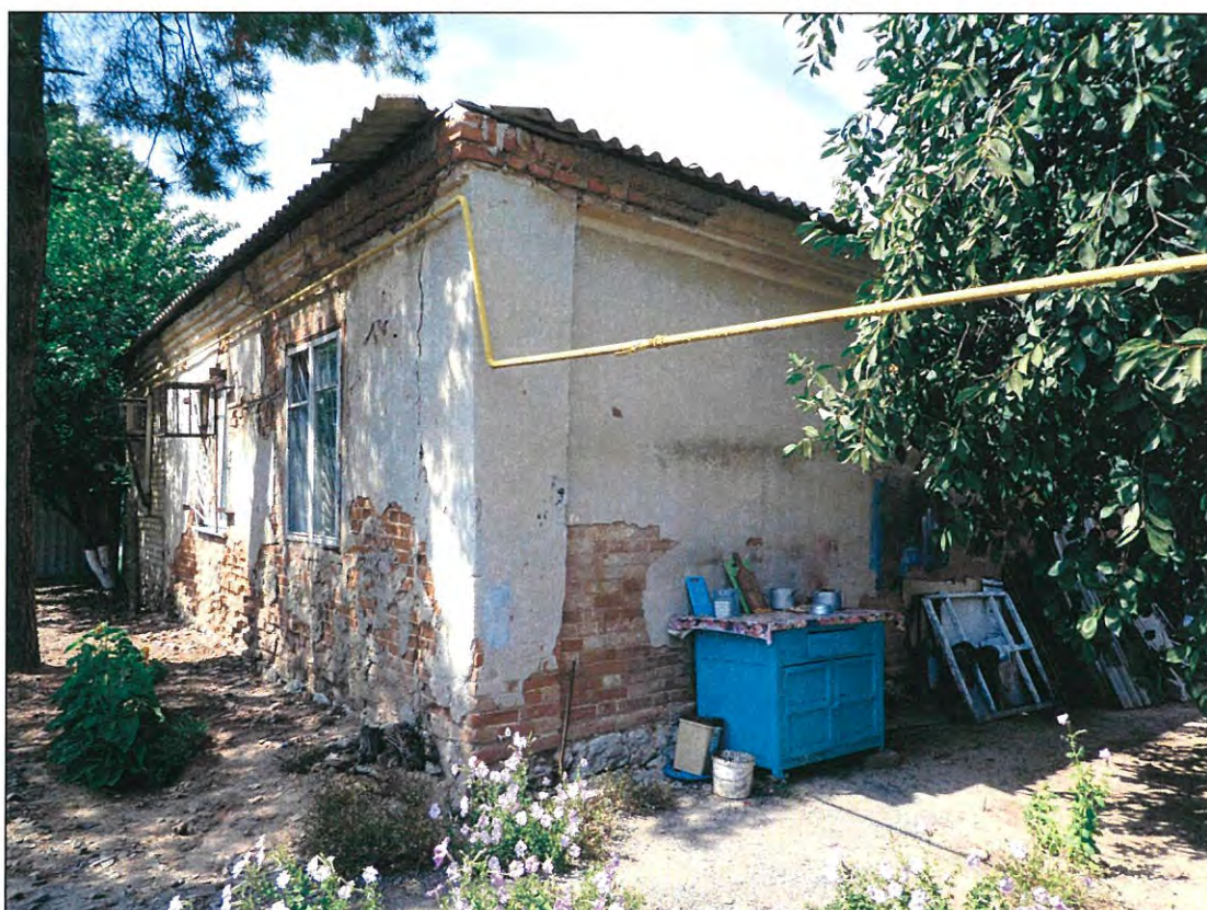
4. «Казачий курень». Вид здания с юго-востока.