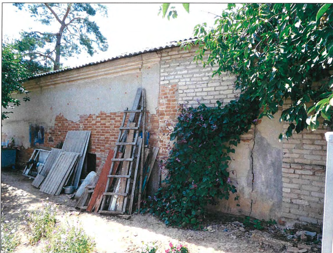
3. «Казачий курень». Восточный фасад здания.