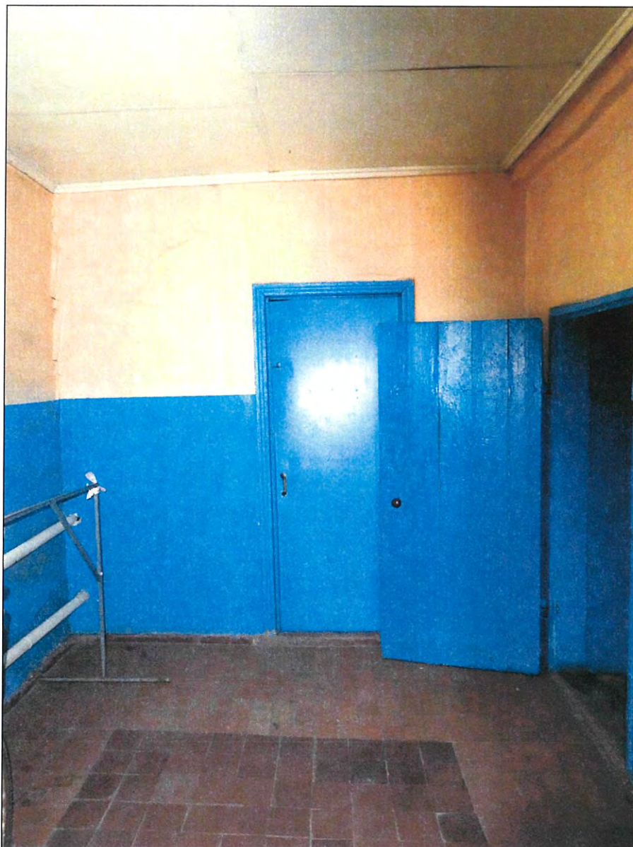
8. «Казачий курень». Вестибюль, расположенный в пристройке литера А1.