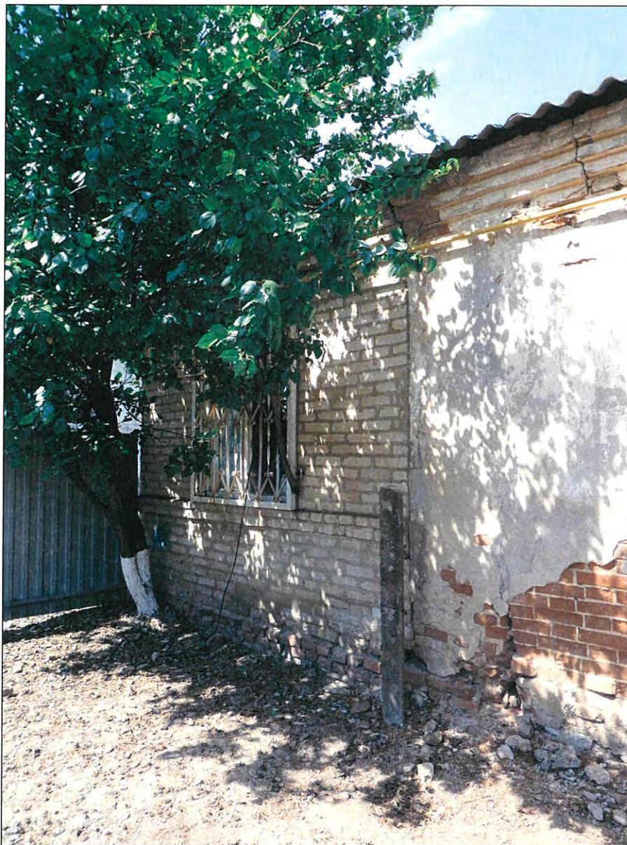
7. «Казачий курень». Поздняя пристройка к западной стене здания.