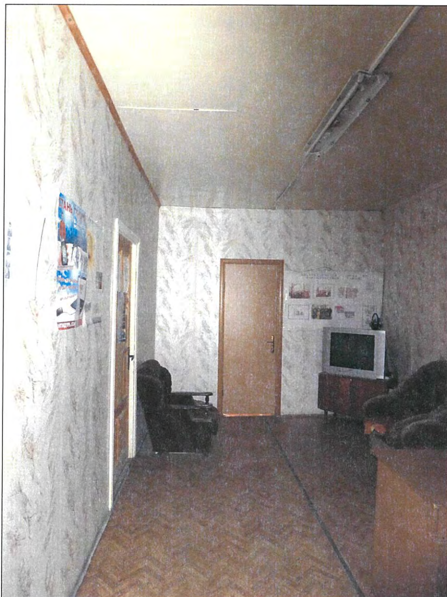
9. «Казачий курень». Помещение 1-го этажа.