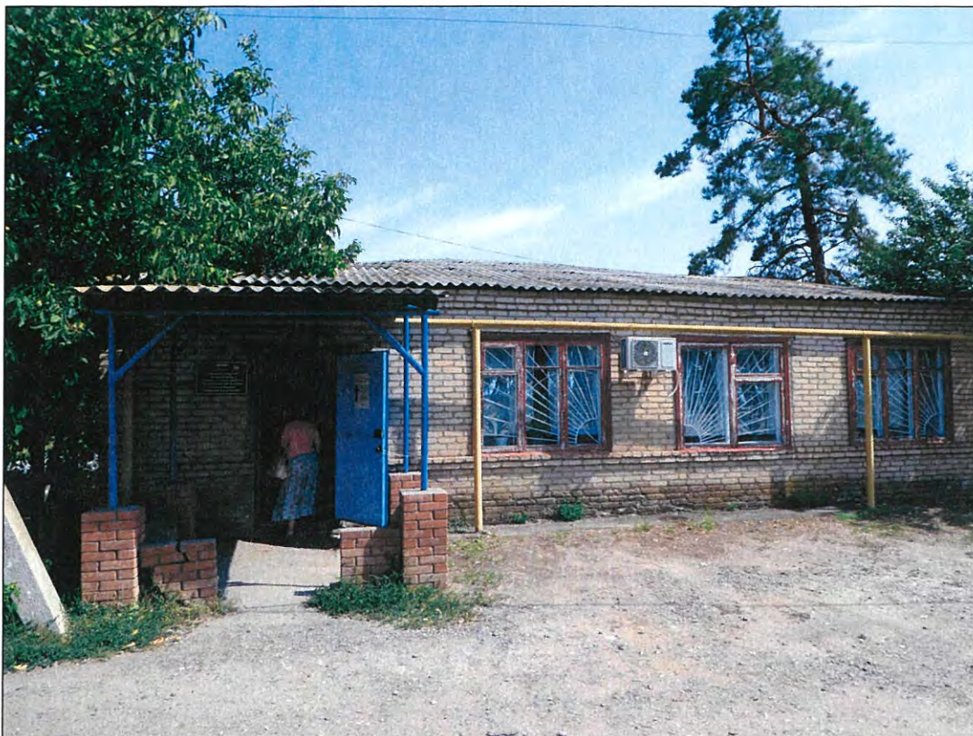
1. «Казачий курень». Западный фасад здания.