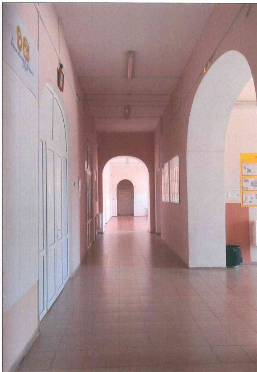
13. «Дом, в котором в 1920 г. находился штаб IX Красной Армии». Коридор второго этажа. Центральная часть.