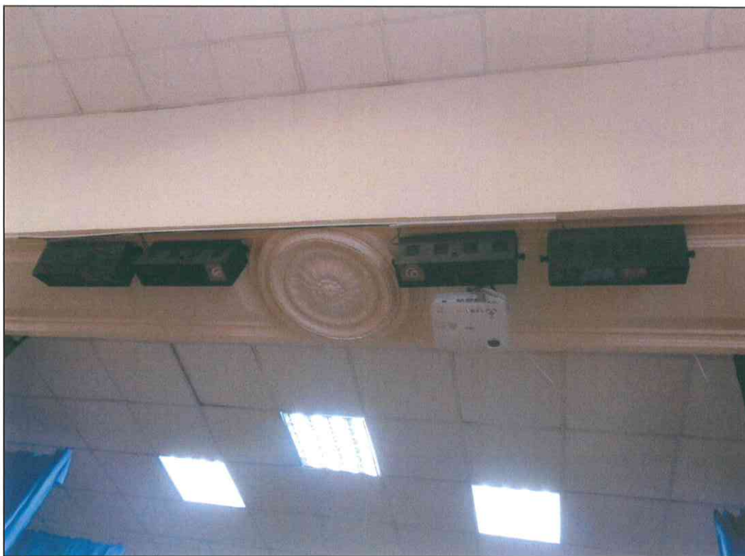
15. «Дом, в котором в 1920 г. находился штаб IX Красной Армии». Розетка проема в помещениях № 9 и № 8 второго этажа.