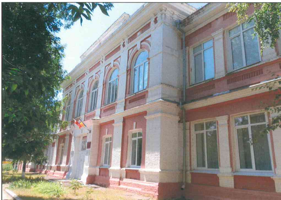
1. «Дом, в котором в 1920 г. находился штаб IX Красной Армии». Общий вид с северо-востока.