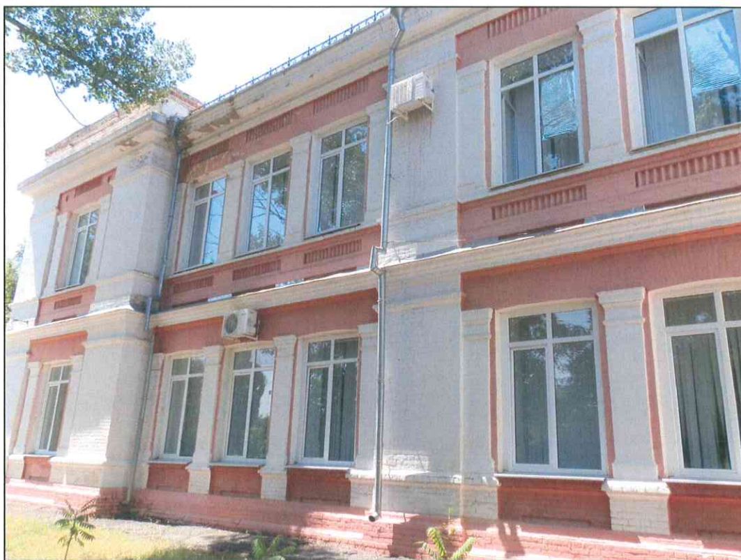
4. «Дом, в котором в 1920 г. находился штаб IX Красной Армии». Фрагмент парадного восточного фасада. Южная часть.