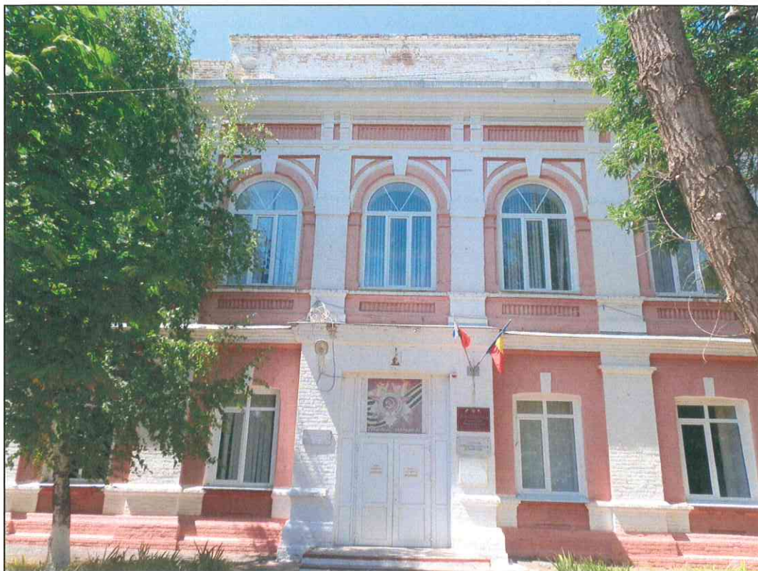
3. «Дом, в котором в 1920 г. находился штаб IX Красной Армии». Фрагмент восточного парадного фасада. Центральная часть.