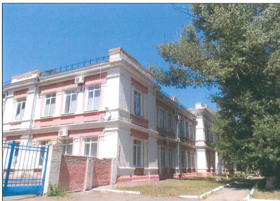
2. «Дом, в котором в 1920 г. находился штаб IX Красной Армии». Вид с юго-востока.