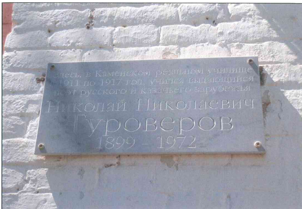
6. «Дом, в котором в 1920 г. находился штаб IX Красной Армии». Фрагмент парадного восточного фасада. Мемориальная доска.