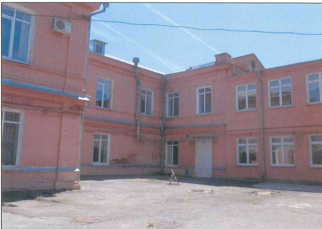
10. «Дом, в котором в 1920 г. находился штаб IX Красной Армии». Фрагмент дворовых фасадов.