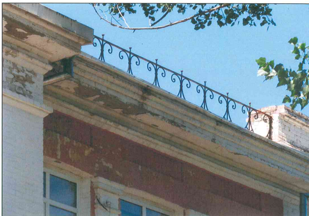
7. «Дом, в котором в 1920 г. находился штаб IX Красной Армии». Фрагмент ограждения кровли.