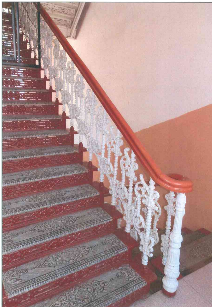
12. «Дом, в котором в 1920 г. находился штаб IX Красной Армии». Внутренняя междуэтажная лестница в юго-западной части.