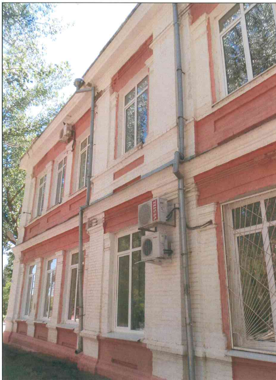
8. «Дом, в котором в 1920 г. находился штаб IX Красной Армии». Фрагмент северного парадного фасада.