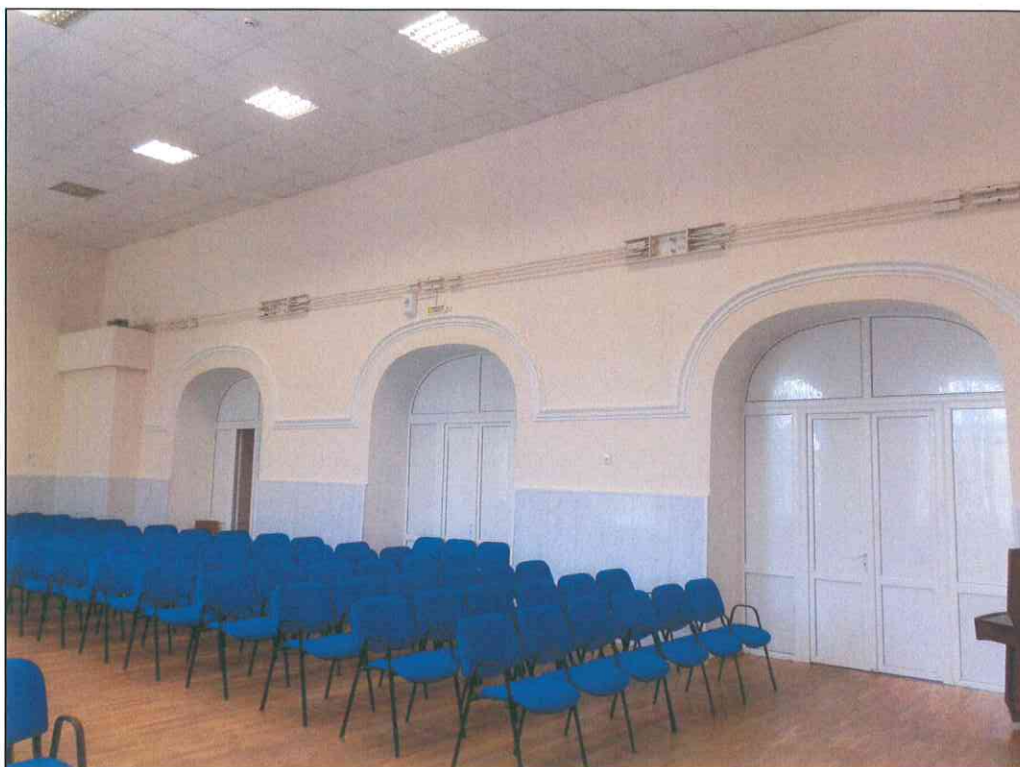
14. «Дом, в котором в 1920 г. находился штаб IX Красной Армии». Помещение № 9 второго этажа.