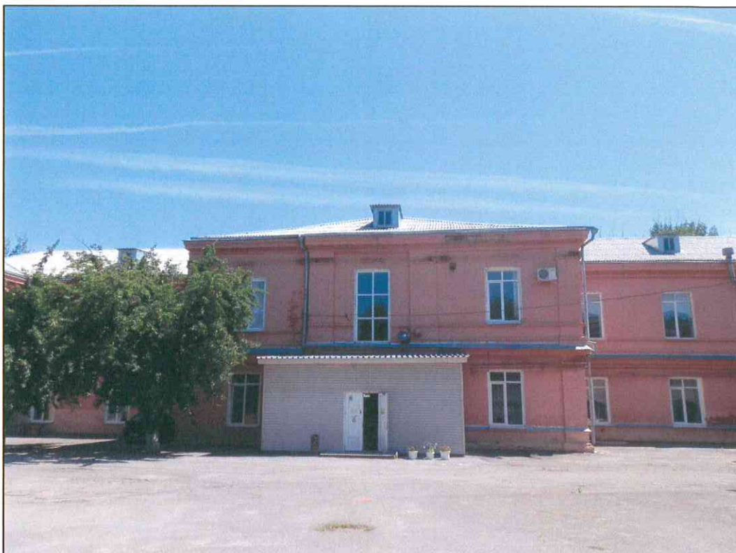
9. «Дом, в котором в 1920 г. находился штаб IX Красной Армии». Фрагмент западного дворового фасада. Центральная часть.