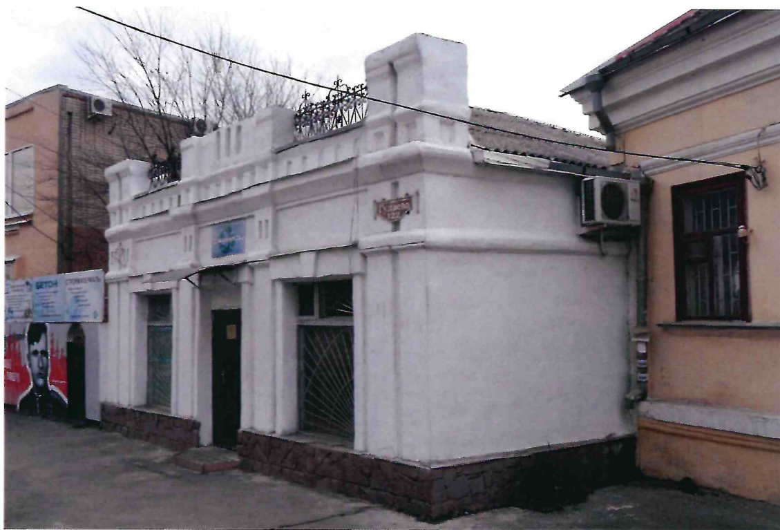
2. «Дом б.торговой лавки». Вид Объекта с северо-запада.