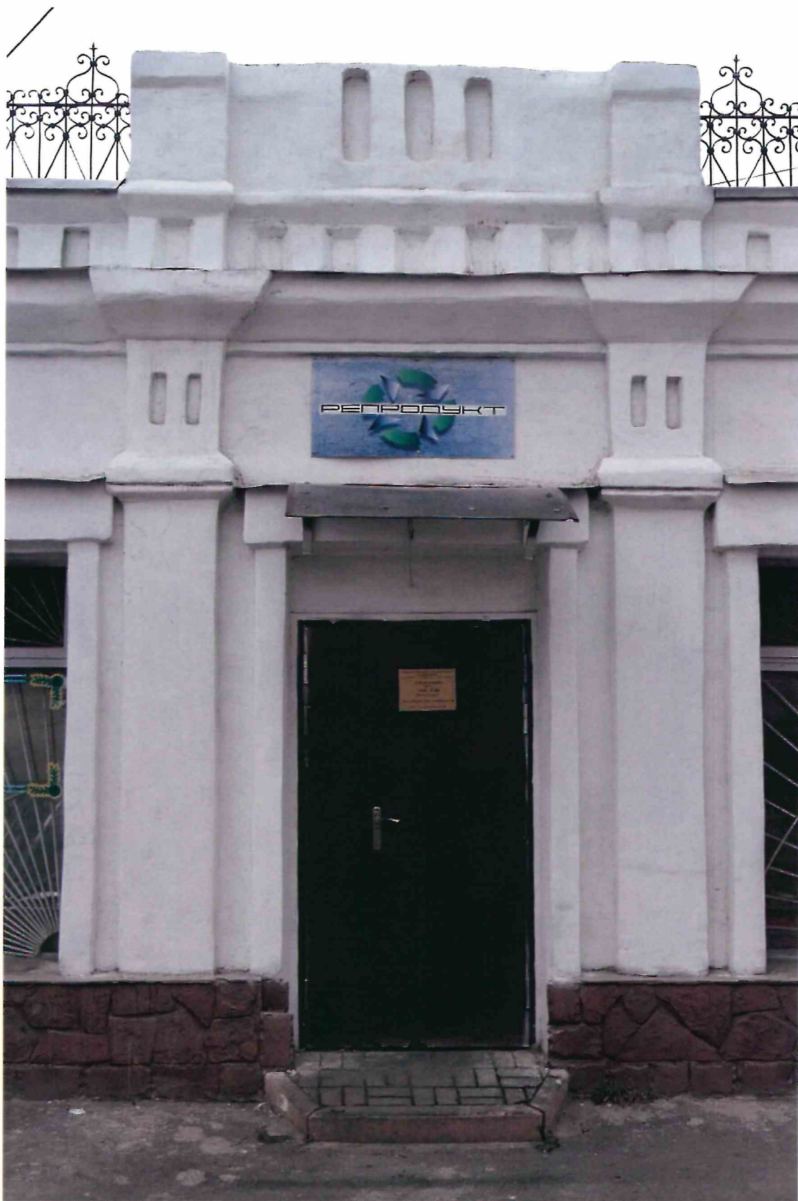
5. «Дом б.торговой лавки». Центральная раскреповка северного фасада Объекта.