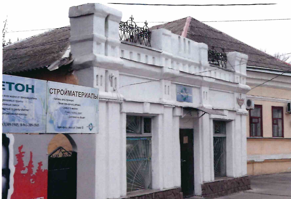
3. «Дом б.торговой лавки». Вид Объекта с северо-востока.