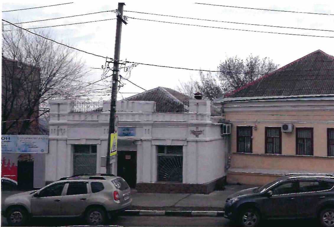
1. «Дом б.торговой лавки». Общий вид Объекта в застройке улицы Гулаева.