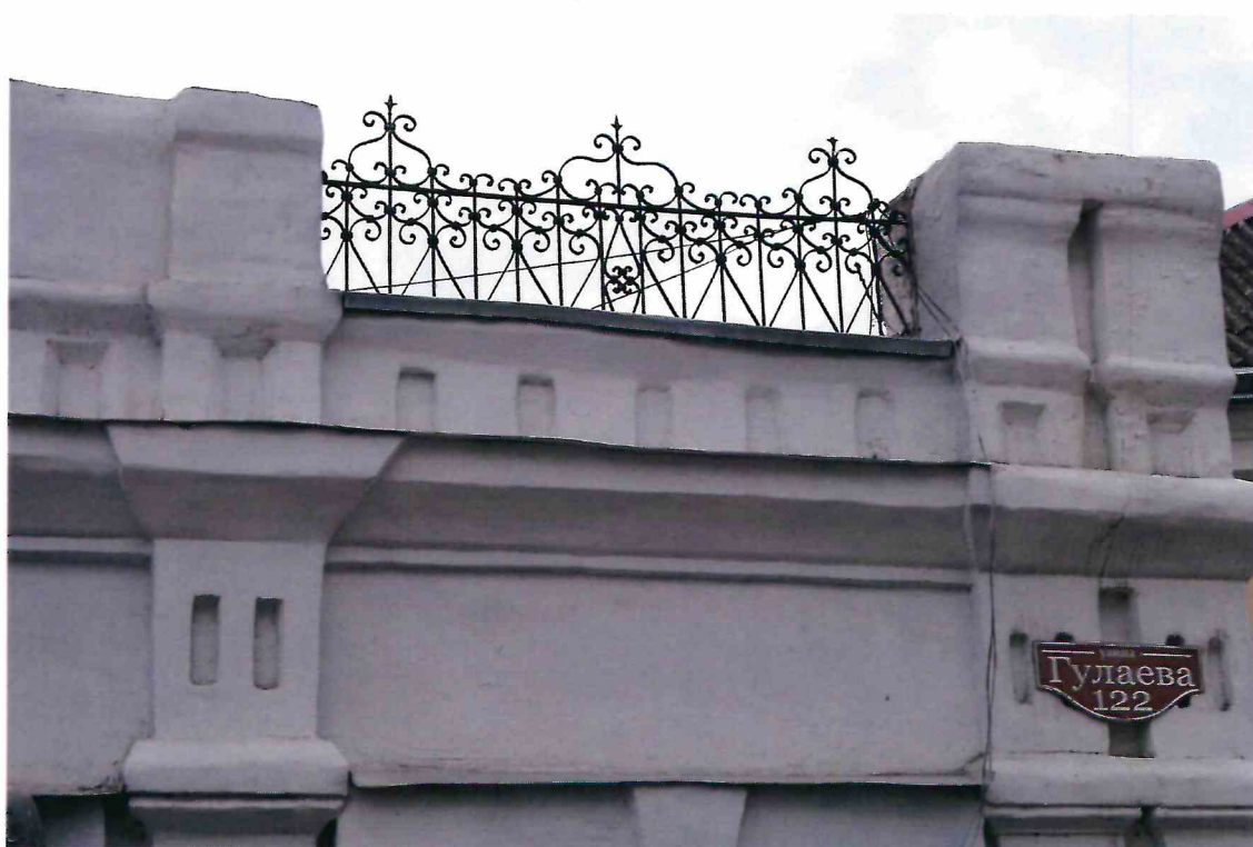
4. «Дом б.торговой лавки». Фрагмент северного фасада.