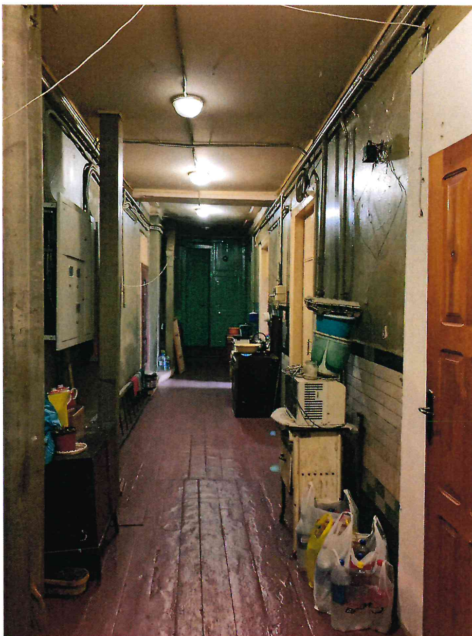
10. Коридор третьего этажа Объекта.