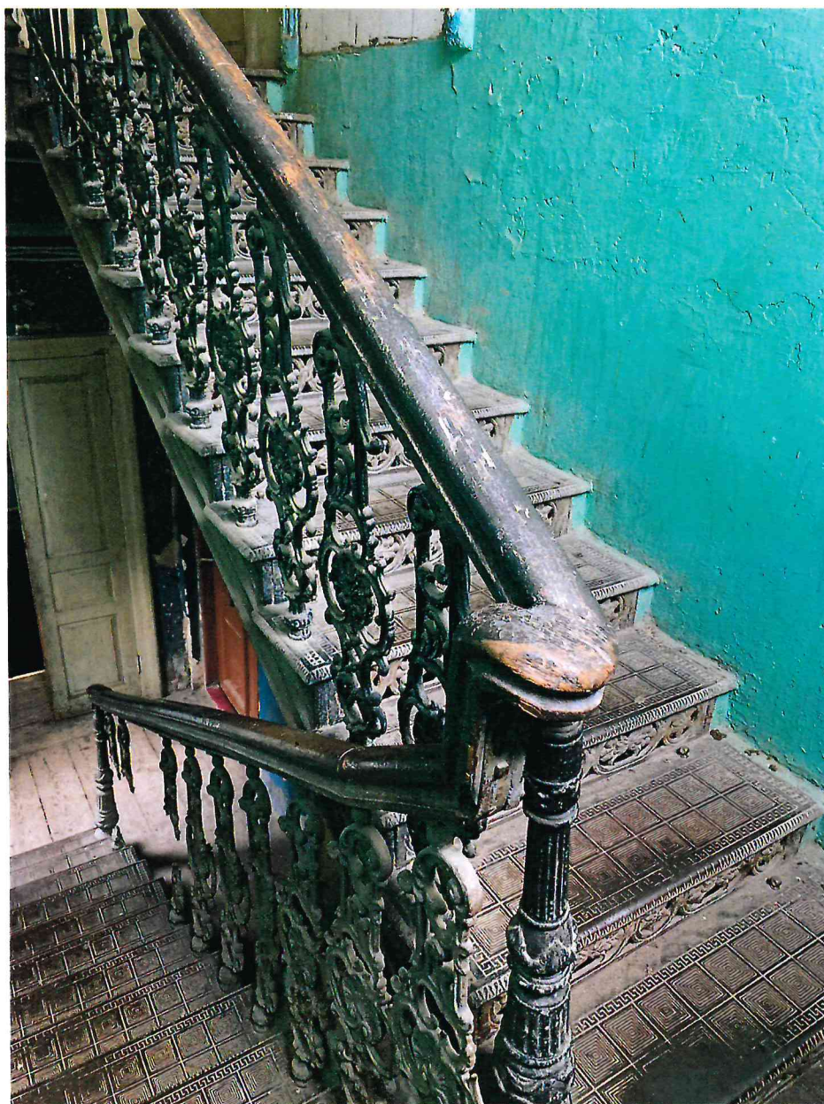
9. Внутренняя междуэтажная лестница в западной части Объекта.