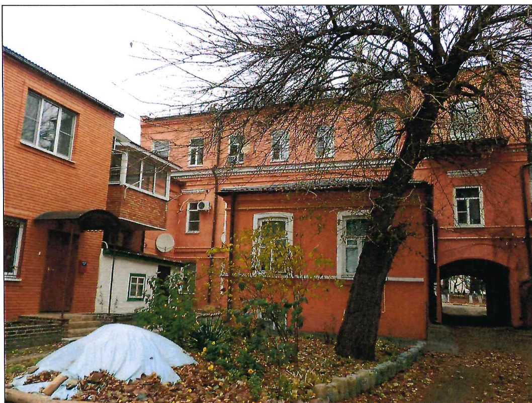
5. Вид Объекта с юга.