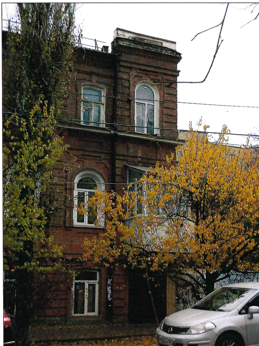
4. Фрагмент главного северо-восточного фасада. Крайняя западная раскреповка