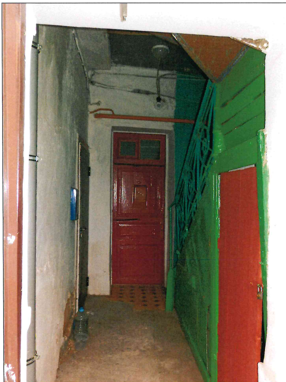
7. Помещение лестничной клетки в центральной части Объекта.