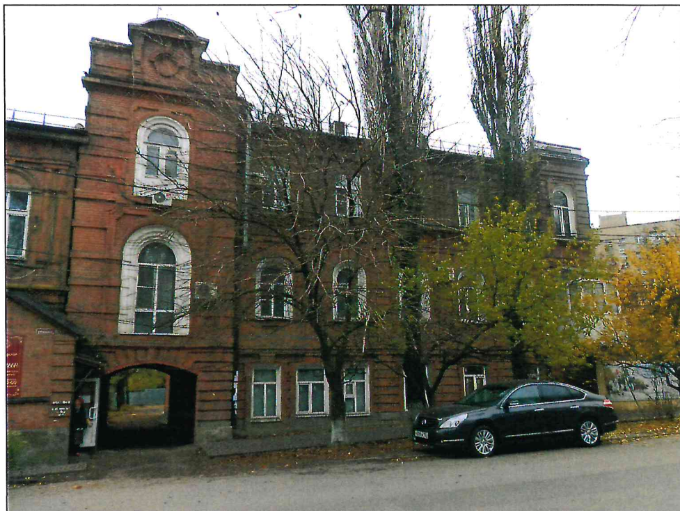
1. Вид Объекта с северо-востока.