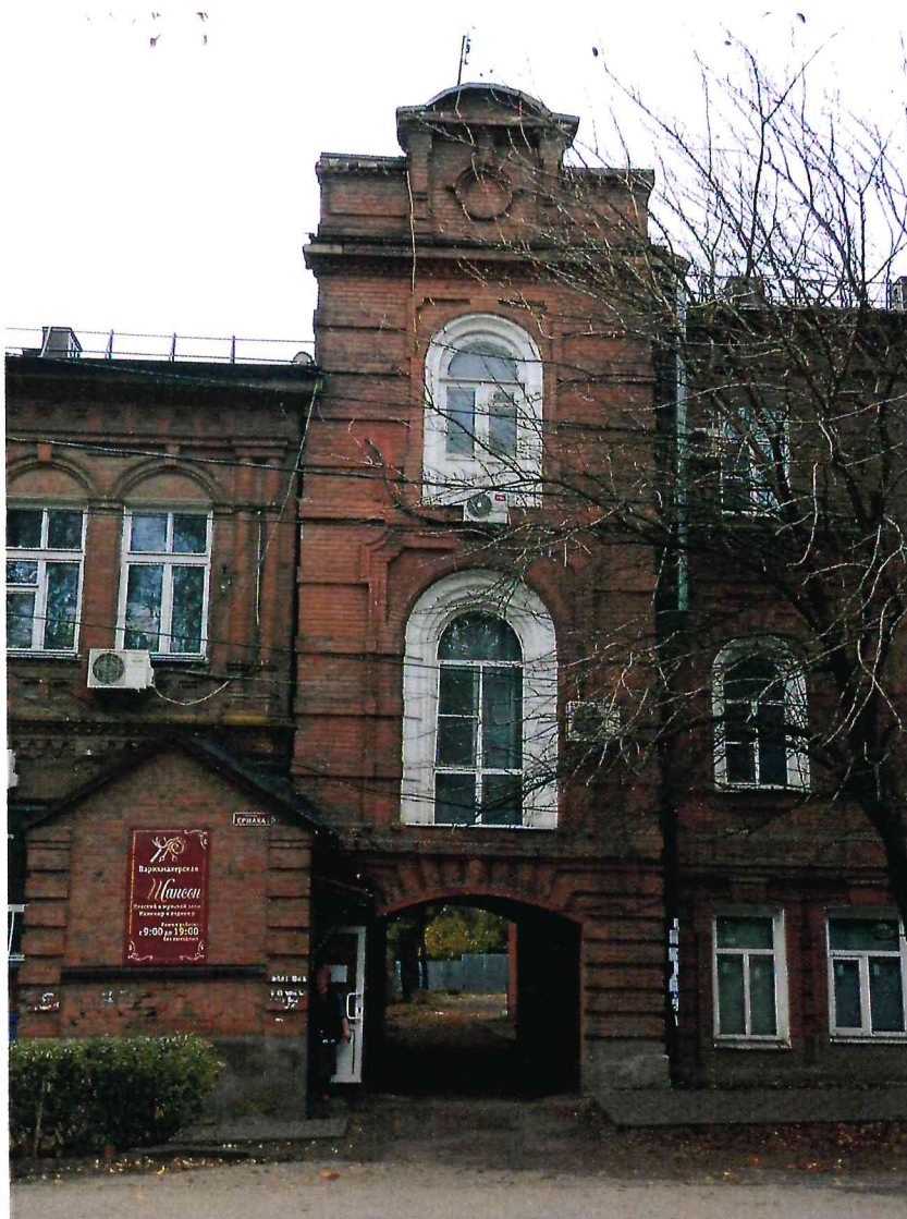
3. Фрагмент главного северо-восточного фасада. Крайняя восточная раскреповка.