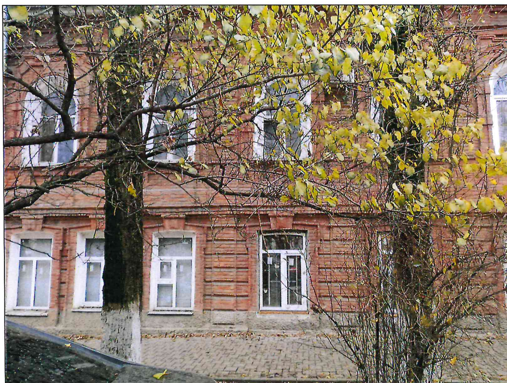
6. Фрагмент главного северо-восточного фасада.