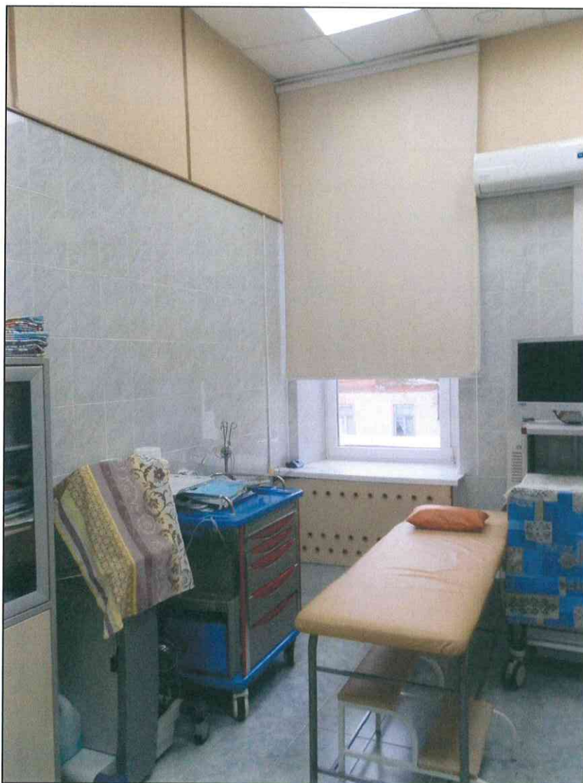
8. «Здание 7-го городского училища, 1895 г., арх. Н.А. Дорошенко». Помещение второго этажа.