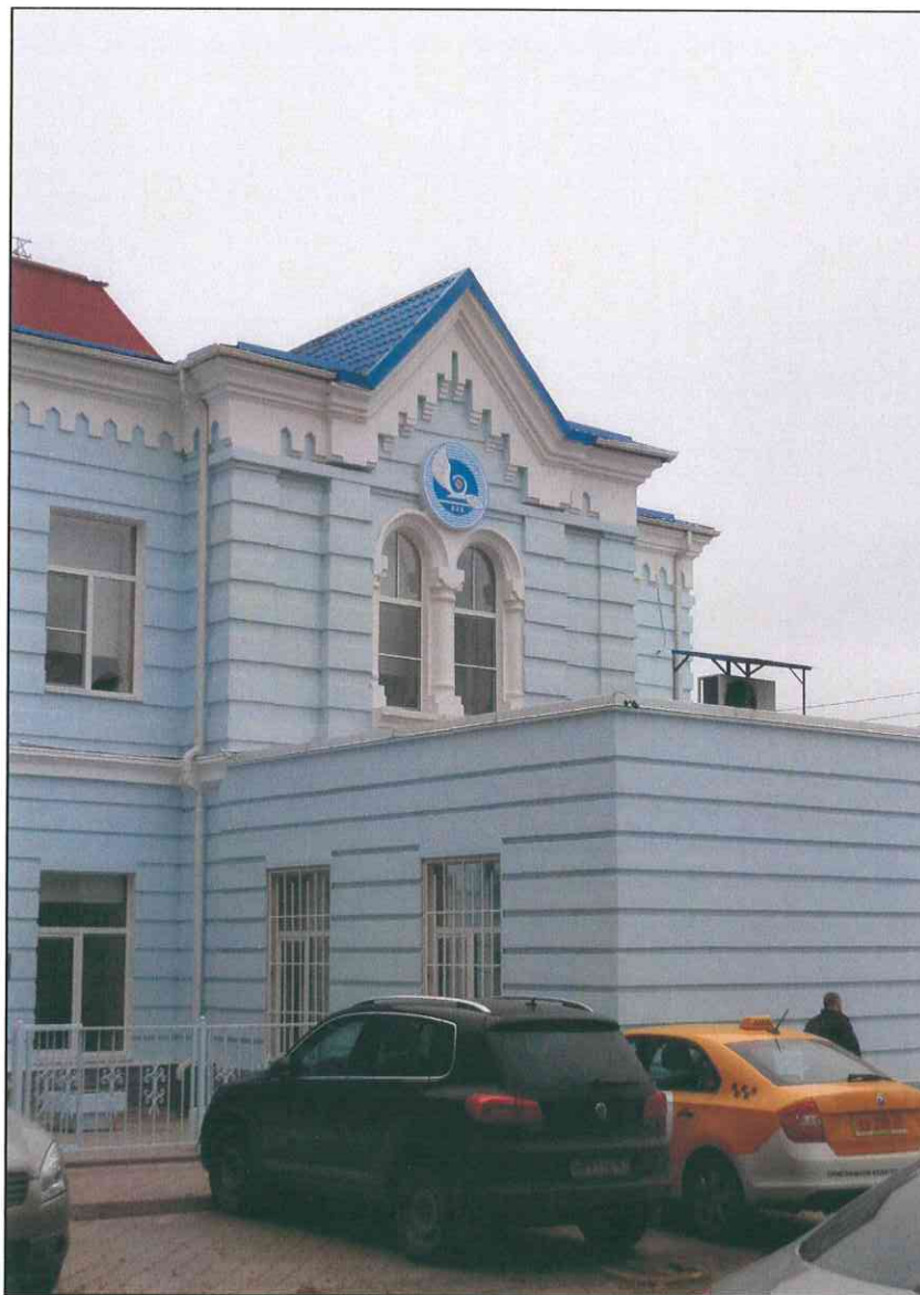
5. «Здание 7-го городского училища, 1895 г., арх. Н.А. Дорошенко». Фрагмент северного парадного фасада. Крайний западный ризалит.