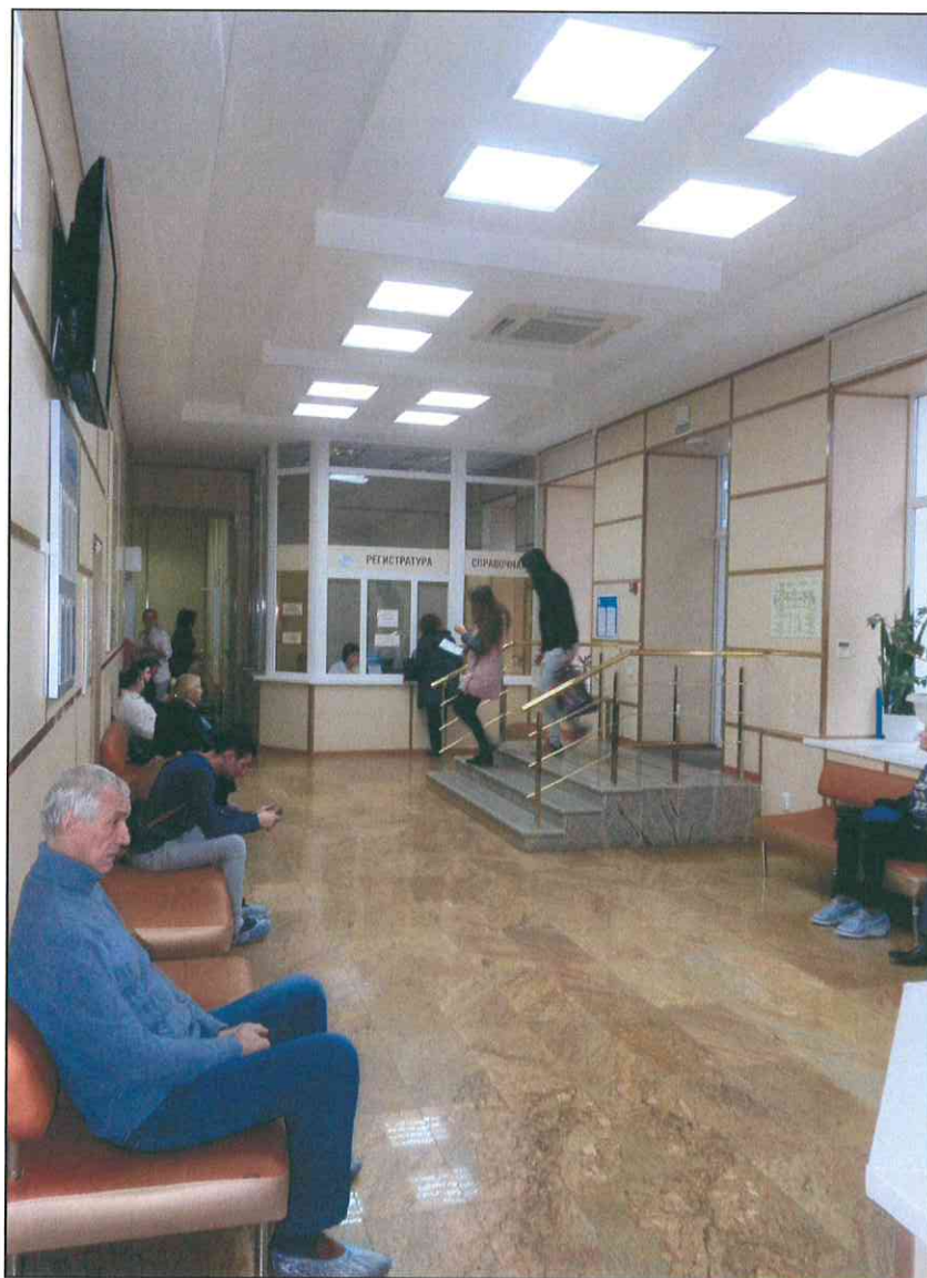
10. «Здание 7-го городского училища, 1895 г., арх. Н.А. Дорошенко». Фрагмент вестибюля первого этажа.