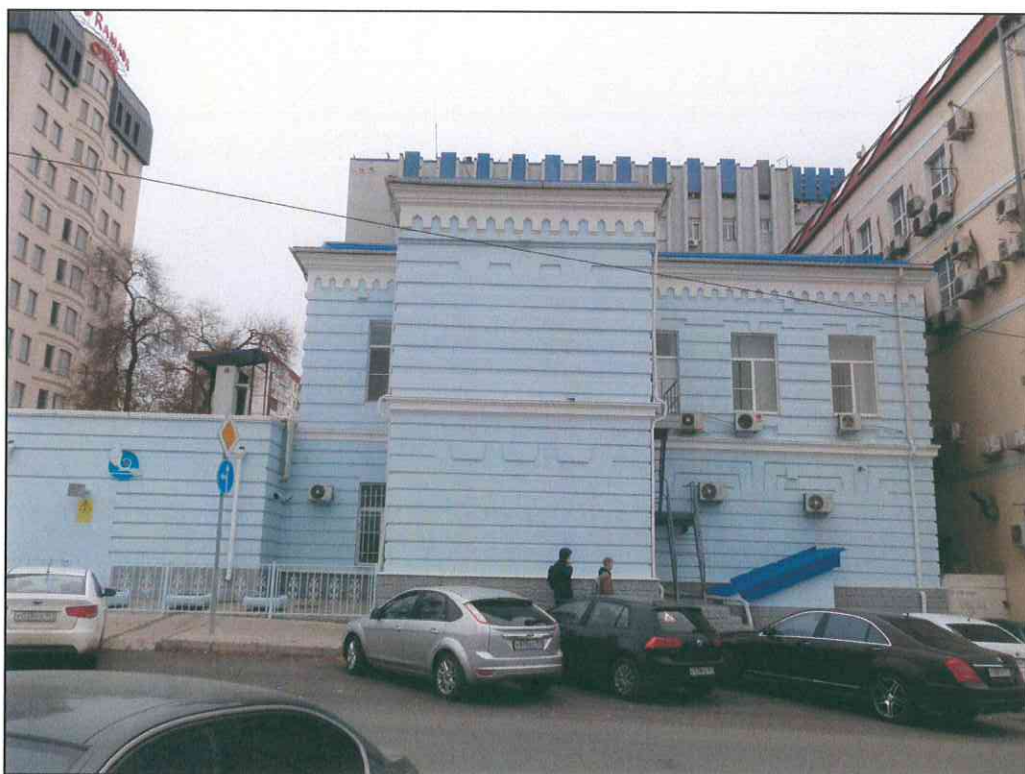
4. «Здание 7-го городского училища, 1895 г., арх. Н.А. Дорошенко». Западный парадный фасад.