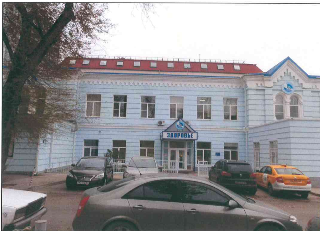
3. «Здание 7-го городского училища, 1895 г., арх. Н.А. Дорошенко». Северный парадный фасад.