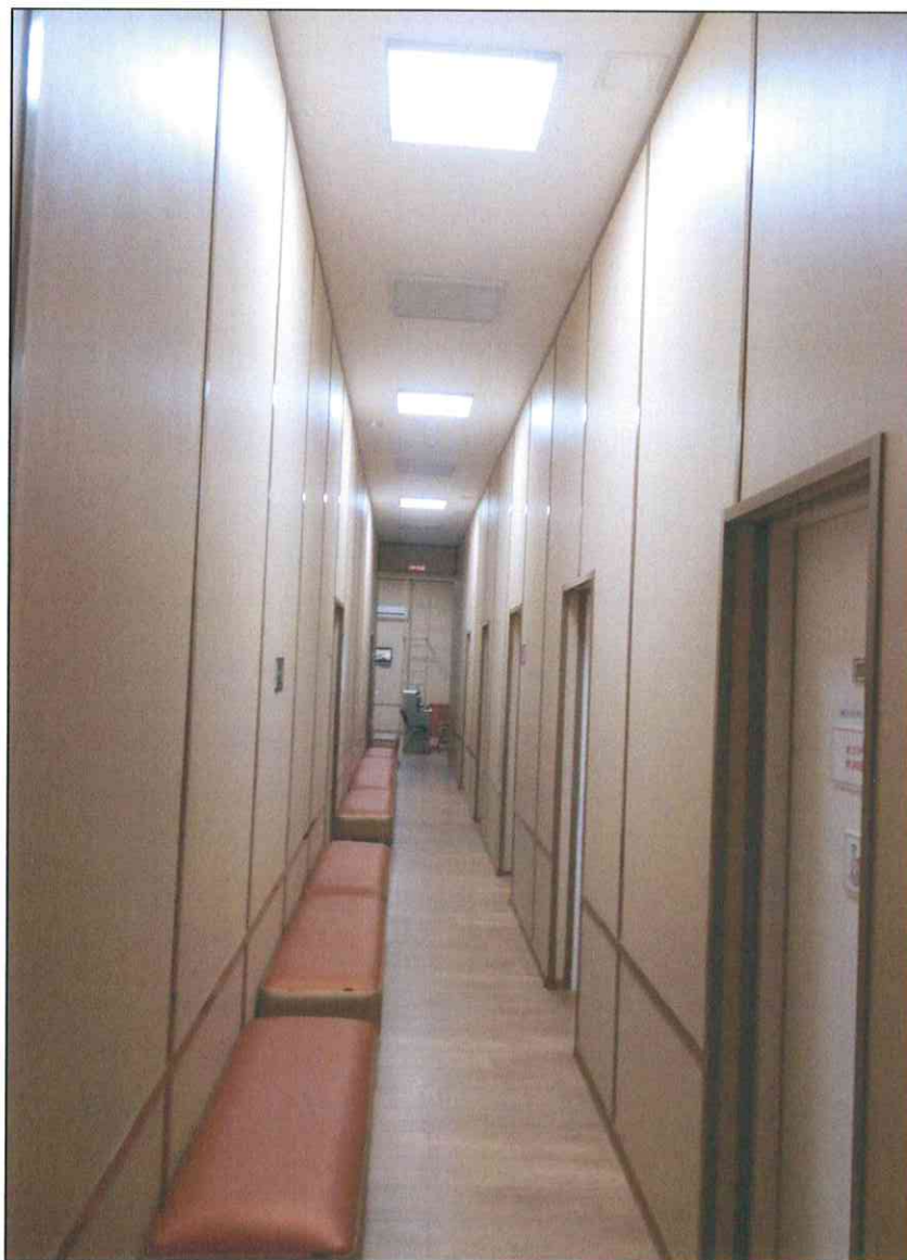
7. «Здание 7-го городского училища, 1895 г., арх. Н.А. Дорошенко». Помещение коридора второго этажа.