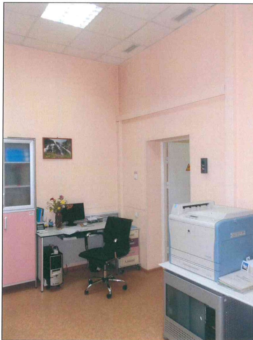
9. «Здание 7-го городского училища, 1895 г., арх. Н.А. Дорошенко». Фрагмент помещения первого этажа.