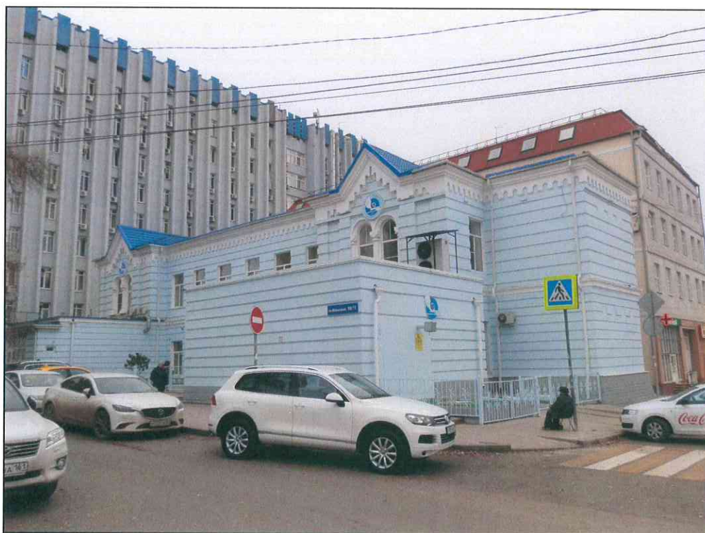
2. «Здание 7-го городского училища, 1895 г., арх. Н.А. Дорошенко». Вид здания с северо-запада.