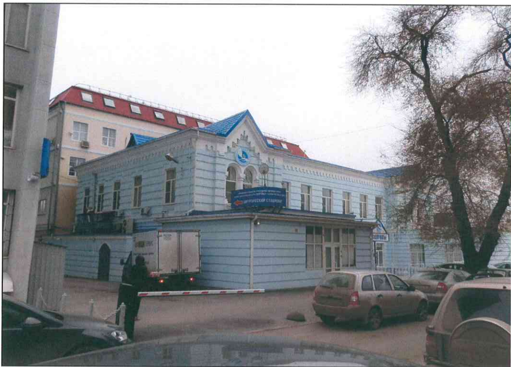
1. «Здание 7-го городского училища, 1895 г., арх. Н.А. Дорошенко». Общий вид здания с северо-востока.