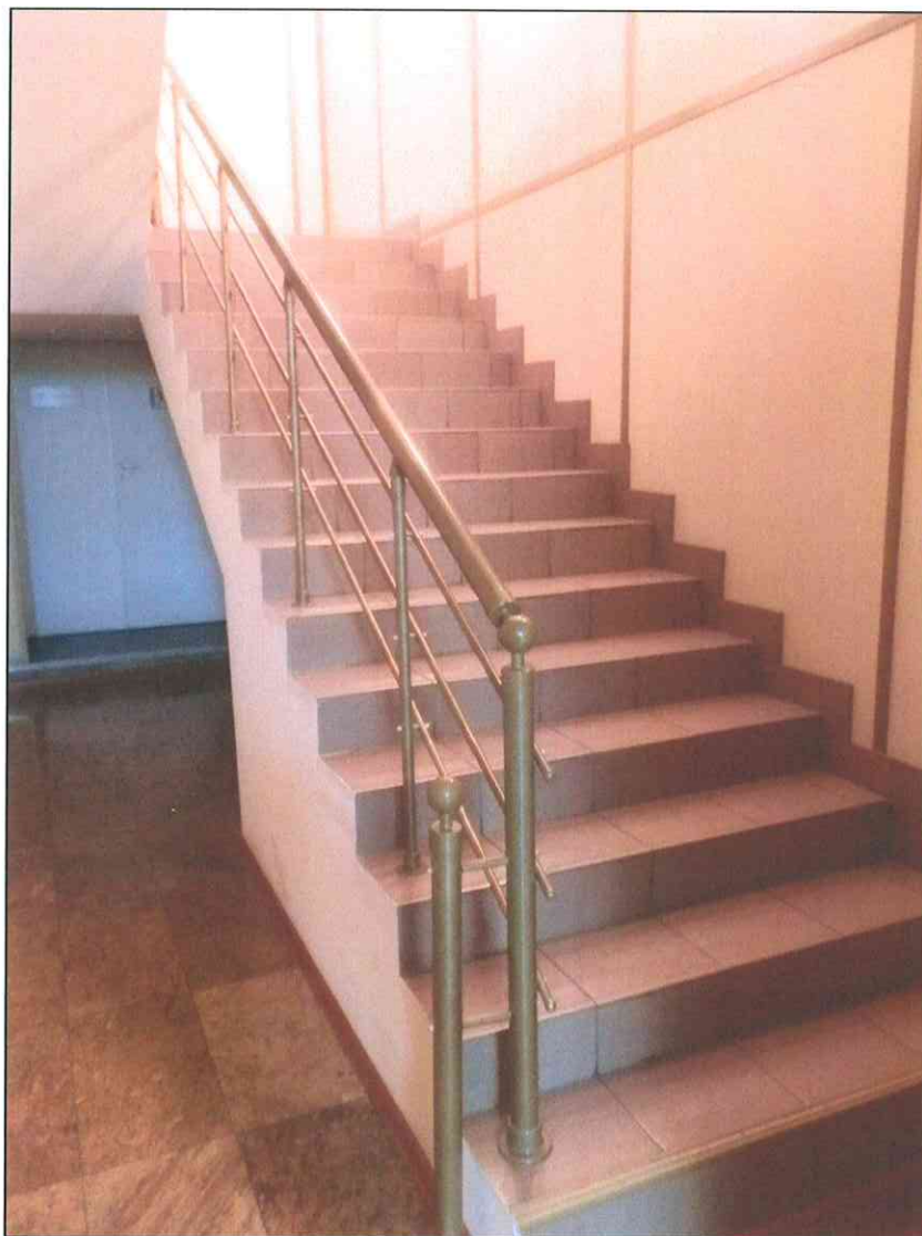
6. «Здание 7-го городского училища, 1895 г., арх. Н.А. Дорошенко». Внутренняя междуэтажная лестница.