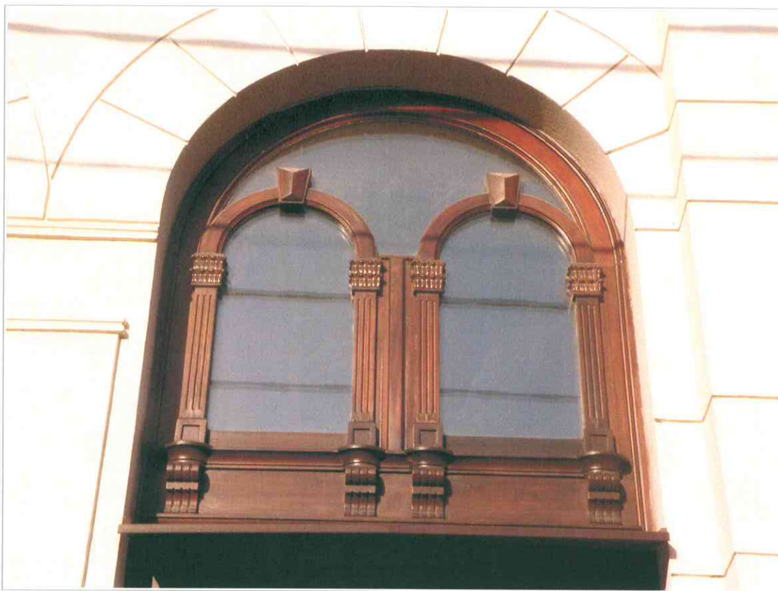
9. «Синагога солдатская, 1872 г.». Остекленная фрамуга двери парадного входа.