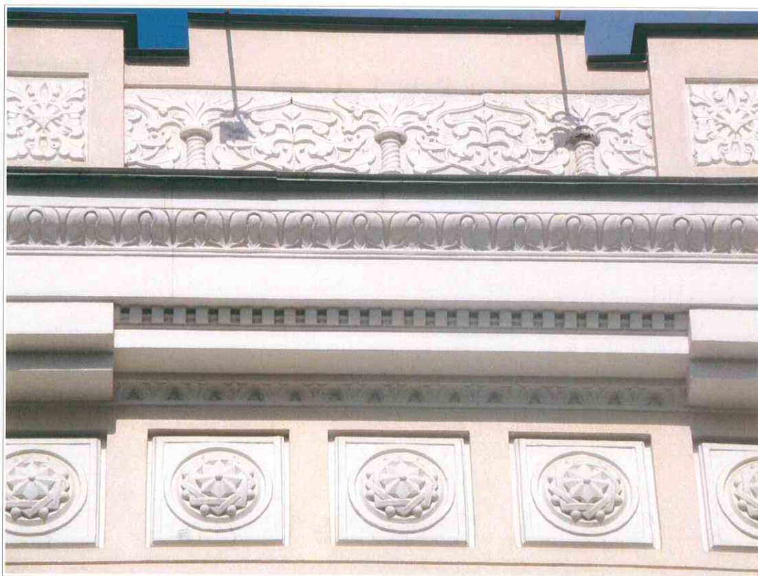
7. «Синагога солдатская, 1872 г.». Фрагмент западного фасада. Лепной декор фриза.