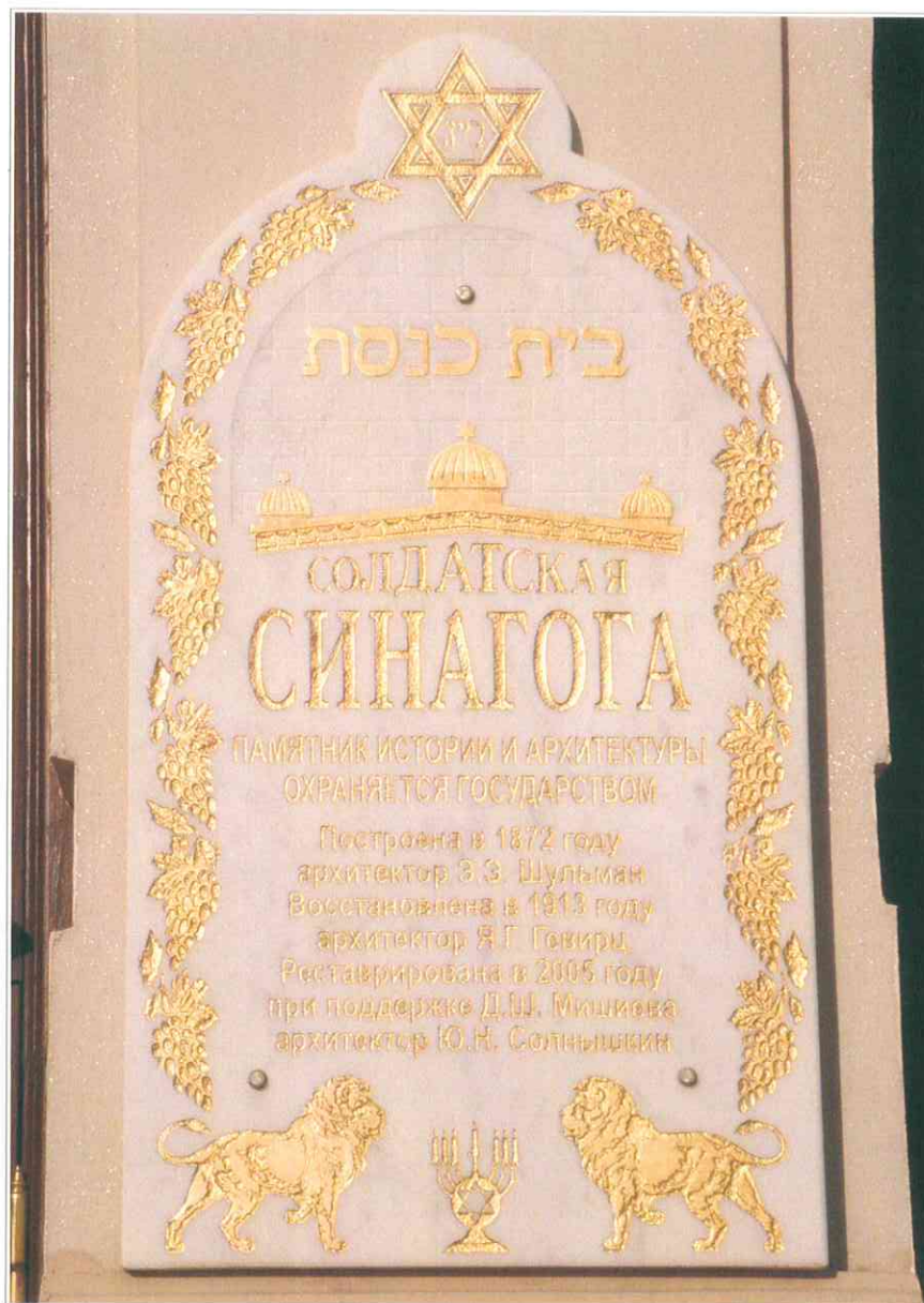
11. «Синагога солдатская, 1872 г.». Мемориальная плита на стене западного фасада.