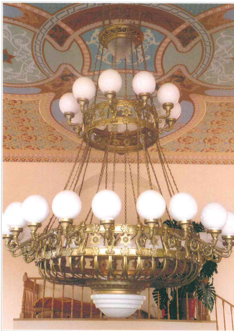
17. «Синагога солдатская, 1872 г.». Многоровожковая бронзовая люстра на гибкой подвеске.