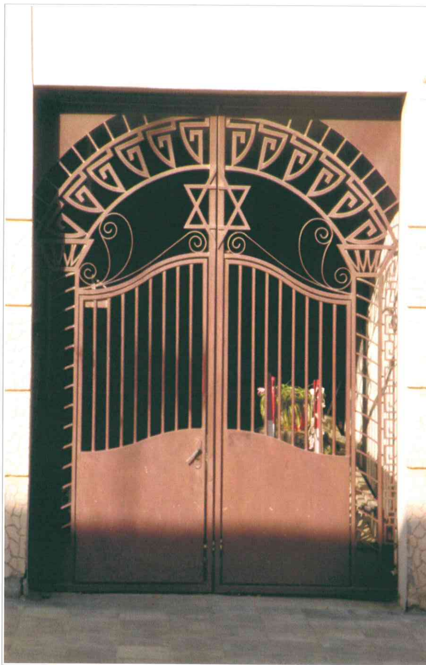
5. «Синагога солдатская, 1872 г.». Фрагмент западного фасада. Ворота местного проезда.