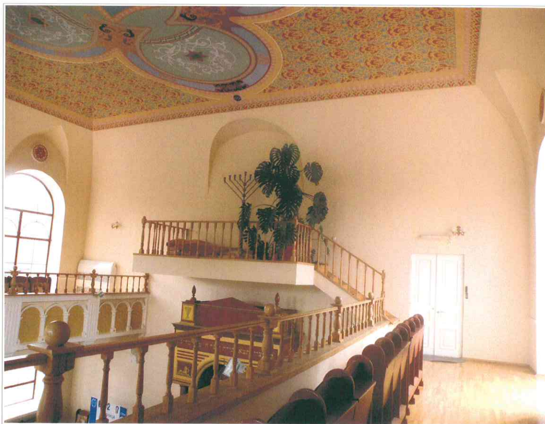
13. «Синагога солдатская, 1872 г.». Интерьер молельного зала. Вид с обходной галереи.