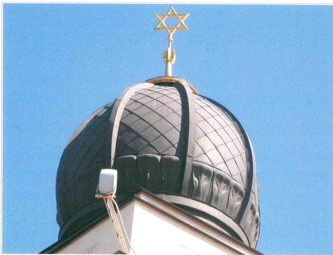
4. «Синагога солдатская, 1872 г.». Шпиль с шестиконечной звездой, установленные на куполе здания.