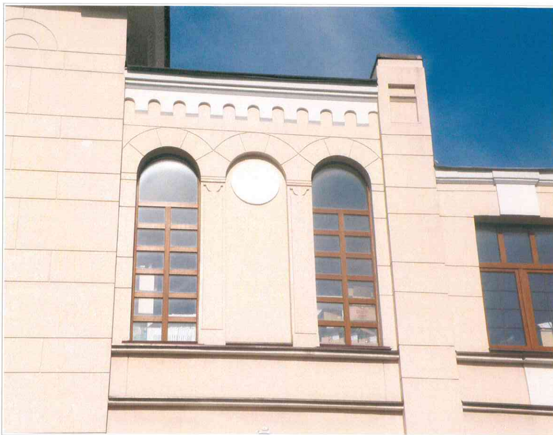
6. «Синагога солдатская, 1872 г.». Фрагмент западного фасада. Арочные окна 2-го этажа.