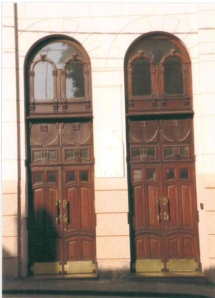
8. «Синагога солдатская, 1872 г.». Фрагмент западного фасада. Двери парадного входа.