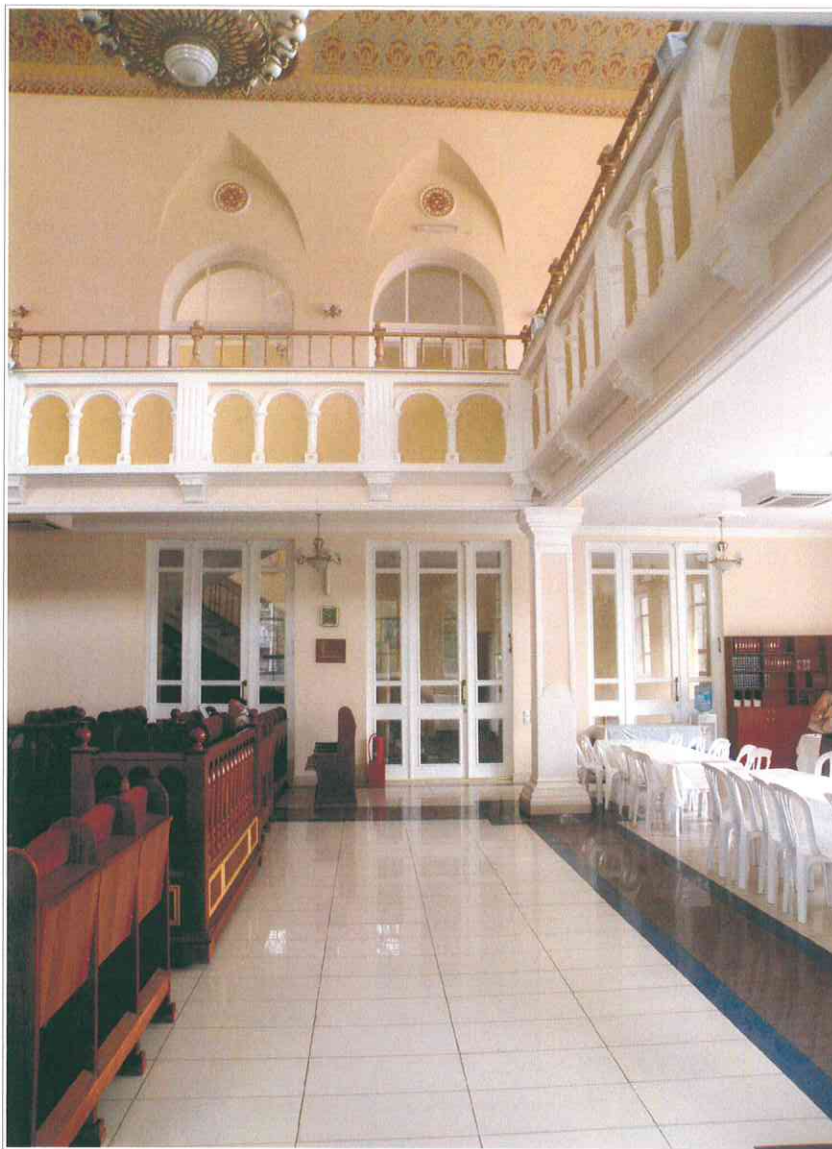
15. «Синагога солдатская, 1872 г.». Фрагмент интерьера молельного зала.