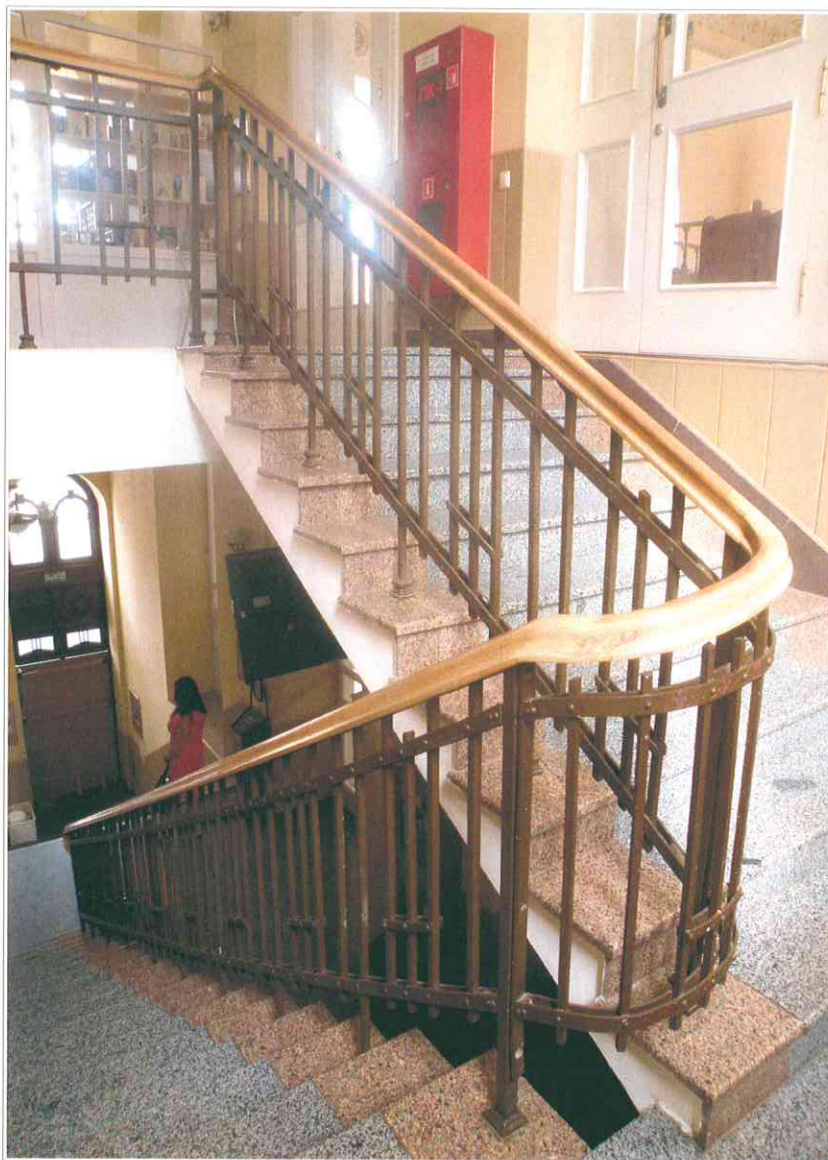
23. «Синагога солдатская, 1872 г.». Парадная лестница. Ограждение лестничных маршей.