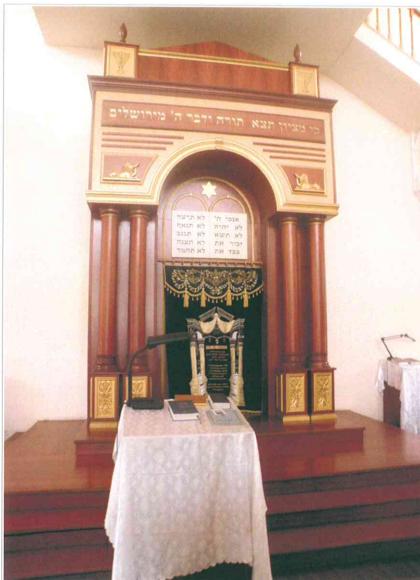
16. «Синагога солдатская, 1872 г.». Арон – Кадеш в интерьере молельного зала.