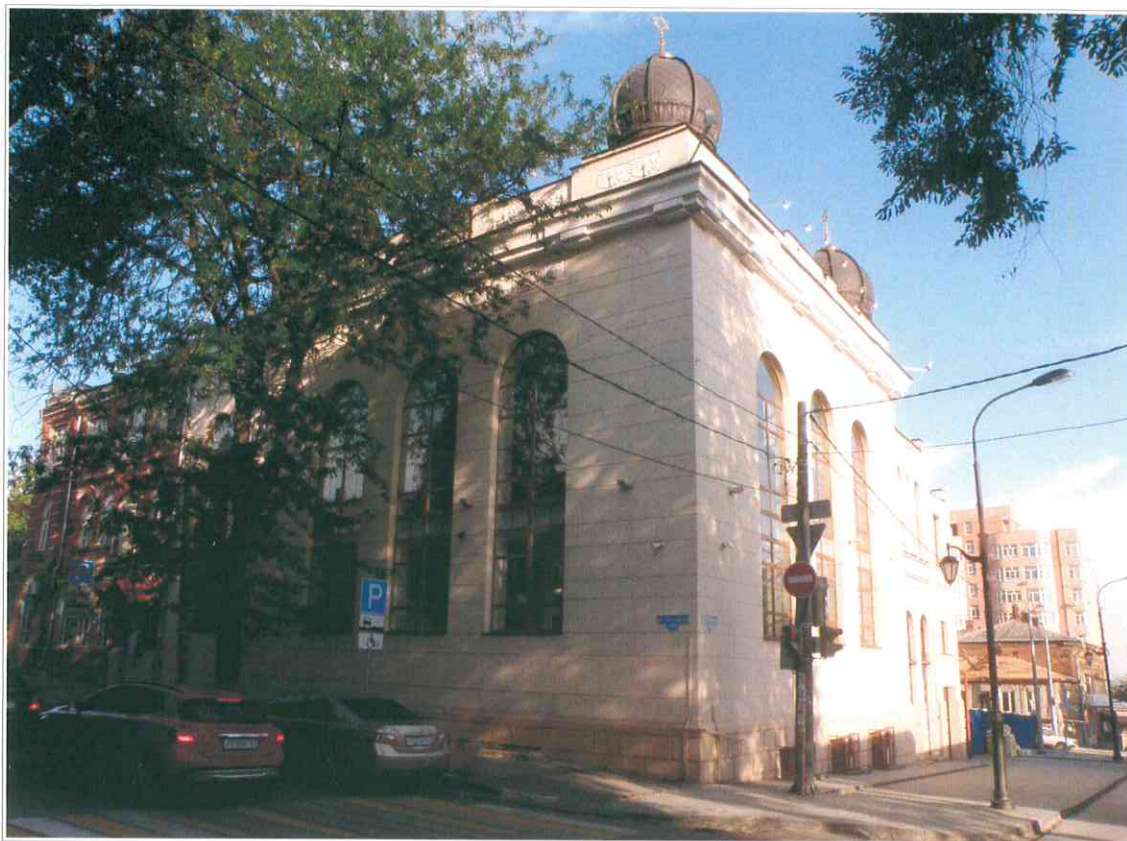
1. «Синагога солдатская, 1872 г.». Вид здания синагоги с северо-запада.