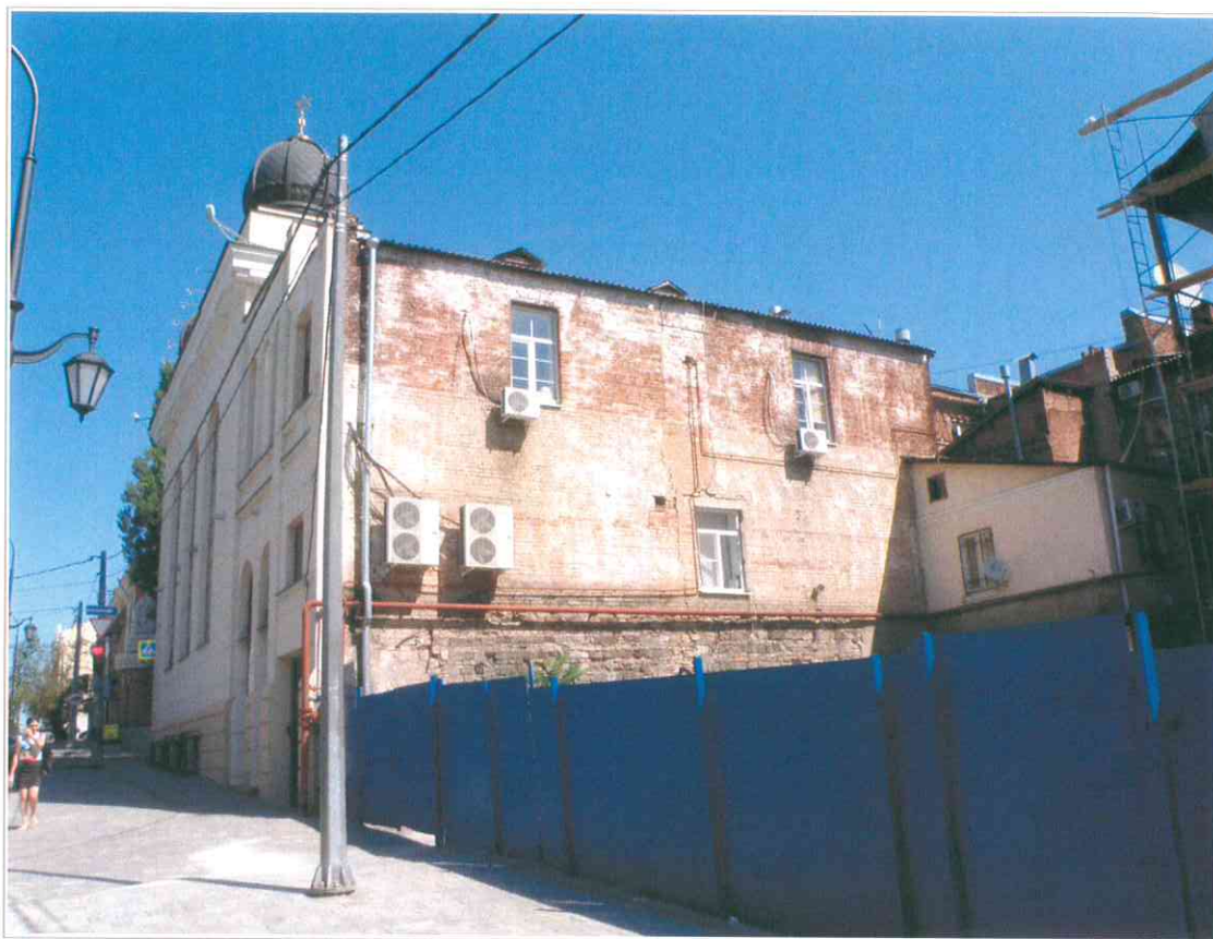
3. «Синагога солдатская, 1872 г.». Вид здания синагоги с южной стороны.