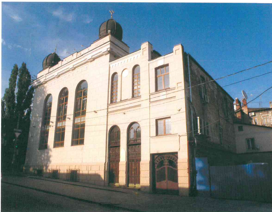
2. «Синагога солдатская, 1872 г.». Вид здания синагоги с юго-запада.