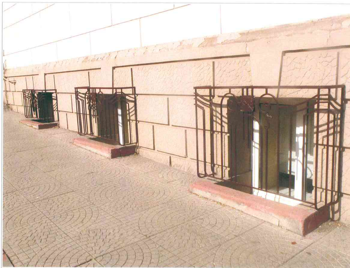
10. «Синагога солдатская, 1872 г.» . Фрагмент западного фасада. Окна подвального этажа.