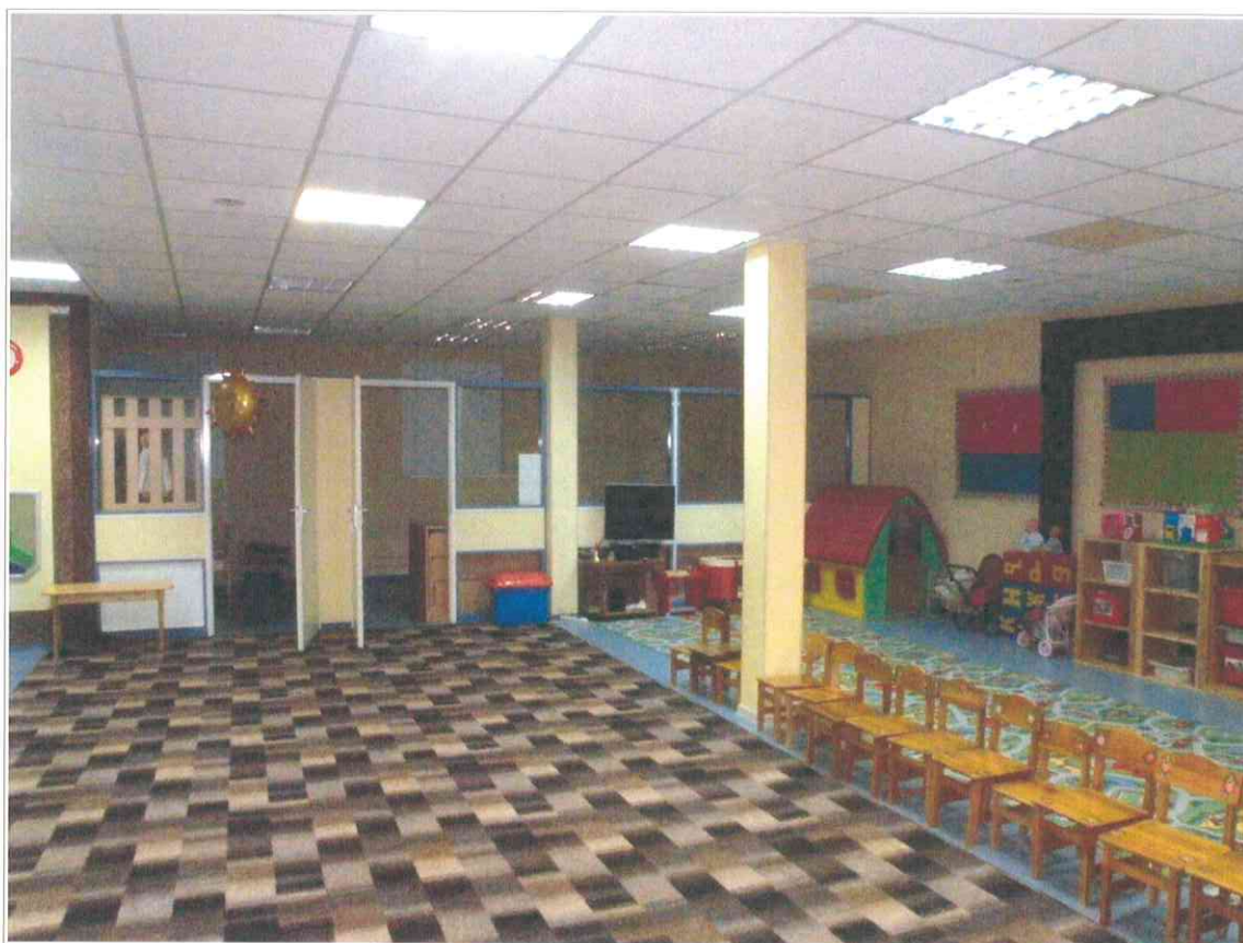
22. «Синагога солдатская, 1872 г.». Интерьер помещения подвального этажа.