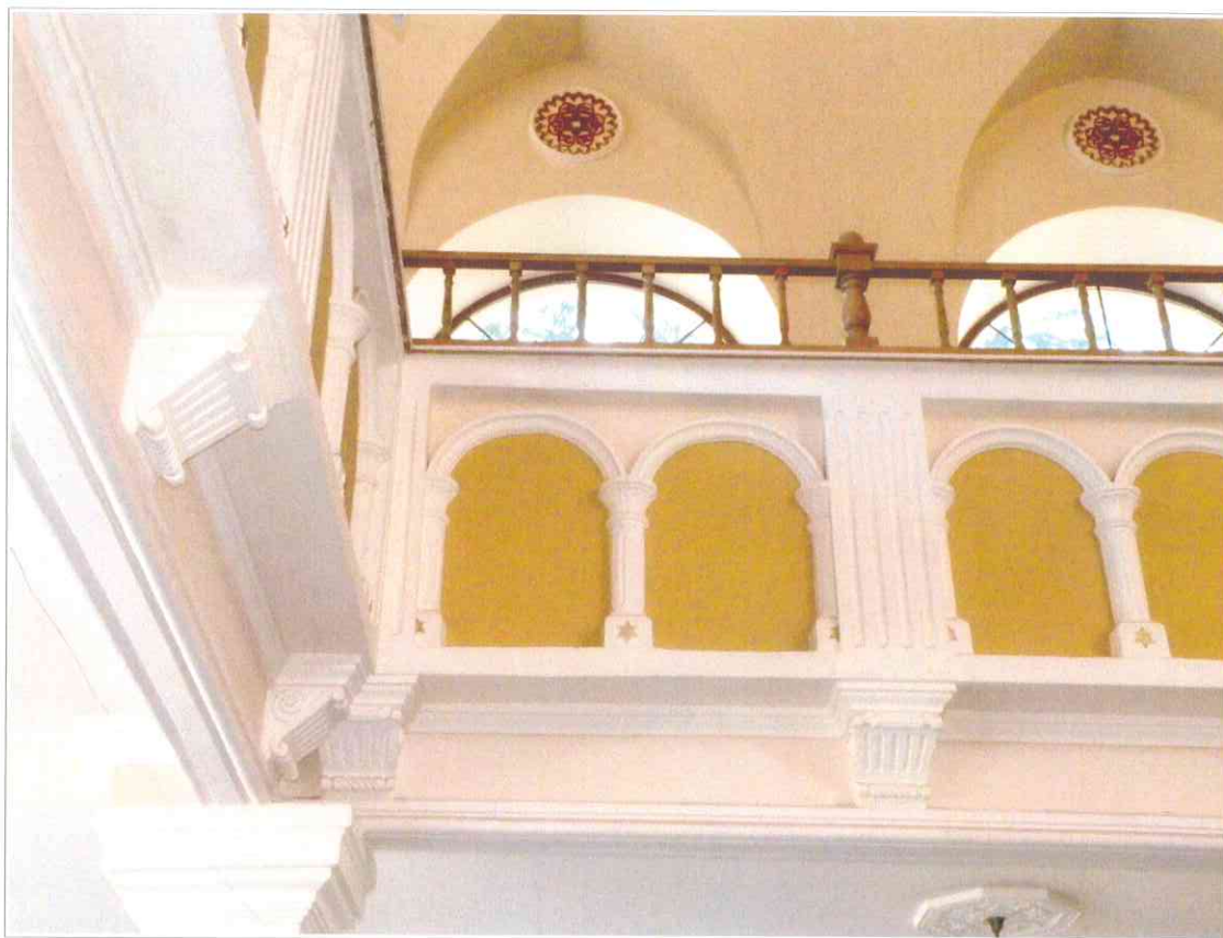
21. «Синагога солдатская, 1872 г.». Интерьер молельного зала. Ограждение обходной галереи.