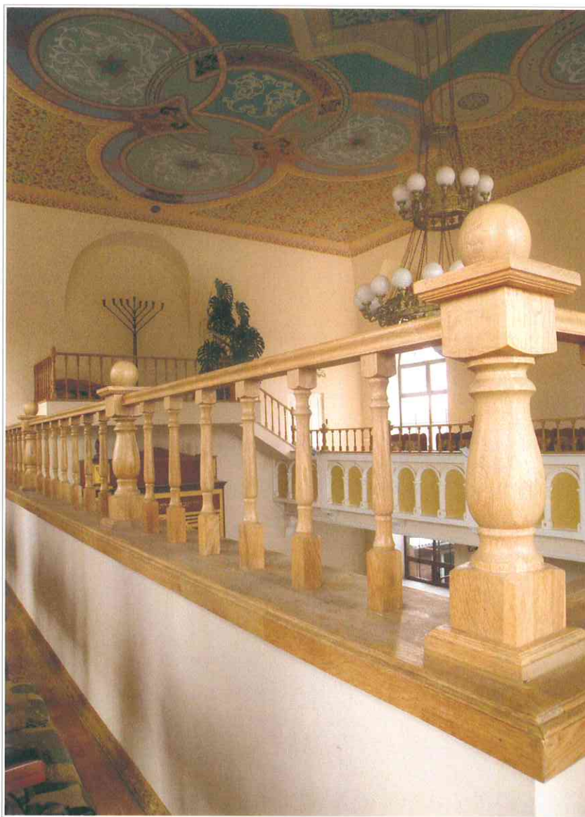
20. «Синагога солдатская, 1872 г.». Интерьер молельного зала. Балюстрада ограждения обходной галереи.