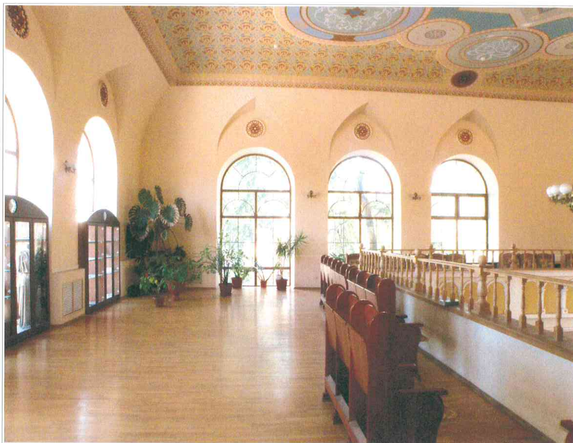
19. «Синагога солдатская, 1872 г.». Интерьер молельного зала. Вид с обходной галереи.