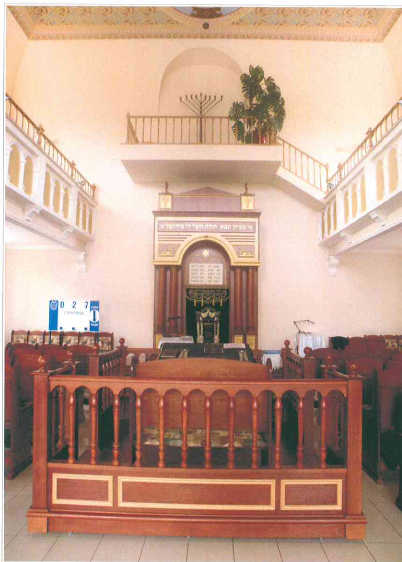
14. «Синагога солдатская, 1872 г.». Интерьер молельного зала. Общий вид.