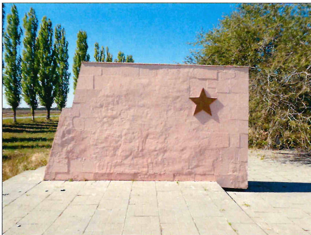
4. «Скульптурный памятник артиллеристам батареи Оганова с элементами благоустройства». Рельефное изображение на восточной грани крайнего западного пилона.