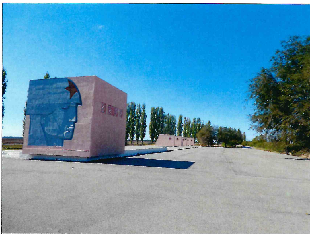
2. «Скульптурный памятник артиллеристам батареи Оганова с элементами благоустройства». Восточная часть мемориала. Вид с северо-востока.