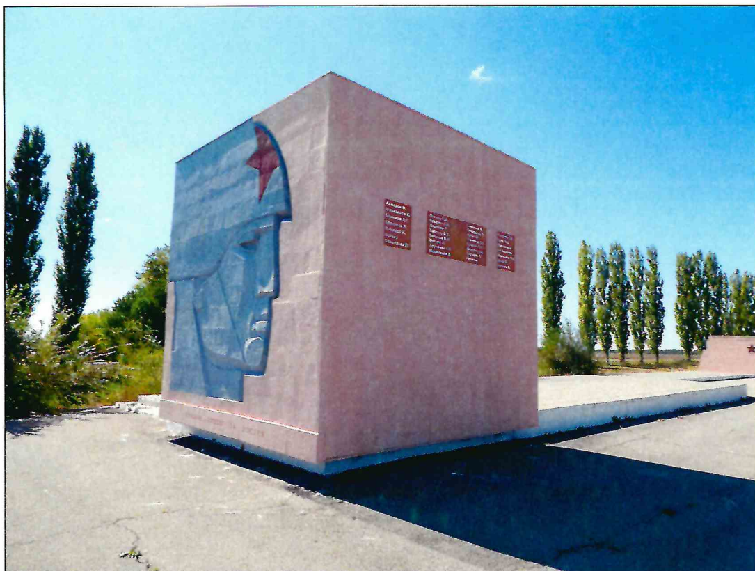
3. «Скульптурный памятник артиллеристам батареи Оганова с элементами благоустройства». Кубический объем. Вид с северо-востока.