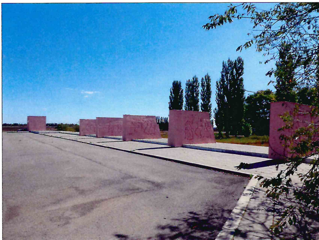
16. «Скульптурный памятник артиллеристам батареи Оганова с элементами благоустройства». Восточная часть мемориала. Вид с северо-запада.