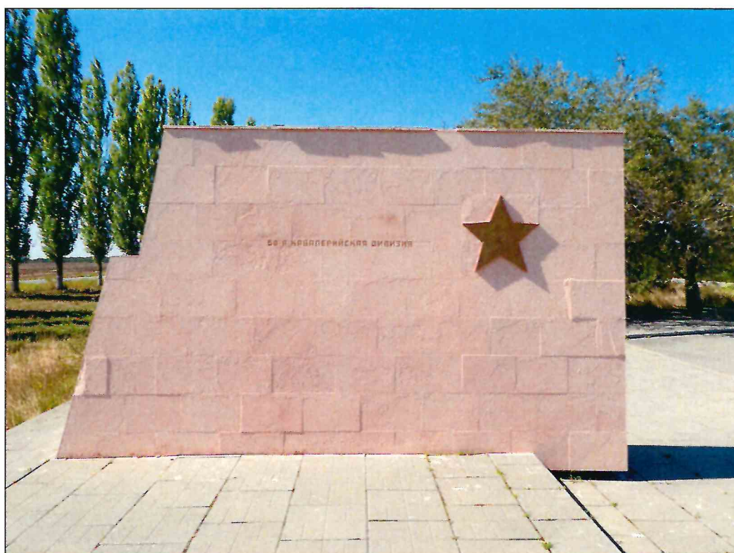
6. «Скульптурный памятник артиллеристам батареи Оганова с элементами благоустройства». Рельефное изображение на восточной грани пилонa первого к востоку от крайнего западного пилонa.