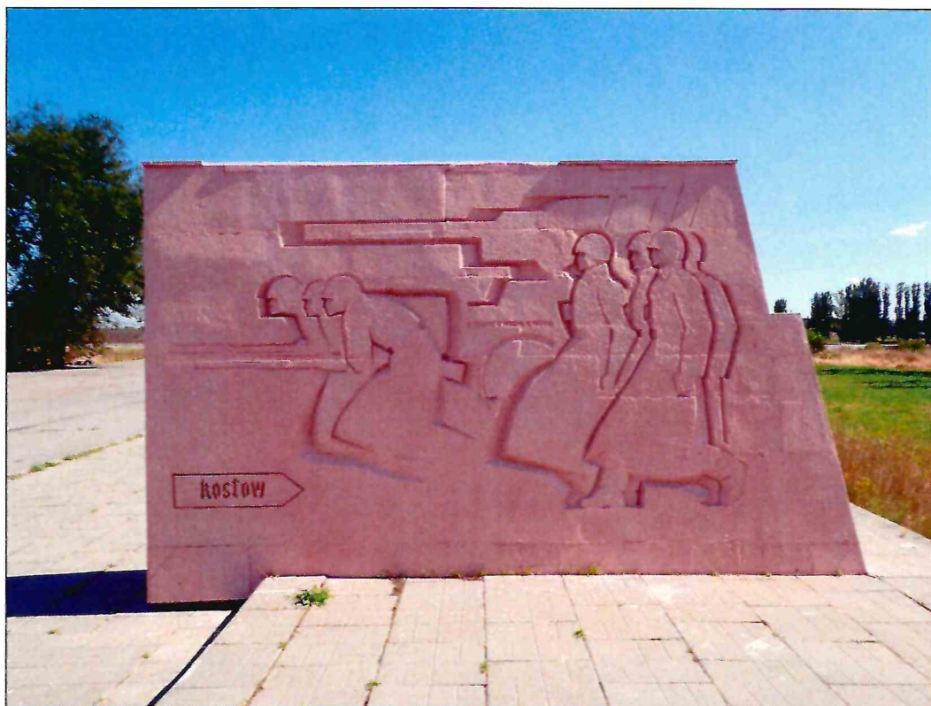
9. «Скульптурный памятник артиллеристам батареи Оганова с элементами благоустройства». Рельефное изображение на западной грани второго к востоку пилона.