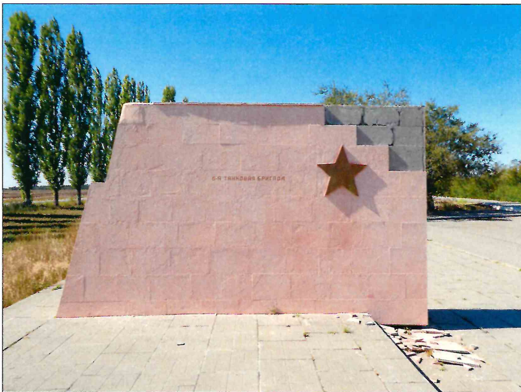
8. «Скульптурный памятник артиллеристам батареи Оганова с элементами благоустройства». Рельефное изображение на восточной грани второго к востоку пилона.