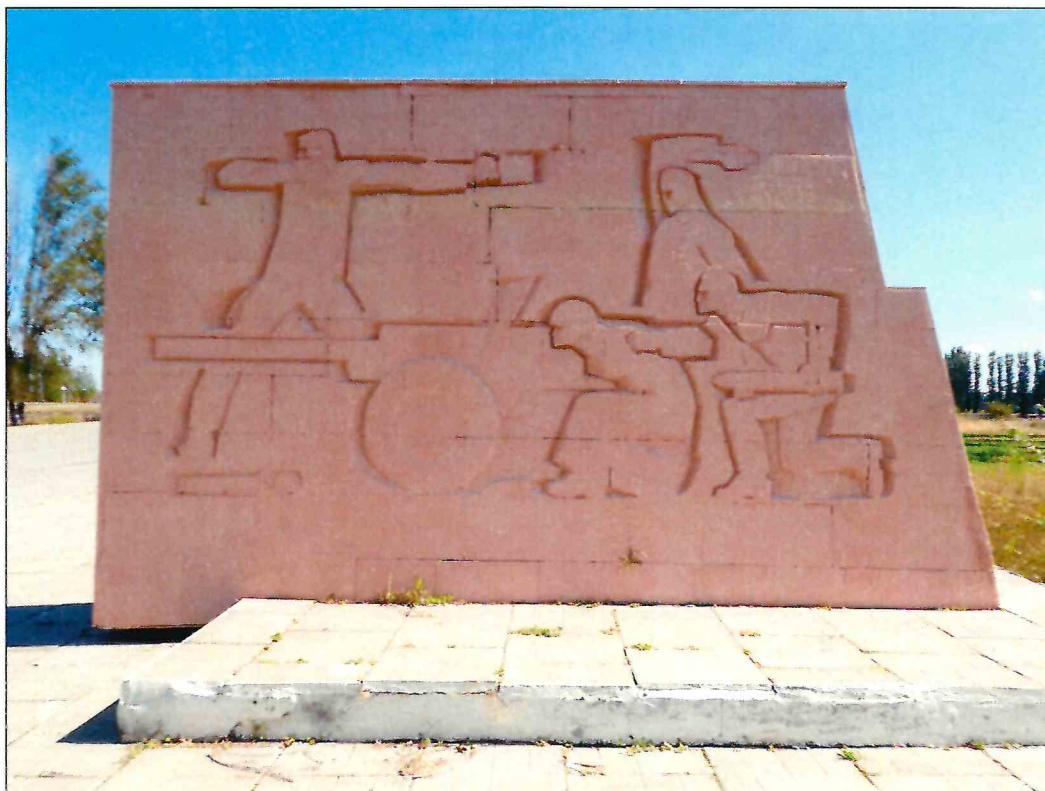
5. «Скульптурный памятник артиллеристам батареи Оганова с элементами благоустройства». Рельефное изображение на западной грани крайнего западного пилона.