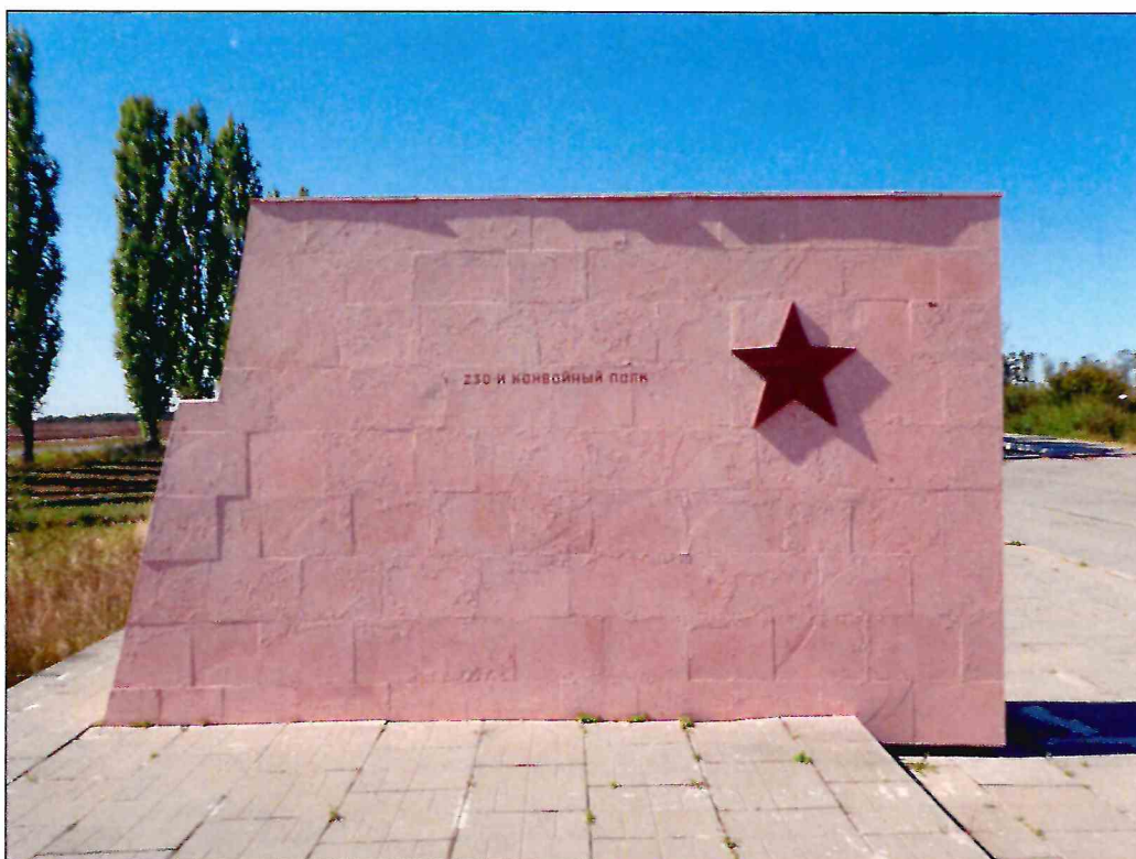
10. «Скульптурный памятник артиллеристам батареи Оганова с элементами благоустройства». Рельефное изображение на восточной грани третьего к востоку пилона.