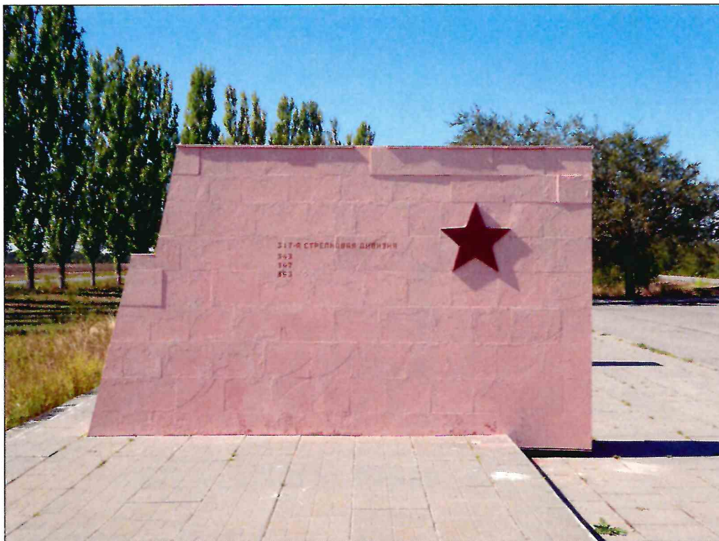
12. «Скульптурный памятник артиллеристам батареи Оганова с элементами благоустройства». Рельефное изображение на восточной грани крайнего восточного пилона.