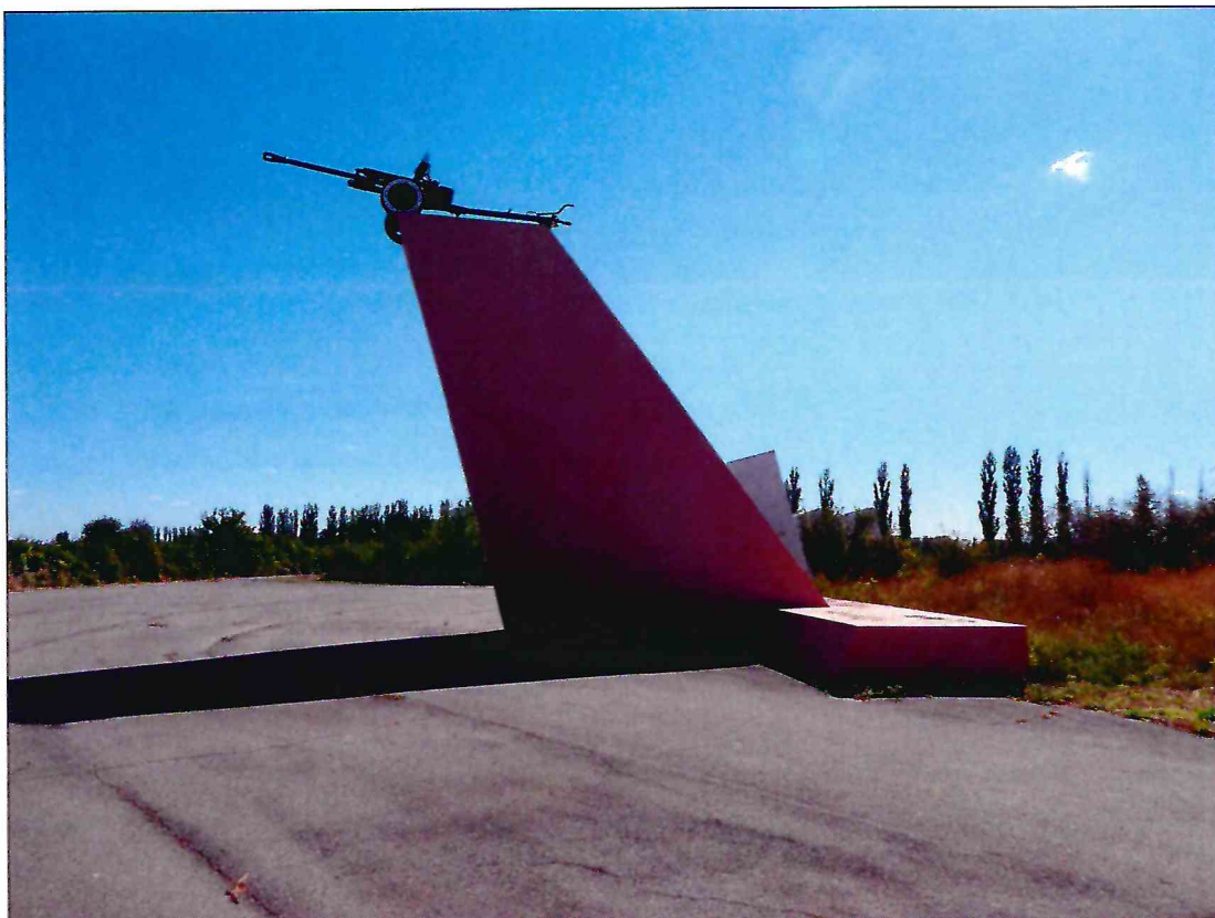
15. «Скульптурный памятник артиллеристам батареи Оганова с элементами благоустройства». Артиллерийское 75-мм орудие на пьедестале. Вид с запада.