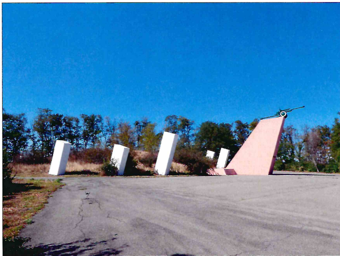
14. «Скульптурный памятник артиллеристам батареи Оганова с элементами благоустройства». Западная часть мемориала. Вид с юго-востока.