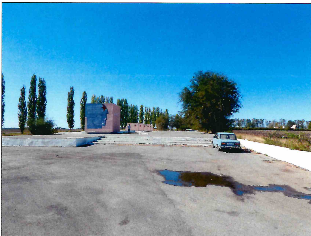
1. «Скульптурный памятник артиллеристам батареи Оганова с элементами благоустройства». Восточная часть мемориала. Вид с востока.