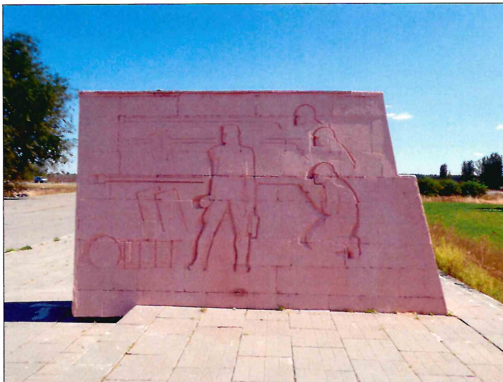
11. «Скульптурный памятник артиллеристам батареи Оганова с элементами благоустройства». Рельефное изображение на западной грани третьего к востоку пилона.