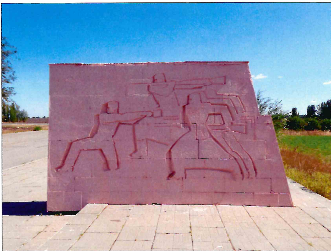
13. «Скульптурный памятник артиллеристам батареи Оганова с элементами благоустройства». Рельефное изображение на западной грани крайнего восточного пилона.